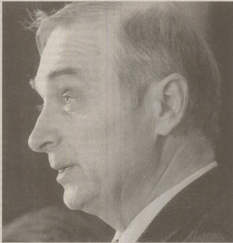
Scritorul Ion Drută a participat la alegeri ca independent în 1989, cerând redeschiderea mănăstirilor.