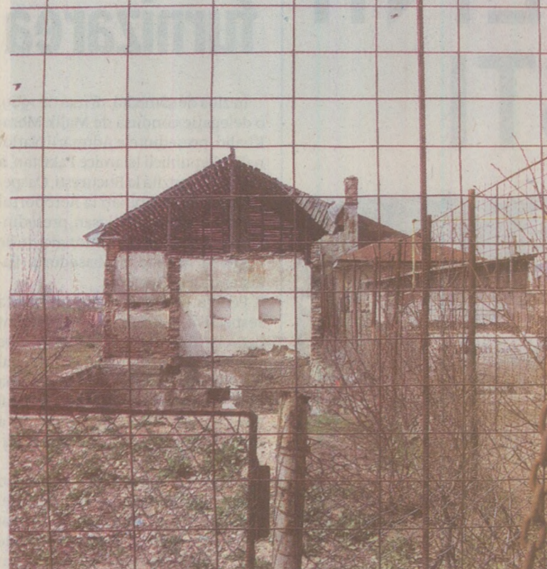
Pe locul fostului CAP se agită niște omuleți ca să construiască o fabrică