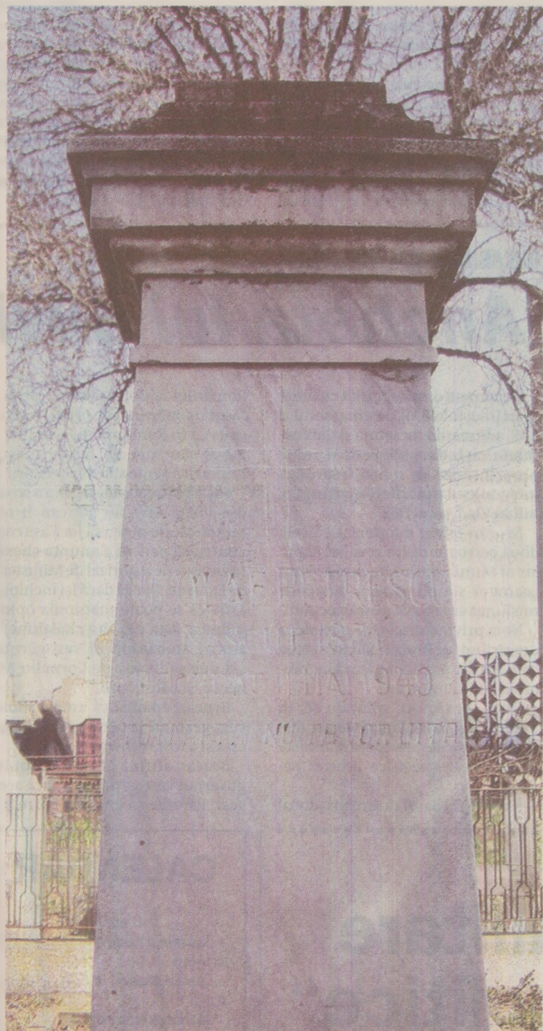
Cum ai putea să te reculegi în fața unei cruci rețezate?