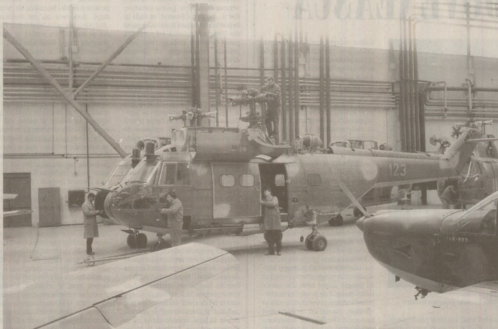
Pe lângă autocamioane, autotractoare și autoturisme de teren, România a oferit Pakistanului și câteva elicoptere realizate la IAR Brașov, sub licență franceză

Ei lucrau ceva, dar se vede că forțele militare (pakistaneze - n. r.)... și eu mai am și alte impresii, sigur n-am dat curs. Cred că în-