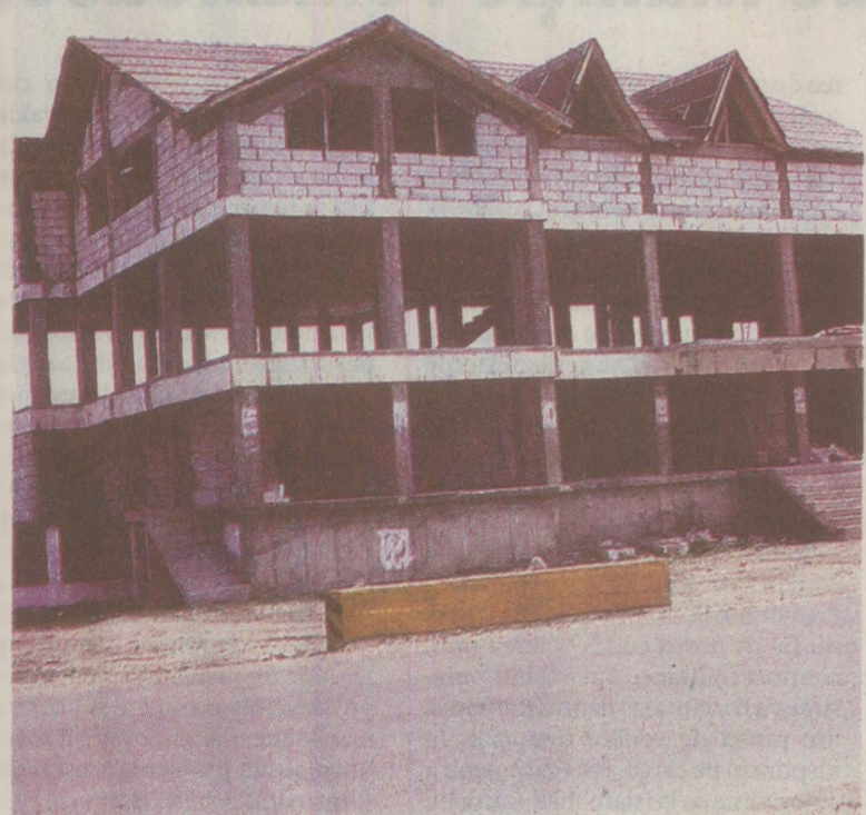
„Centrul Civic” de la intrarea în comuna Petrești trebuia finalizat în 2010