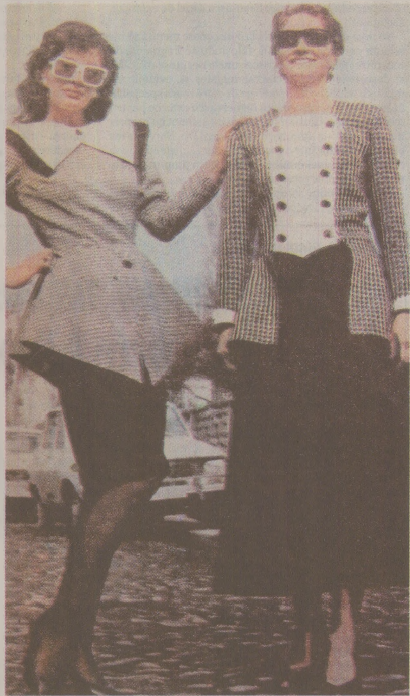
Practic, decent, în culori sobre, de o „eleganță rafinată”, „ansamblul” fustă-taior era „vedetă” indiferent de anotimp.

Singura publicație cu pagini de modă era revista Femeia, editată de Consiliul Național al Femeilor. Prezentăm în cele ce urmează recomandările ei de specialitate pentru moda de primăvară și sfaturile de înfrumusețare (la domiciliu) din luna aprilie.