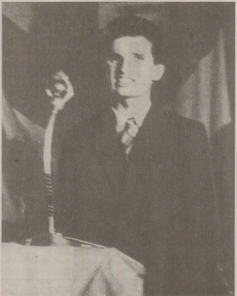
Scrisă și rescrisă de mai multe ori, varianta oficială din '89 a istoriei partidului exagera meritele tânărului Ceaușescu, atribuindu-i un rol mai mare decât avusese în realitate.

În 1955, Congresul al II-lea al Partidului. Aici s-a analizat activitatea Partidului și s-a adoptat un program vast. Azi (19 august 1957 - n.r.) avem 660.000 de membri de partid și can-