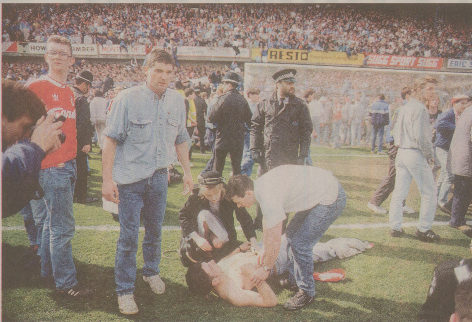
Zeci de suporteri ai lui Liverpool și-au găsit sfârșitul pe stadionul din Sheffield, în fatidica zi de 15 aprilie 1989.

Partida era programată să înceapă la ora 3 după-amiaza. Cu 15 minute înainte de fluierul de start, fanii au fost invitați să-și ocupe locurile. Improvabil spus, pentru că la acea vreme nu existau scaune, ci doar peluze cu gradene și locuri în picioare, iar capacitatea tribunei era deseori depășită. Presa vremii relatează că o parte din fanii veniți din Lancashire au fost întârziți de lucrări la carosabil neanunțate anterior, astfel că între 14:30 și 14:40, la intrarea peluzei care fusese alocată susținătorilor lui Liverpool, încă se afla o mare de oameni. Pentru a evita îmbulzeala la porțile de acces dotate cu turnicheți, forțele de ordine au decis deschiderea unor alte porți folosite în mod normal pentru evacuare. Astfel, câteva mii de persoane au năvălit brusc pe stadion. Unii dintre suporteri aflați în față au fost prinși într-un perimetru îngust, iar 96 dintre ei au fost zdrobiți. Inițial, puțini și-au dat seama de ceea ce se întâmplase. Oamenii erau atenți la meciul care între timp începuse. Abia la ora 15:06, arbitrul, avertizat de Poliție, a oprit jocul. Bilanțul a fost tragic: 94 de persoane au murit, iar 766 au fost rănite. Patru zile mai târziu, numărul celor decedați a ajuns la 95, după ce un băiat de 14 ani s-a stins și el la spital. Ultimul care și-a pierdut viața a fost Tony Bland, în martie 1993, după aproape patru ani de comă. Printre victimele de la Hillsborough s-a aflat și un văr primar al lui Steven Gerrard, actualul căpitan al „cormoranilor”.