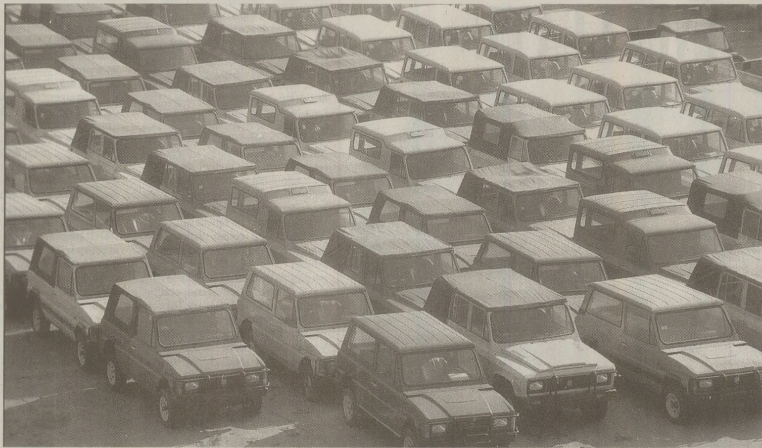
Refuzate de partenerii externi, autoturismele de teren ARO au mărit stocurile uzinei constructoare

În anul 1988, în treprinderea de Comerț Exterior, „Auto-Dacia” s-a confruntat cu o problemă majoră și în Israel, unde un partener de afaceri a dat faliment. În consecință, au rămas pe stoc 1.400 de autoturisme, în valoare de 3,3 milioane de dolari. Societatea românească a fost nevoită să încheie, „un nou contract pentru 1989, într-o altă specificație”, iar mașinile nevândute au fost livrate pe piața internă la începutul anului 1989.