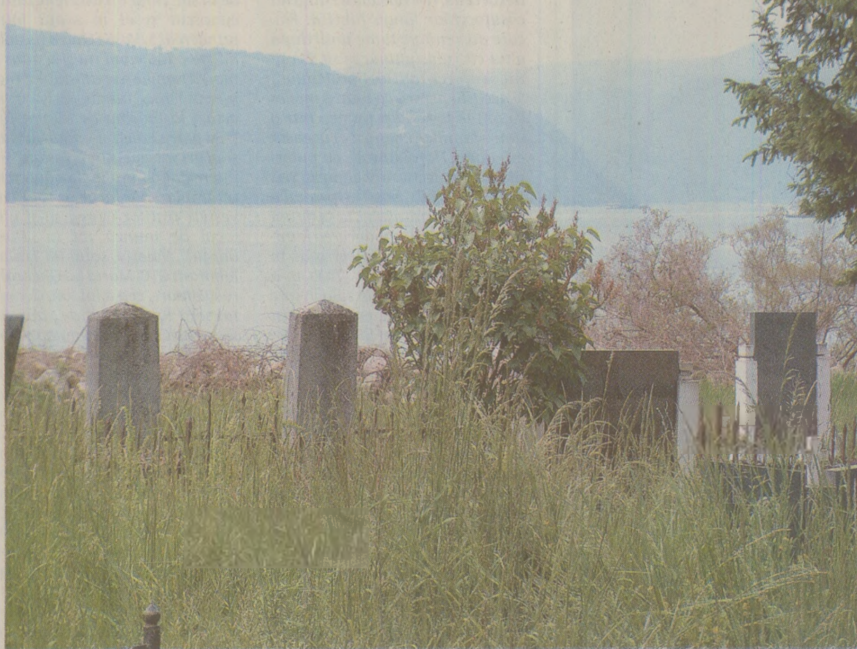
De ar fi știut frontieriștii anului 1989 că de Crăciun românii aveau să-și ia porția de libertate, poate nu și-ar mai fi riscat viețile și acum ar fi putut trece granița doar cu buletinul