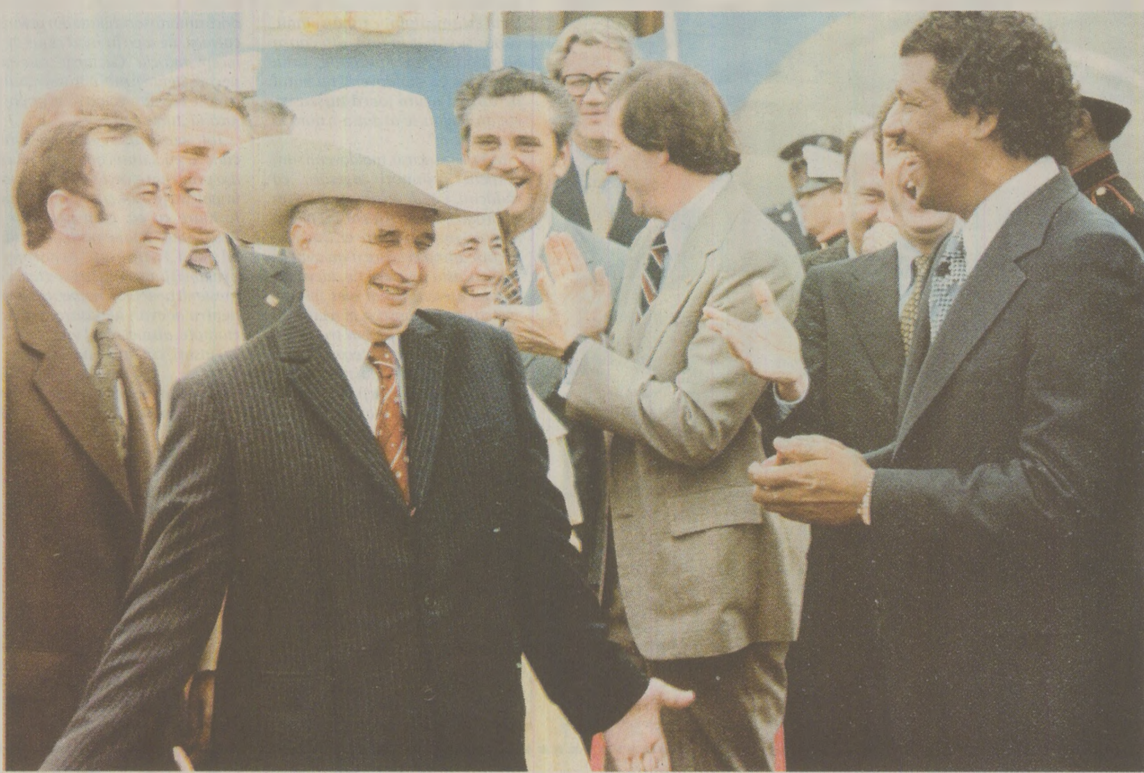
Criticat de Europa Occidentală, de SUA, ba chiar și de „frații” maghiari, pentru Ceaușescu vremurile când era primit de mai-marii lumii erau o amintire