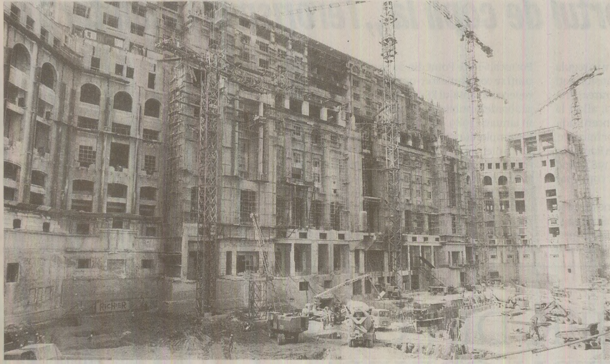
Presa internațională blama Guvernul de la București pentru investițiile de mare anvergură, precum Casa Poporului, realizate cu prețul înfometării populației

Valere BURLACU Gheorghe STAIUCI Tribuna Ialomiței, nr. 2694 din 1989