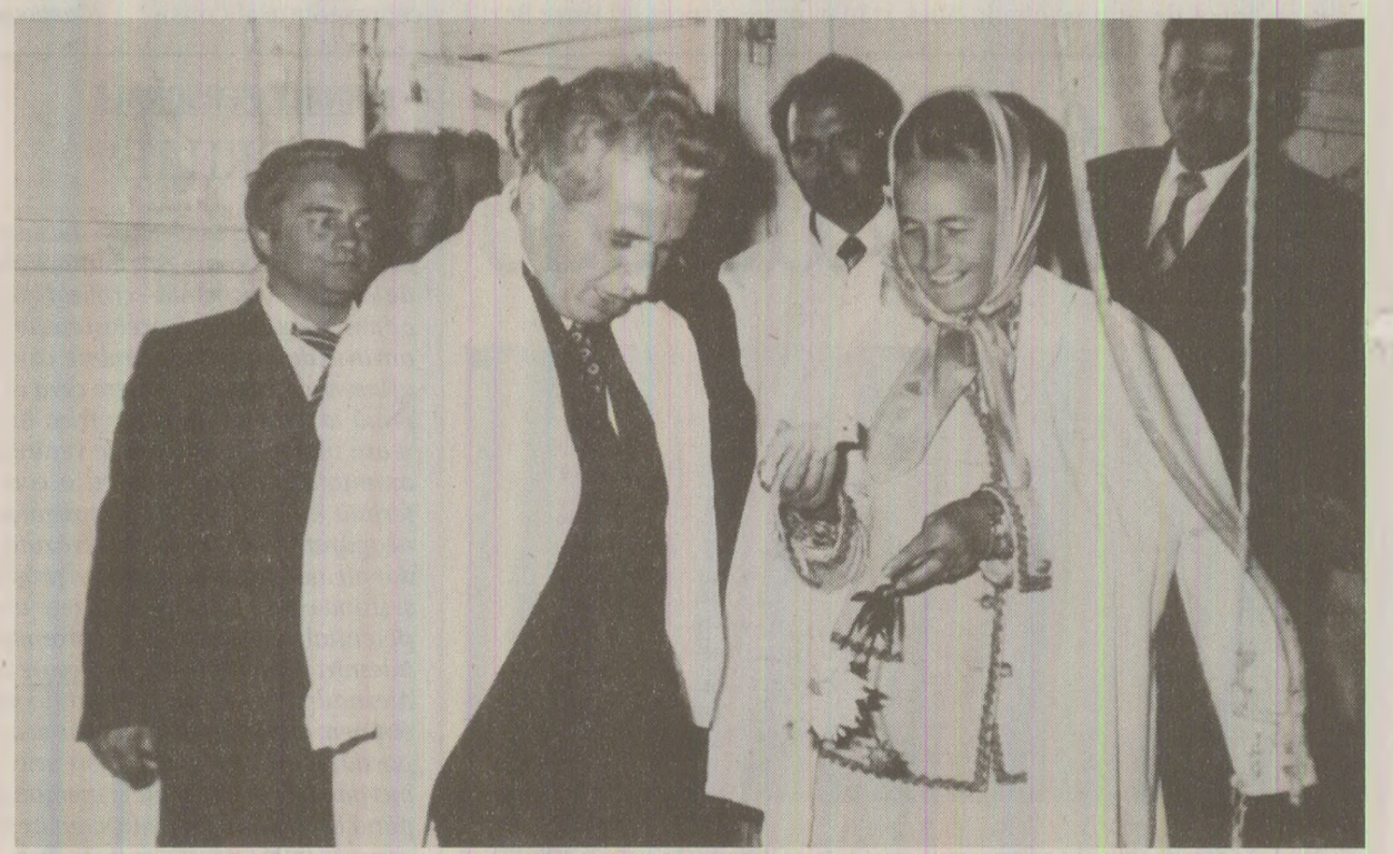
Sosirea primăverii a scos din amoroșii CAP-urilor și fermele zootehnice

Circa 20.000 de „oameni ai muncii” din Pașcani (jud. Iași) s-au strâns în centrul localității pentru a participa la „entuziasta” adunare populară organizată de șefii partidului pentru „marcarea” achitării datoriei externe. Participanții au arborat steaguri roșii și tricolore, iar în fața cortegiului câțiva muncitori purtau portretele lui Nicolae și Elena Ceaușescu. La final, organizatorii au întocmit o telegramă Tovarășilor, în care le transmiteau: „Participanții la adunarea populară din orașul Pașcani trăiesc, asemenea întregului partid și popor, sentimente de nețărmurită bucurie, de vibrantă și legitimă mândrie patriotică, prilejuită de faptul că patria noastră înscrie în bilanțul marilor