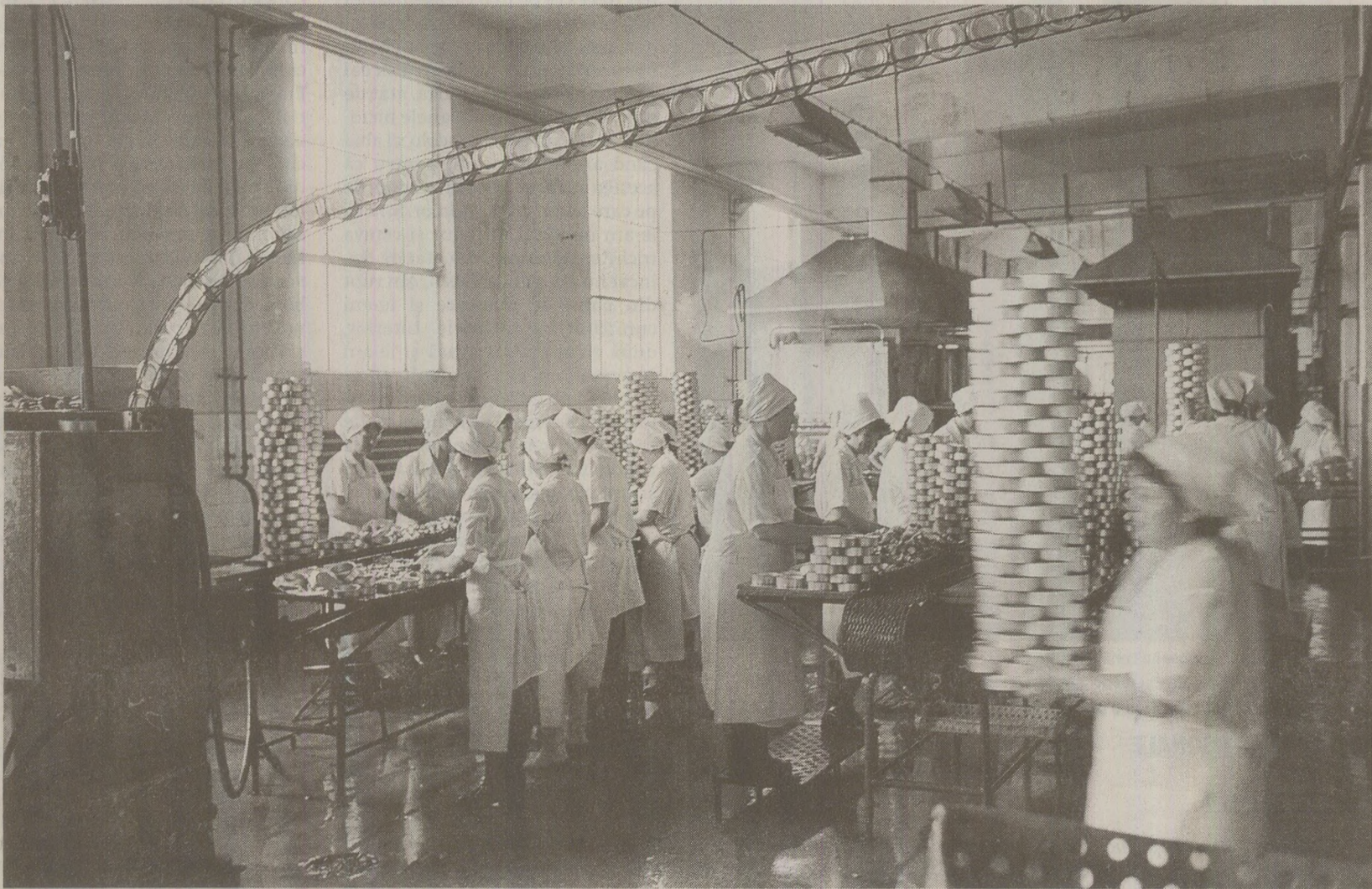
Criza alimentară a anilor '80 era „potolită” de responsabilii aprovizionării populației cu conserve de pește