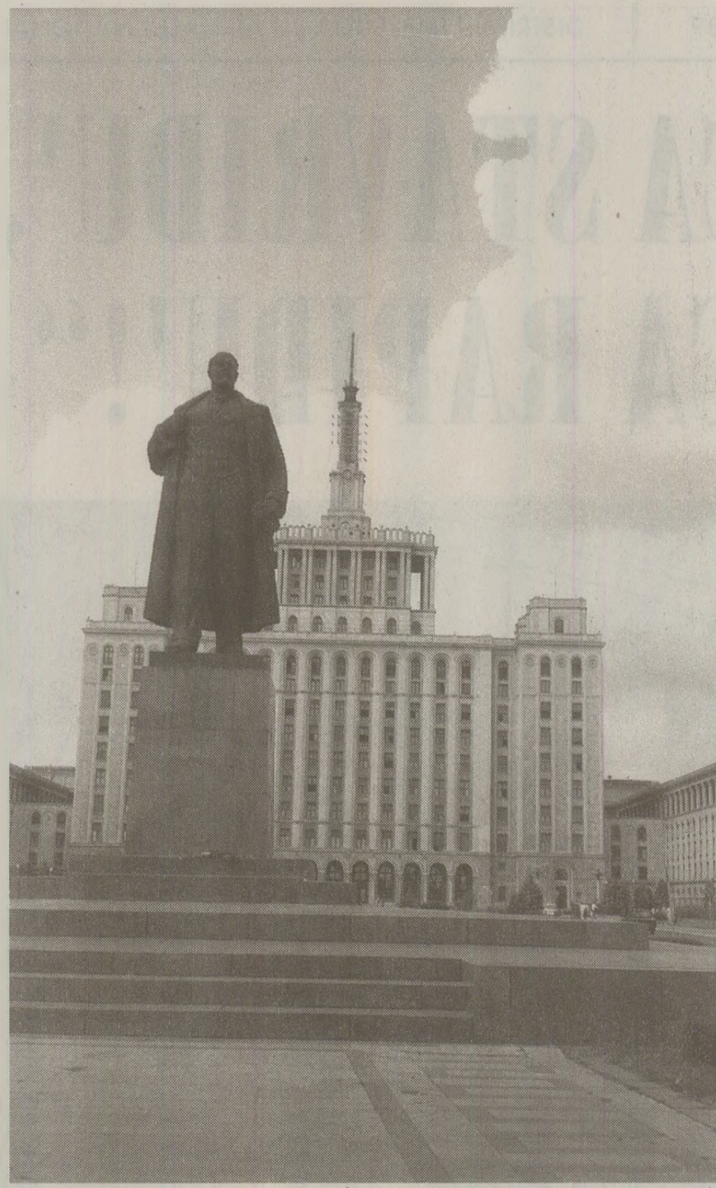
Uneori, statuia lui Lenin din fața Casei Scînteii era loc de întâlnire între gazetari și responsabili cenzurii