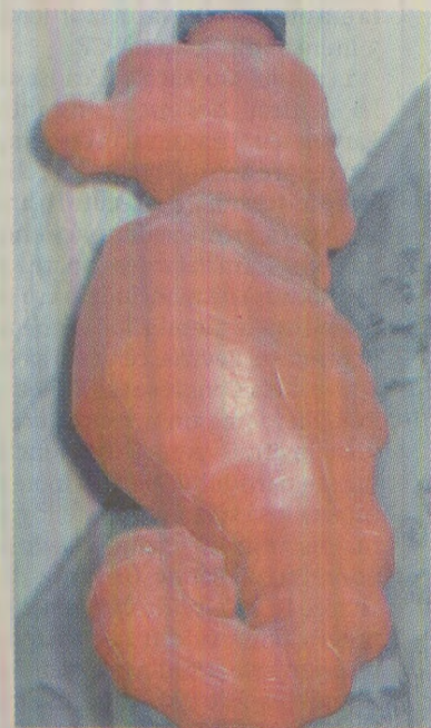
Prin moulul călătului de mare pe post de recipient din plastic, curgea șampon de proastă calitate