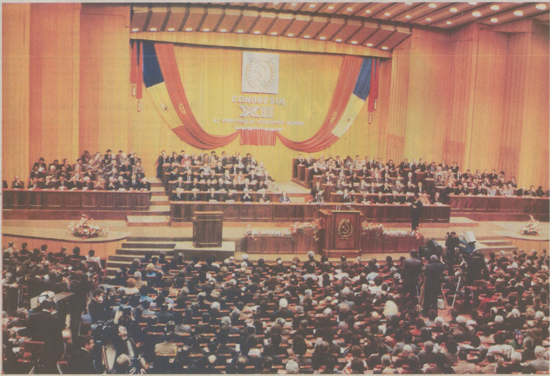
La Congresul al XII-lea al PCR, Constantin Pârvulescu l-a criticat pe Nicolae Ceaușescu pentru puterile sporite ce și le atribuse. Consecința – a fost dat afară din partid!

Idila va aduce consecințe nefaste în mica grupare a ilegalității române. Afându-se împreună, uitaseră într-un taxi documente din arhiva partidului. Predată Siguranței de băitul care-a spălat mașina, au condus la arestări. „Căderile” acestea vor fi puse în seama lui Foriș și a apropiaților săi ca „dovezi” ale colaborării cu Siguranța. Foștii amorozi zăpăciți își vor asuma însă roluri de martori mincinoși și justițiar necinstiți în dramele ce vor urma. Ana Toma va fi martor al acuzării în „procesul Pătrășcanu”, învinuindu-i de trădare pe membrii Secretariatului condus de Foriș și cu „dovada” propriei sale neglijențe. Iar Constantin Pârvulescu, președinte al Comisiei de Control al partidului, va certi-