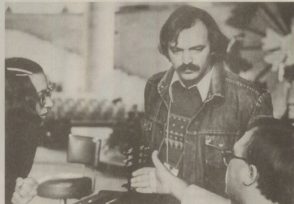
Victor Socaciu a reușit să ducă la Mamaia piesa „Libertate”, compusă în primăvara lui 1989

„Ideal, ideal, ca un zbor înalt”... Victor Socaciu vorbea (sau mai bine-zis cânta) despre libertate în plină Epocă de Aur! În 1989, Victor Socaciu voia Libertate. Așa se face că, în primăvara aceluia an a compus melodia cu același titlu. Și-a luat chitara-n mână și înima-n dinți și s-a prezentat cu această piesă la Festivalul de la Mamaia. Era cunoscut, la fel ca și acum, drept un exponent al folkului românesc, însă a simțit nevoia de libertate de exprimare. De a-și arăta și o altă latură artistică, dar și ideea de a lansa un mesaj extrem de îndrăzneț pentru perioada aceea: acela de a privi libertatea ca pe un ideal, care la un moment dat chiar va fi atins. Cum de-a scăpat de cenzură, nici chiar artistul nu-și da seama. „Și eu m-am mirat cum de-a reușit să treacă de presecții și selecții acele cântece. Participam pentru prima dată la Festivalul de la Mamaia, la Secțiunea Creație. Am avut o mare surpriză când am aflat că piesa a fost acceptată. Am interpretat-o atunci în primă audiere. Îmi amintesc că am fost singurul readus la rampă. A trebuit să vin din nou în scenă, fiindcă aplauzele nu se mai opreau”, își amintește Victor Socaciu. Care a fost secretul succesului? „Mesajul, cu siguranță - susține artistul. Acesta a fost punctul forte. Nu neapărat compoziția sau acordurile. Cel mai important a fost mesajul. Nu am luat nici un premiu la ediția cu pricina, dar știu sigur că a fost una dintre cele mai aplaudate piese”, ne-a declarat cantautorul.