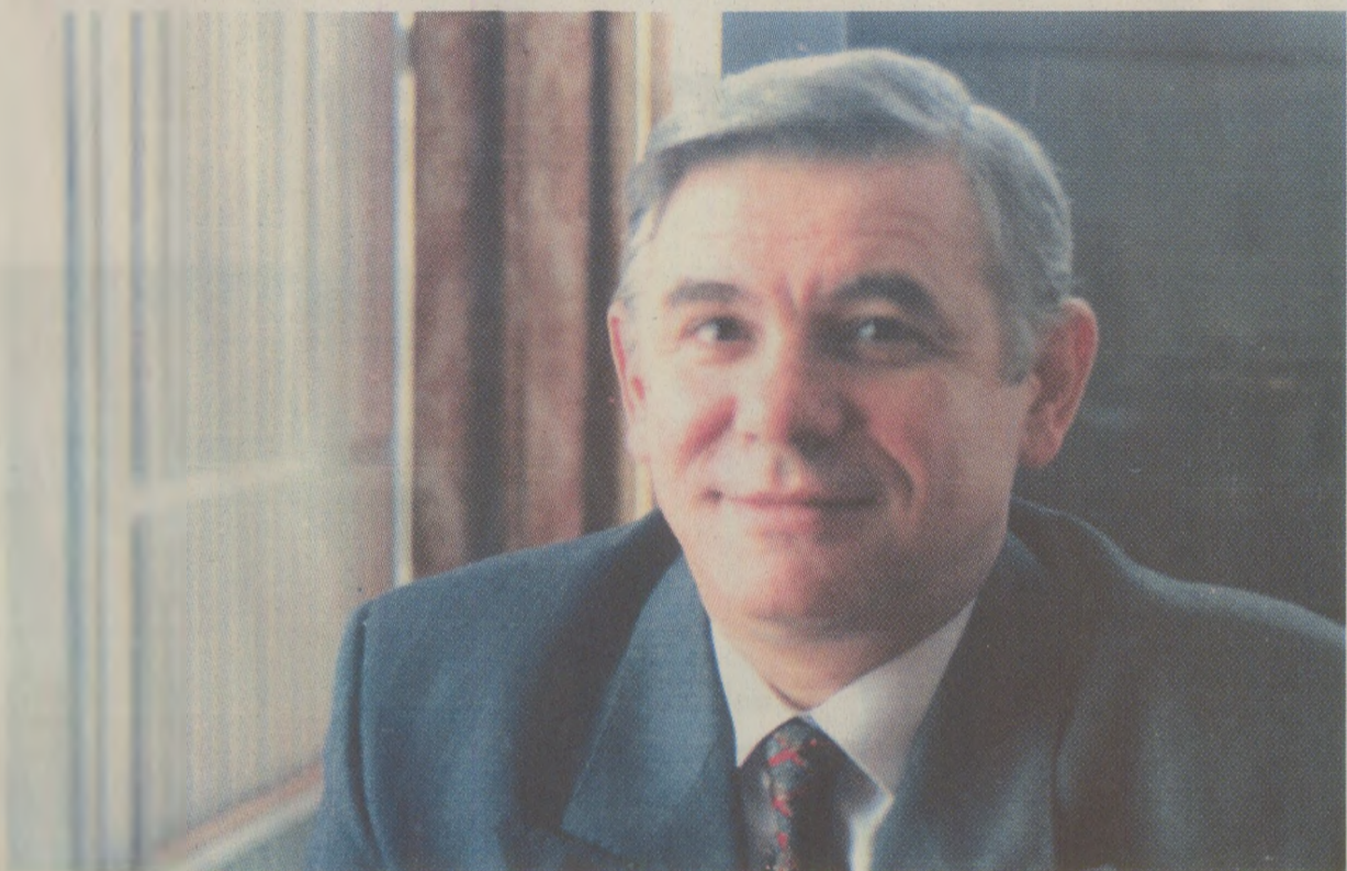
Cotidianele Le Monde și El Pais din 2 iunie scriau că Theodor Meleşcanu, delegatul României la Conferința pentru Securitate și Cooperare în Europa (CSCE) de la Paris, a reiterat refuzul țării sale de a accepta mecanismele adoptate de țările CSCE în privința respectării drepturilor omului

La începutul lunii iunie, presa europeană debătea intens acuzațiile aduse regimului de la București, referitoare la încălcarea drepturilor omului. În aceeași zi, la 2 iunie 1989, două dintre ziarurile importante ale vremii (El Pais și Le Monde) publicau articole pe această temă.