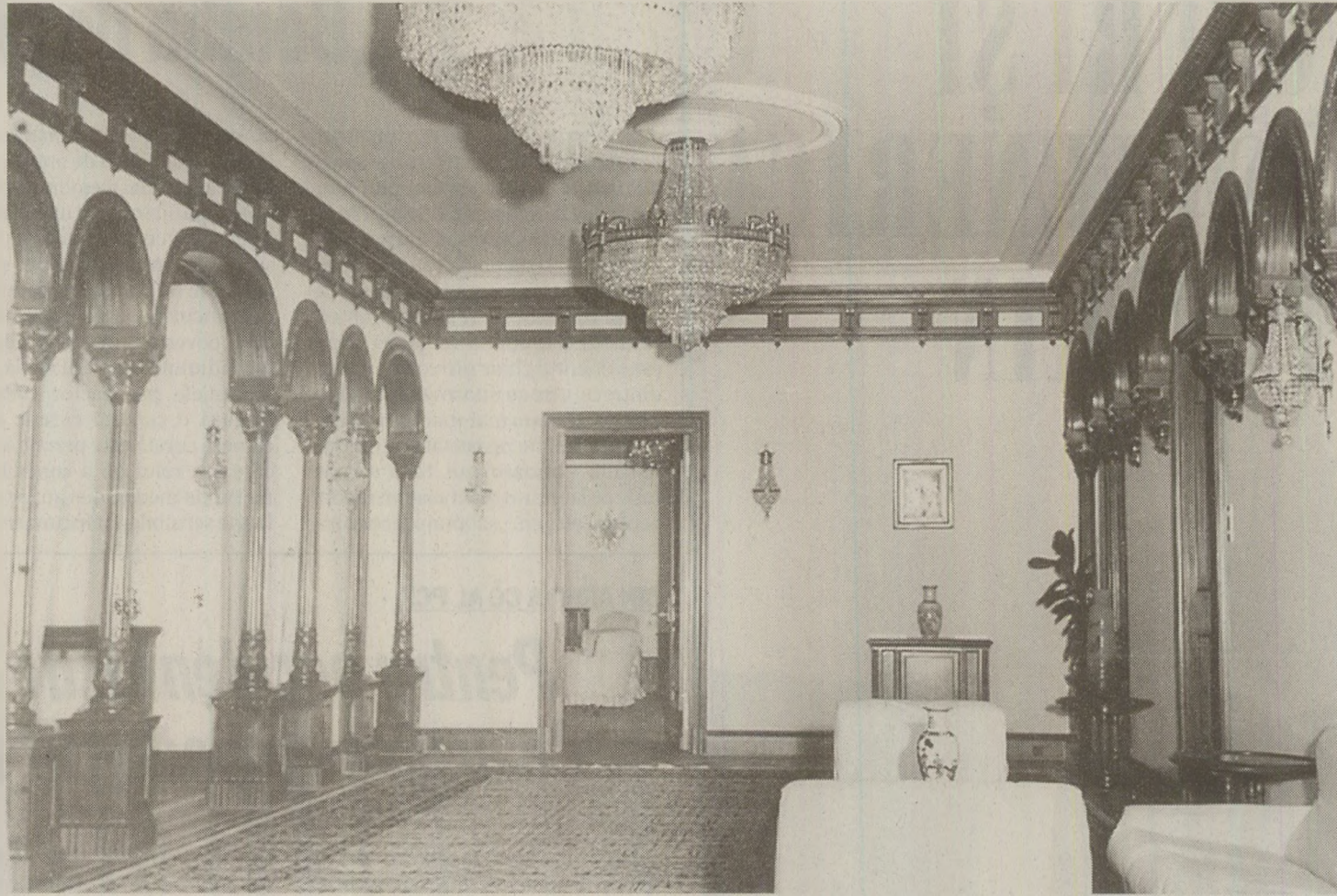
Printre legendele țesute în jurul cazului de la Vâlcea s-a amestecat și una legată de vila de protocol de la Olănești, construită între 1986 și 1989 pentru folosința familiei Ceaușescu