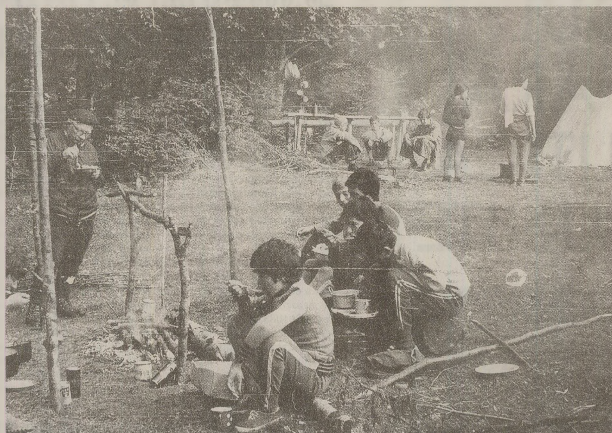
Din cauza crizei alimentare și legislației antiavort, un nou copil care venea pe lume era o povară pentru femeia anului 1989. Tocmai de aceea, numărul avorturilor provocate era ridicat, în ciuda riscurilor medicale și penale.