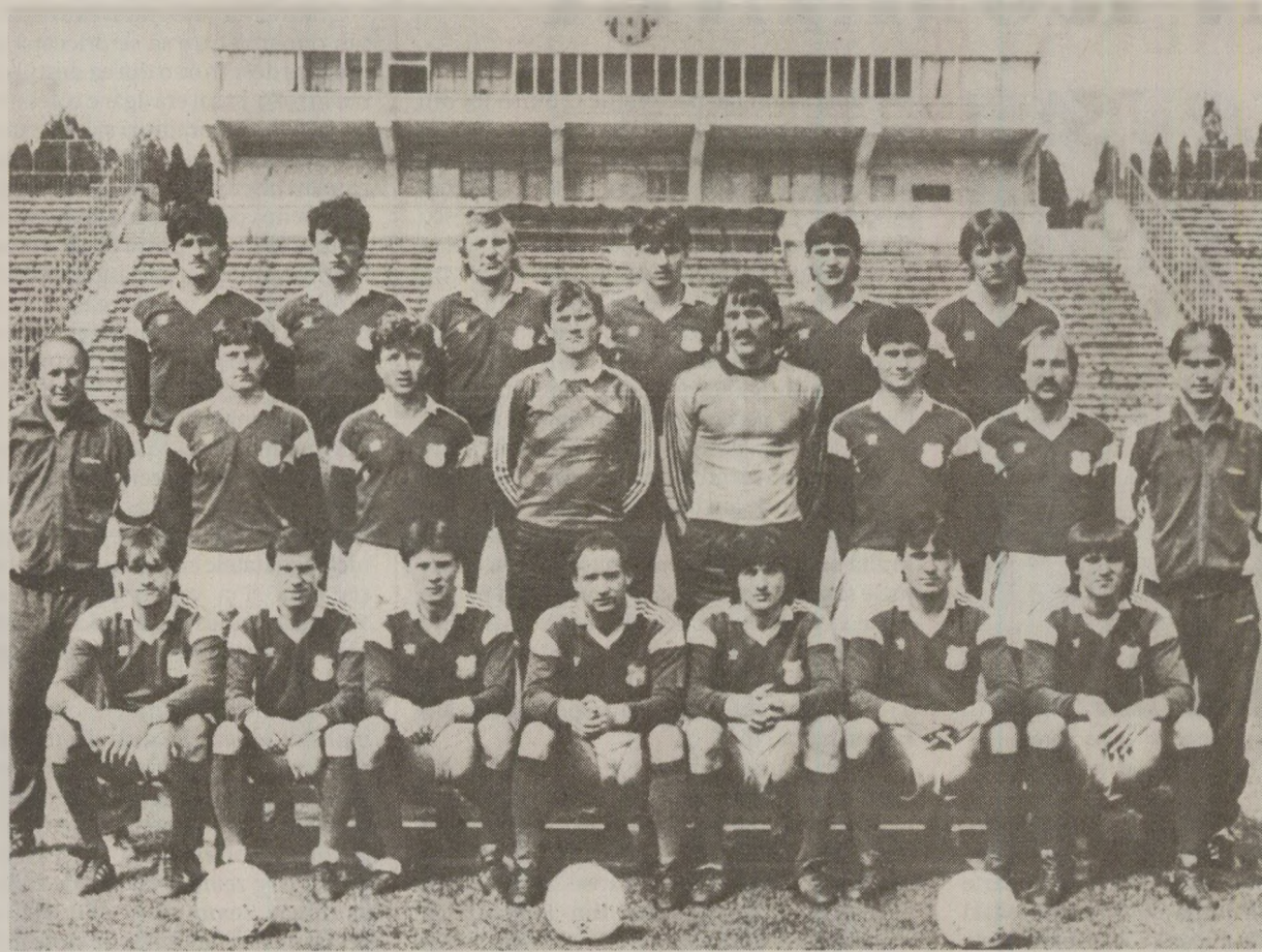
În ultimul sezon din socialism, Steaua București a reușit eventual

Sezonul 1988-1989 din Divizia A s-a încheiat cu a 51-a finală a Cupei României. Noutatea nu a fost faptul că protagonistele s-au numit Steaua și Dinamo, care își disputaseră și ultimele șase finale, ci faptul că partida a fost programată la Brașov! A fost vorba de o premieră în istoria fotbalului românesc, prima finală de Cupă în afara Bucureștiului, deși a mai existat un precedent, care însă nu a intrat în statistici. Era prima finală a Cupei României, în vara anului 1934. S-a decis să se joace la Timișoara, între Ripensia și Universitatea Cluj, meci câștigat de bănățeni cu 3-2 pe teren, dar contestat de adversari la final. Conducătorii federației din acele vremuri au hotărât rejucarea în Capitală, pe arena Venus, fostul stadion „Republicii”, însă tot Ripensia s-a impus, scor 5-0. De atunci, toate finalele s-au disputat în București. Revenind la Steaua – Dinamo, decizia ca Brașovul să fie gazdă a venit în urma incidentelor de la meciul din campionat, 2-1 pentru steliști, disputat în urmă cu două luni în Ghencea, FRF și CNEFS, de teama autorităților comuniste, fiind de părere că era prea periculos ca un nou derby între cele două mari rivale să se dispute pe stadionul „23 August”.