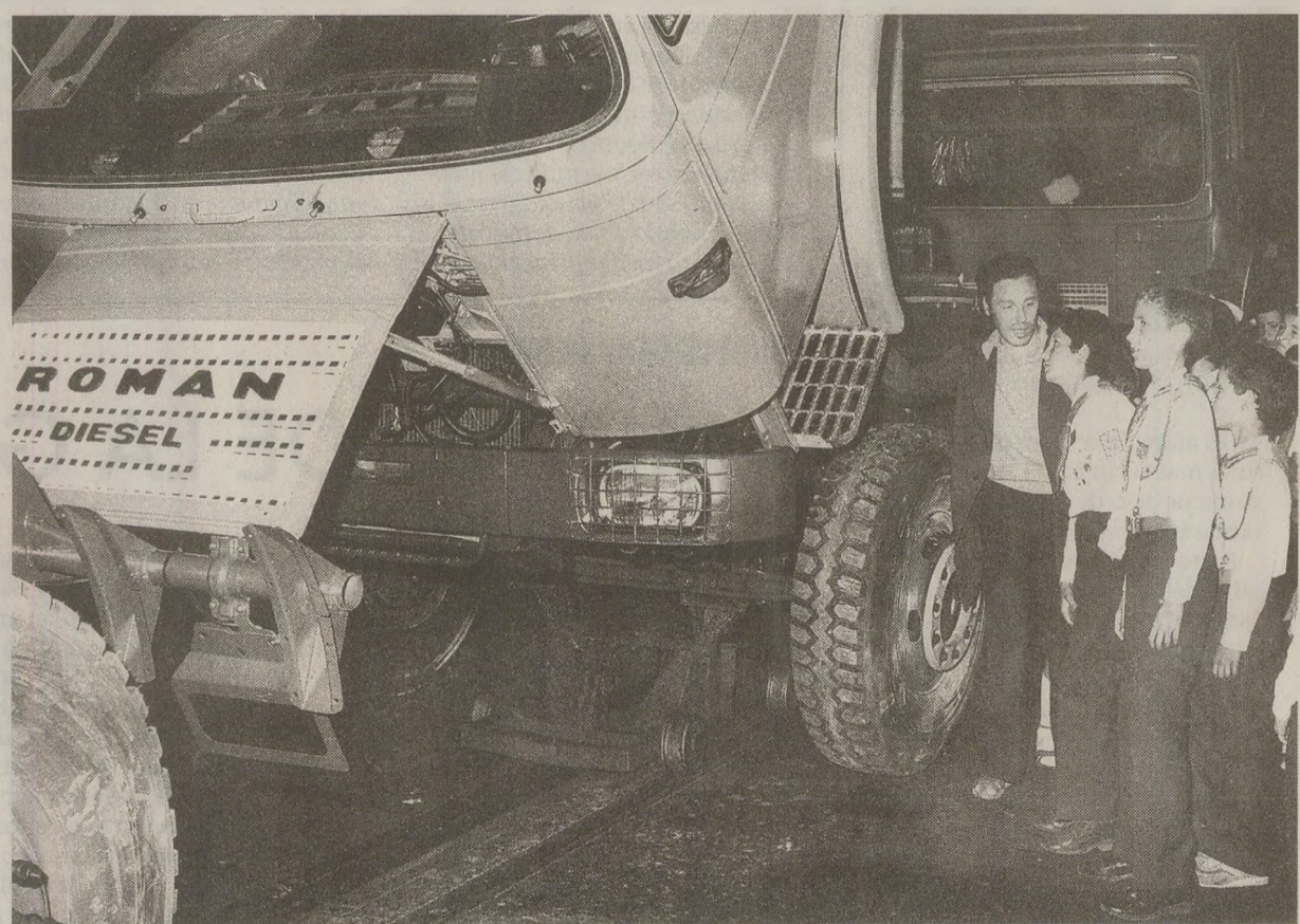
Uzina „Steagul Roșu” din Brașov era printre „unitățile frunțase” ale industriei socialiste. Orice pionier care poposea în orașul de sub Tâmpa avea în program vizitarea întreprinderii de autocamioane

Explicația acestui fenomen se poate găsi în faptul că linia de producție a Steagului Roșu a fost pornită în 1971 cu un model motorizat Diesel sub licență MAN (achiziționată de statul român în 1969 din Germania). Cumpărarea acestei licențe a fost urmată de o amplă dezvoltare tehnologică și umană a Uzinei „Steagul Roșu” (în perioada 1971-1974, urmată de 1975-1979) în același ritm cu întreaga industrie românească, care depindea de transporturi. Mai departe, despre investițiile făcute la Uzina „Steagul Roșu” în acel an nu se pot spune prea multe, parte pentru că utilajele folosite nu necesitau înlocuiri majore, având o vechime de maximum 15 ani. Acest lucru nu era, se pare, simțit pe