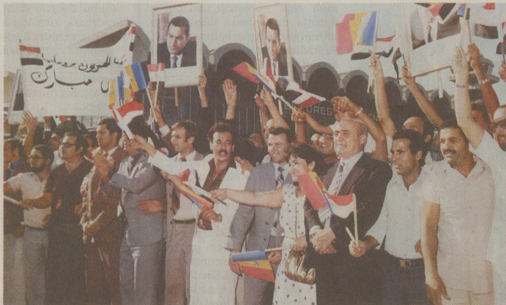
În timpul tratatelor bilaterale cu liderii lumii a treia, Nicolae Ceaușescu a „contractat” și înscriseră unui important număr de studenți străini în universitățile românești

În perioada aceea era destul de greu pentru noi, străinii, să avem contacte cu românii. Eram cazați în așa fel încât să nu prea avem contacte cu românii. Dar eu m-am descurcat și am intrat în legătură cu studenții români. Nu am lăsat să-mi scape nici o șansă de a-i cunoaște pe românii din jur. Am învățat limba română destul de repede. Am avut o profesoare foarte, foarte bună, pe care o respect foarte mult și astăzi. A fost primul român pe care l-am cunoscut bine. Am învățat, cred, mai repede limba română pentru că ne preda fără o limbă ajutătoare, ne preda limba română în românește. Cred că din cauza asta am reușit să învăț mai ușor și mai repede limba română. Tot la Timișoara am văzut prima zăpadă din viața mea. A fost foarte interesant. Iama a fost suportabilă, aveam condiții foarte bune la cămin, căldură suficientă. Bursa pe care am primit-o la început cuprindea și o sumă de bani pentru îmbrăcăminte de iarnă. Îmi aduc foarte bine aminte că profesora noastră a ținut să nu cheltuiam noi bursa asta, ci să mergem cu ea la magazinul Bega, cu toată grupa, și ne-a ajutat să ne cumpărăm haine de iarnă. Probabil că, din expe-