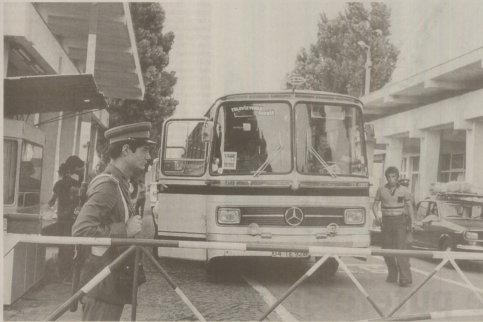
România a fost aspru criticată pentru fortificarea graniței cu Ungaria, Ceaușescu fiind acuzat că și-a construit propria Cortina de Fier în interiorul blocului sovietic

Csaba Tabajdi, vicepreședintele departamentului internațional din cadrul Comitetului Central, a fost suspendat ieri din toate funcțiile, pentru că a declarat unui cotidian italian că