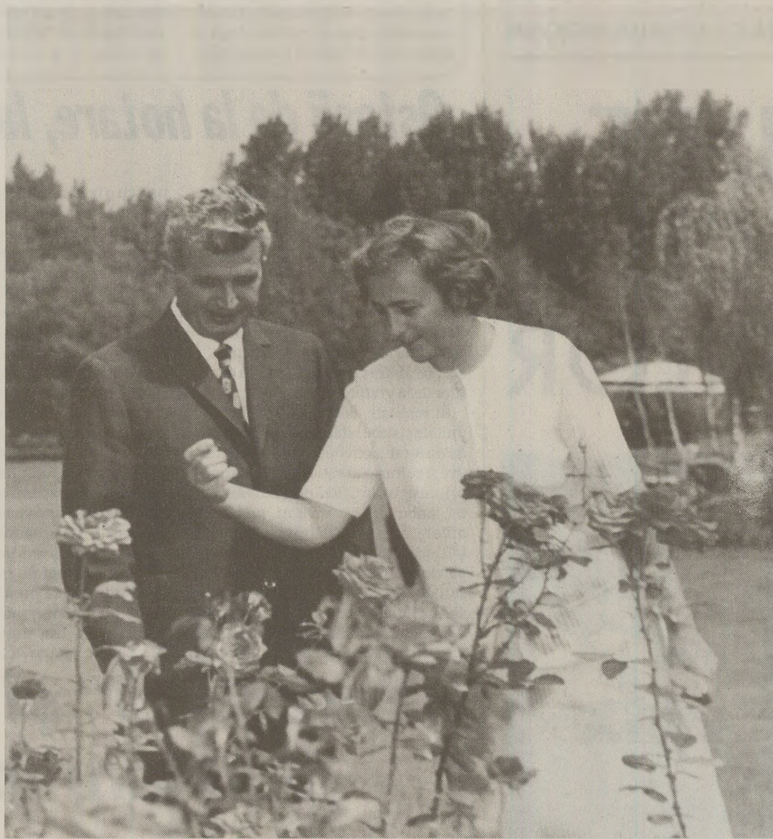
În 1989, momentele de relaxare ale cuplului prezidențial „în câmp deschis” erau atent supravegheate de Securitate

În spatele celor doi, la aproximativ 3-4 metri, doi câini negri și, imediat, în spatele câinilor, apare