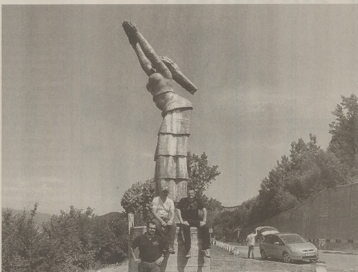
Monumentul Danubia a fost construit la intrare în Orșova în memoria frontieriștilor