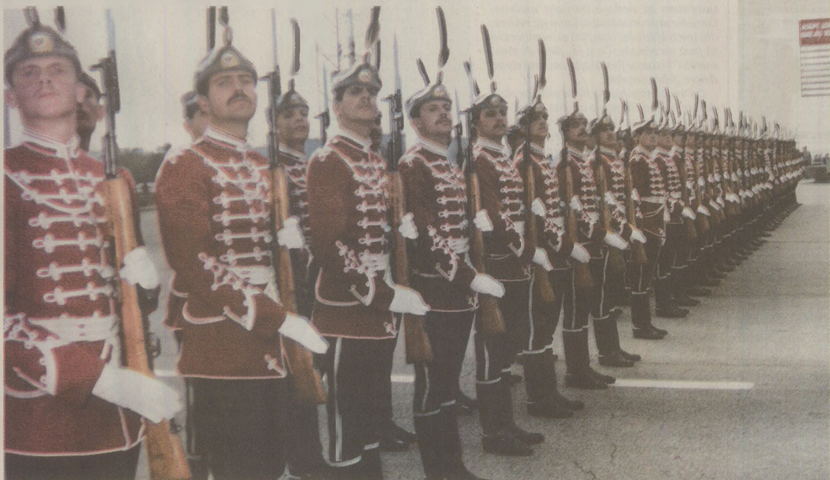
În etapa „național-comunismului”, Bulgaria a reînviat tradiții din secolul al XIX-lea, din perioada luptei împotriva dominației otomane

La 29 mai, într-un discurs mediatizat, Todor Jivkov afirma că, în țara sa, toți cetățenii se bucură de drepturi egale și a trecut la reglarea „conturilor istorice” cu Turcia, reitându-și binecunoscuta afirmație potrivit căreia nu există turci în Bulgaria și că „populația bulgară islamică nu vine de afară”. El a acuzat că „anumite cercuri din Republica Turcia” sunt la originea „unei escadări zilnice a unei campanii anitbulgarești” care pare a fi menită să constituie un „amestec brutal în treburile interne ale unui stat suveran”. Campania ar fi condusă de cercuri care „speră că vor putea întoarce roata istoriei, înapoi, la vremea Imperiului Otoman”.