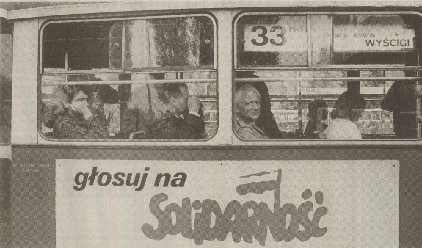
Reformele politice din Polonia și Ungaria erau ascunse opiniei publice din România. Solidarnosc era un cuvânt necunoscut