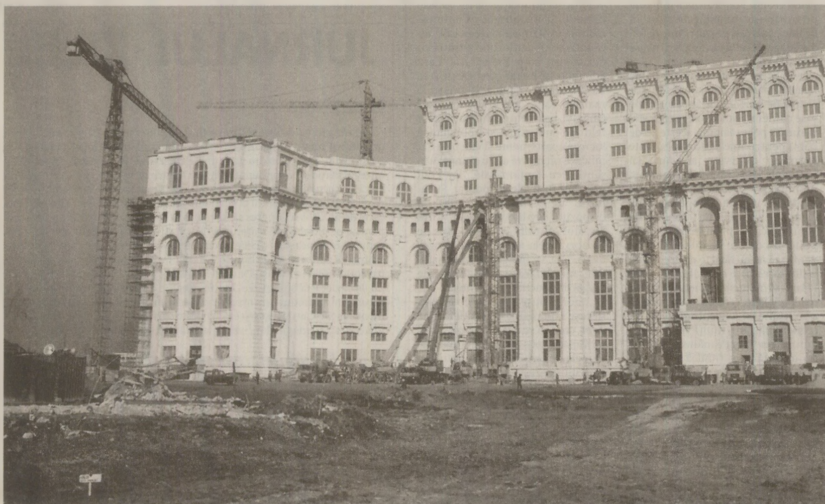
Peste 20 de mii de militari au trudit la înălțarea construcției vizibile din satelit, asemenea marelui Zid Chinezesc