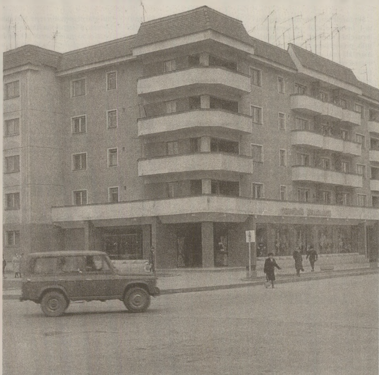
În speranța recepției posturilor tv sârbești și bulgărești, românii înălțau antene de până la 8 metri