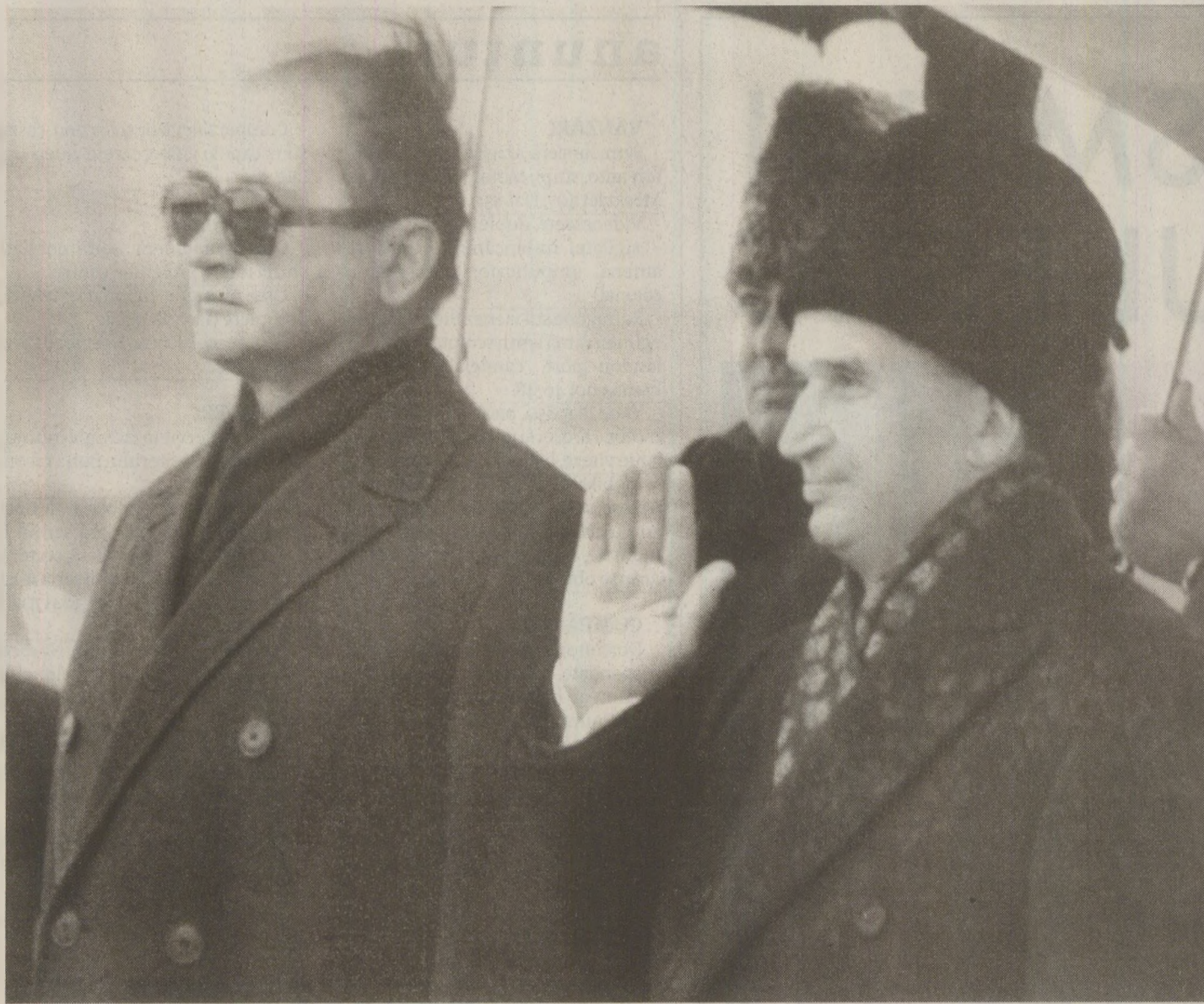
Jaruzelski nu înțelegea toleranța liderilor occidentali față de Ceaușescu