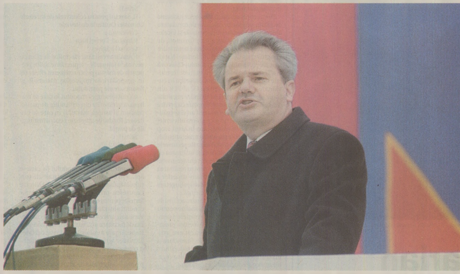
Liderul sârb Slobodan Milošević era un exponent al național-comunismului în anii '80

„Deși condamnă cu vigoare reforma, pare puțin probabil ca partidul albanez să opteze pentru un «comunism xenofob» sāngeros, în ciuda moștenirii lui Hoxha. Dimpotrivă, albanezii au căutat cu grijă și constant să fie deschiși atât față de Vest, cât și față de Est, iar Ramiz Alia e puțin probabil că va abandona acest curs. În Iugoslavia învecinată, pe de altă parte, liderul sârb naționalist, Slobodan Milošević, nu este, cu siguranță, în afara oricărei suspiciuni. În sfârșit, ipoteza ca în cadrul grupărilor naționalist-rusești din cadrul PCUS să fie exploatați în vreun fel turbulența naționalistă, dar și eșecul de a livra promisiunea perestroika economică, pentru a-i elimina pe Gorbaciov, nu trebuie prea ușor respinsă.”