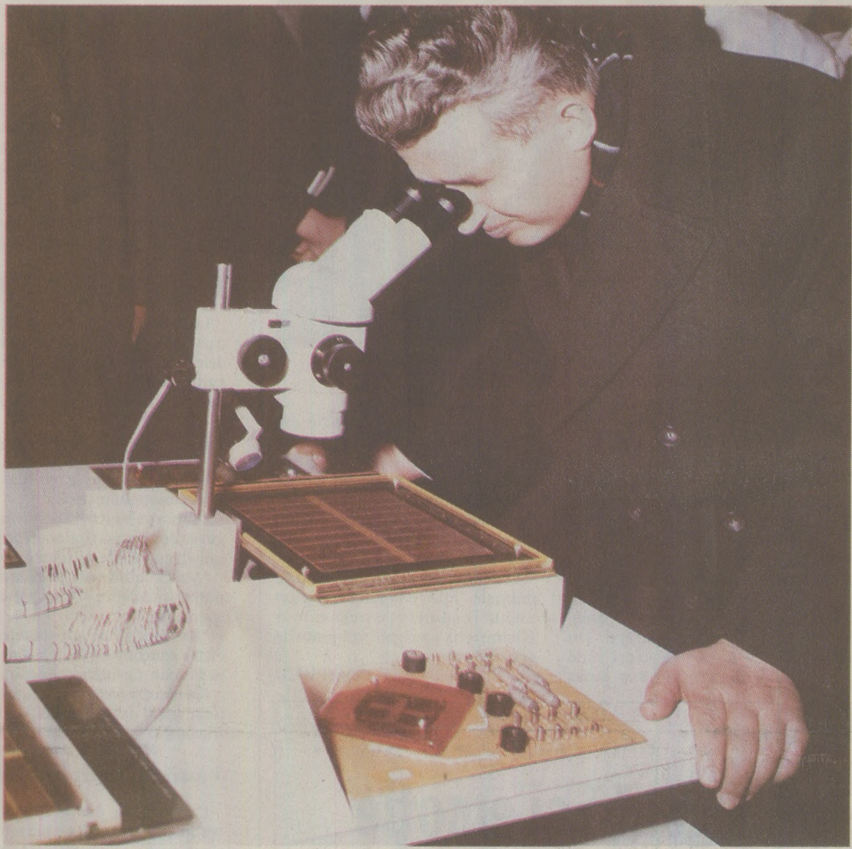
„Răspândirea științei în rândul maselor” era un slogan des întâlnit în documentele de Partid. Însuși Nicolae Ceaușescu se arăta interesat de ultimele inovații tehnologice, cu prilejul deselor vizite de lucru