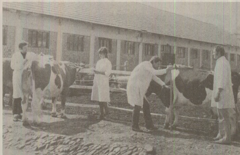
Tehnicienii agricoli din fermele de vaci aveau obligația să raporteze producția-record