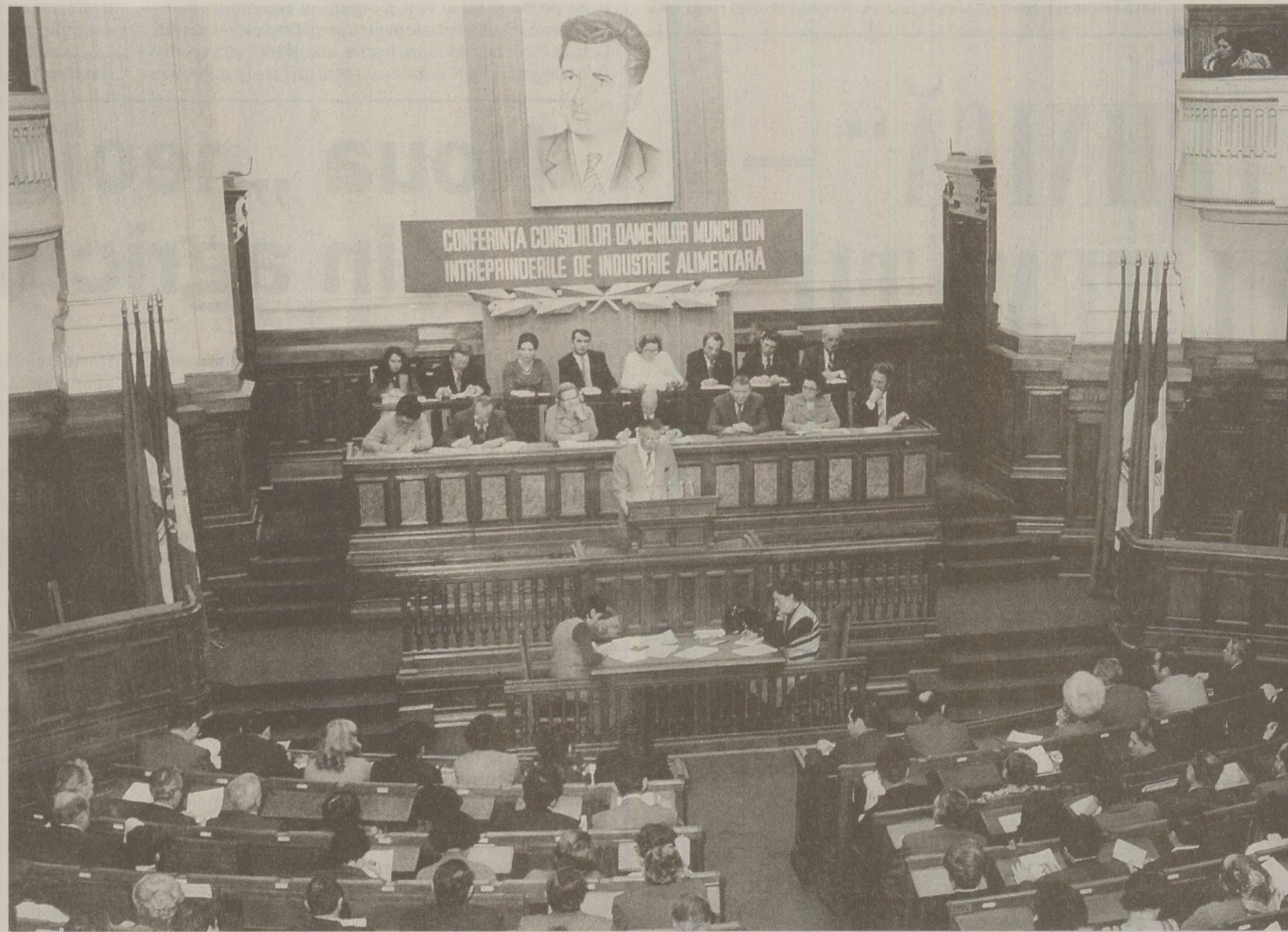
Prin consfățuirile de lucru și conferințe pe țară, regimul încuraja dezvoltarea agriculturii la ultimele standarde. Pe „teren” însă, cooperatorii lucrau la limita subzistenței

Locurile de muncă în industrie erau la mare căutare în epocă, pentru că în agricultură se câștigau din ce în ce mai puțini bani. „La satul am plecat din cauză că nu s-ajungeau banii, îmi dădea într-o lună 200-300 de lei! Nu puteam să fac nimic”, își amintește interlocutorul meu. Cu timpul oamenii au descoperit însă că banii erau o problemă secundară. Alimentația și produsele de primă necesitate nu se puteau cumpăra pentru că fie nu existau deloc pe piață, fie erau distribuite pe bază de cartele, cu rația. Astfel, ideea că în anii '80 se trăia mai bine la țară pentru că acolo exista mai multă mâncare este de fapt un mit. Oficial, agricultorii erau cei care „dădeau țării pâine”, dar în realitate până și acest aliment de bază se distribuia cu rația la țară. Bineînțeles că orașele și muncitorii aveau prioritate în această privință. Nicolae Drenea povestește că pe când lucra la șchele petroliere și era detașat în diverse comune din țară, oamenii „stăteau pe lângă gard, pe lângă mine, să le dau pâine. Eu puteam să iau, că eram 10 oameni într-o formație, și unii erau plecați