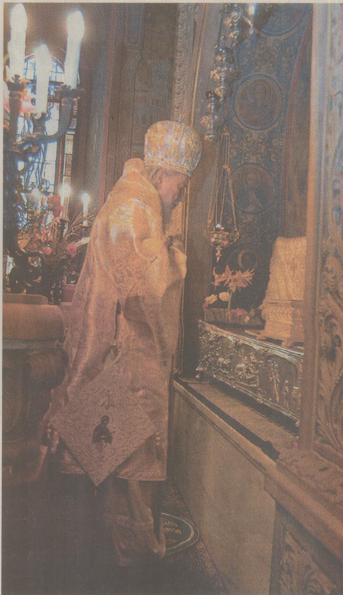
Oficial, regimul își avea bazele ideologice în marxism-leninismul ateu, însă în România au putut funcționa instituțiile bisericești