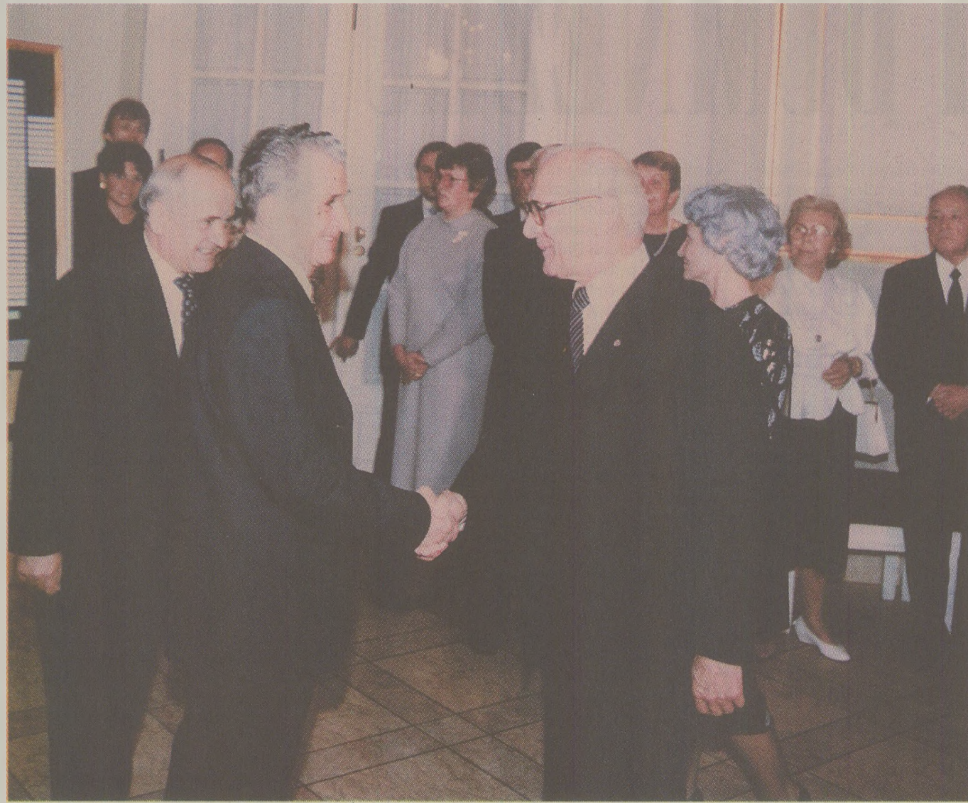
Nicolae Ceaușescu și Erich Honecker erau puși de ziaristi occidentali pe lista neagră a opozițanților la reformă, în spațiul comunist.

Din mai multe puncte de vedere, RDG a fost la fel de militantă ca și România în ceea ce privește respingerea fătășă a reformei. De exemplu, asemeni lui Ceaușescu, liderul partidului, Erich Honecker, insistă asupra faptului că „lupta de clasă... continuă să fie principala forță conducătoare a dezvoltării în lume”. Ca și românii, est-germanii au insistat în mod repetat asupra necesității de a respinge un model unic de construcție socialistă, „de oriunde ar veni el”. Totuși, est-germanii sunt pregătiți să admită că, între anumite limite, reformele pot avea succes în alte țări, dar nu și în a lor, lucru pe care Bucureștii nu l-au dispus să îl admită; și, spre deosebire de români, ei sprijină „noua gândire” a sovieticilor în chestiunea relațiilor externe (așa cum fac toți ceilalți antireformiști, cu excepția Albaniei).