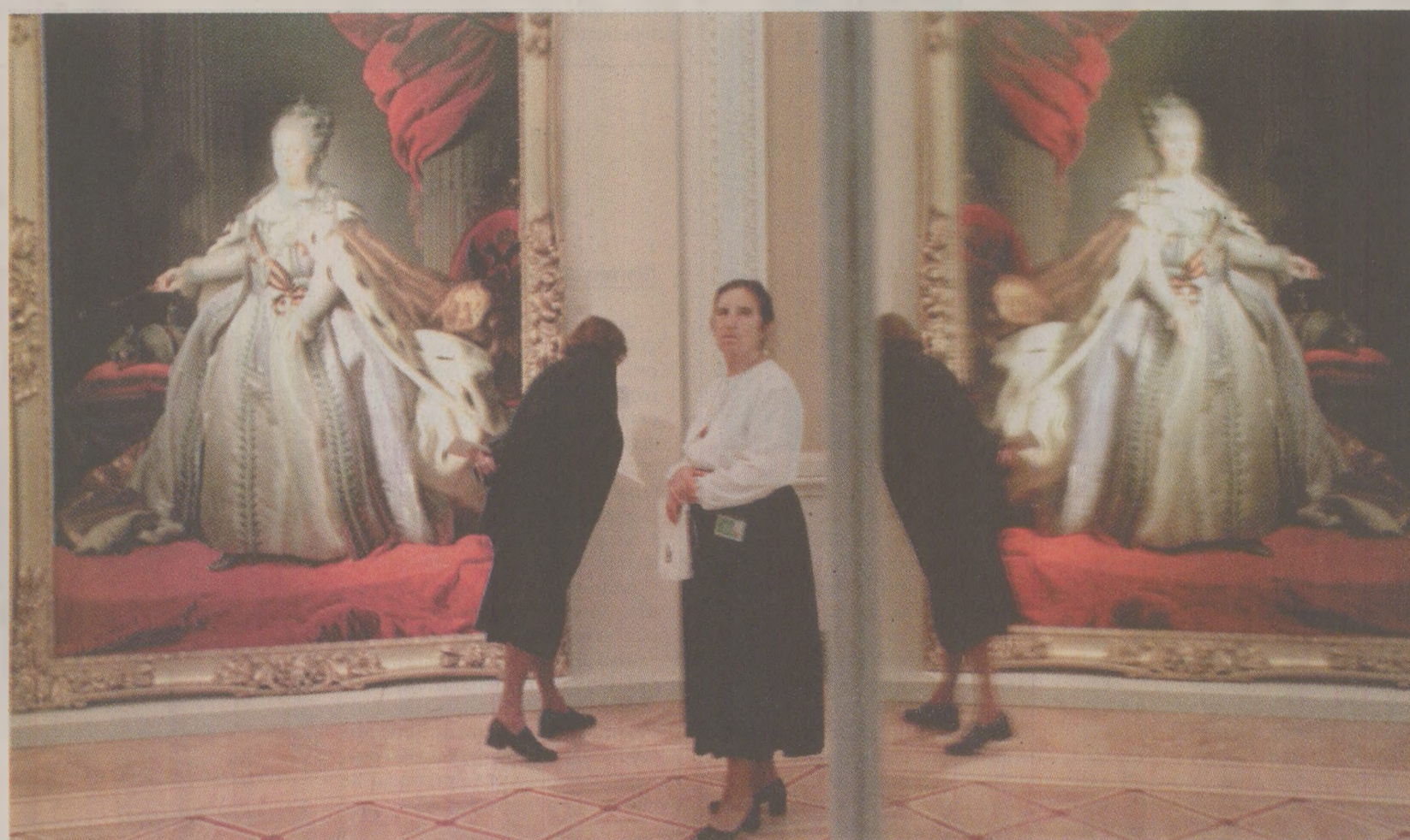
Ermitajul, o atracție pe care unii români și-o permiteau chiar și în 1989