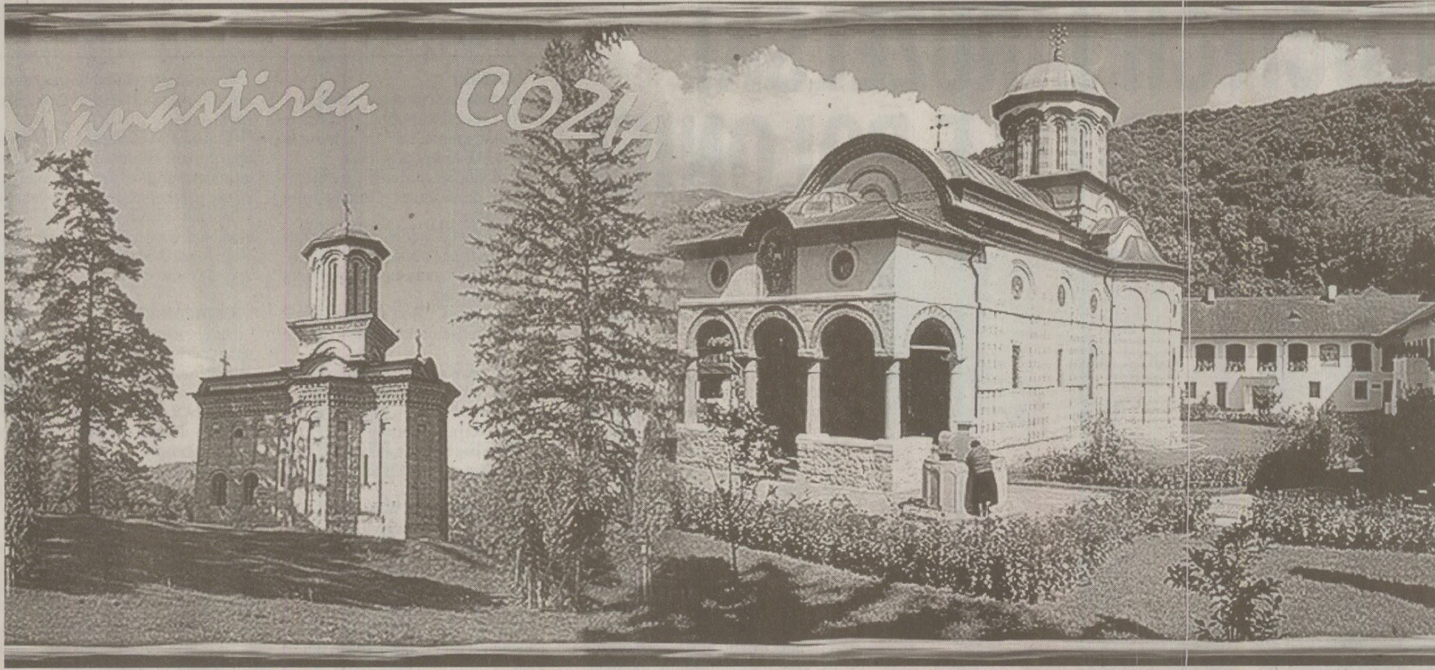
Și înainte de '89 îți puteai petrece concediul la Cozia sau la alte mănăstiri, acestea fiind trecute în lista obiectivelor turistice