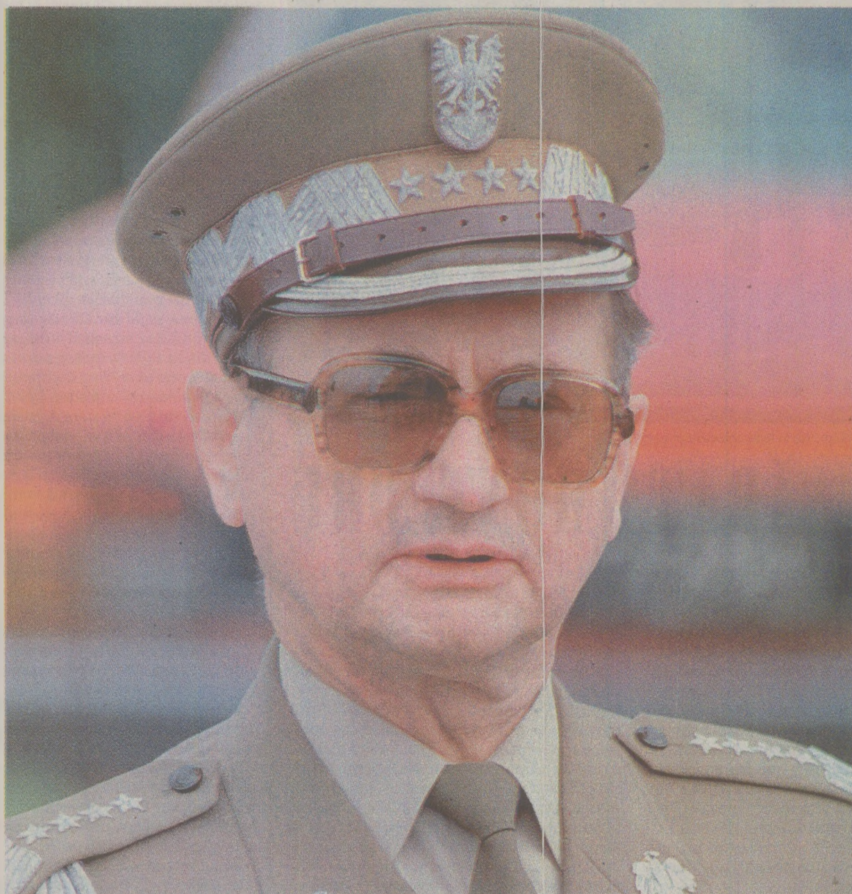
După victoria „Solidarității” la alegerile parlamentare, la 19 iulie 1989, Wojciech Jaruzelski s-a autonomit primul și singurul președinte al Poloniei comuniste.

Epilogul campaniei antisemite declanșate în vara anului 1967 a consumat în luna martie 1968, când a avut loc o mișcare studențească de protest. Represiunea ordonată de autoritățile de la Varșovia s-a soldat cu numeroase arestări din rândurile tinerilor demonstrați și cu condamnări la închisoare pe diferite termene. În același timp, aparatul de partid și principalele instituții ale statului polonez au suferit o nouă epurare. Persoanele considerate „revoluționare” sau „nesigure din punct de vedere politic” au fost îndepărtate de la conducere. Totodată, a fost schimbat din funcție ministrul Apărării Naționale, mareșalul Marian Spychalski. În locul acestuia a fost numit, la propunerea lui Władysław Gomułka și cu asentimentul Moscovei, generalul Wojciech Jaruzelski.