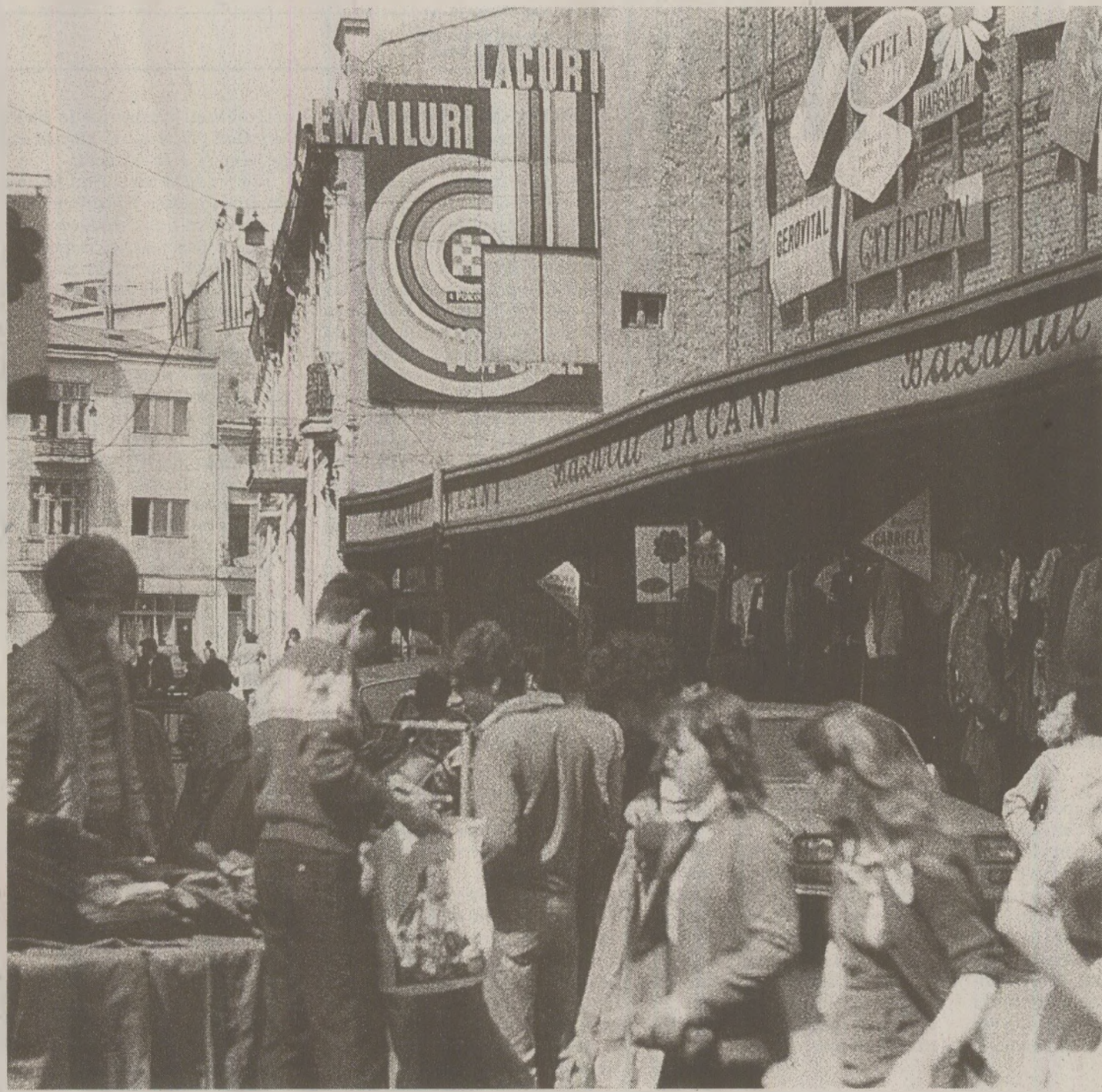
Statul la coadă ajunsese un „sport” național în 1989