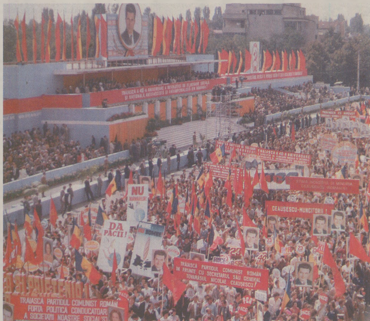
Presă internațională acuza „cultul personalității” dedicat liderului din Scornicești

În ianuarie, Ceaușescu a împlinit 71 de ani, el fiind liderul partidului din 1965. În ultimii ani, soția sa, Elena, a fost și ea descrisă în termeni elogioși, ea fiind prim-vicepremier ministru, ocupându-se de cercetare și