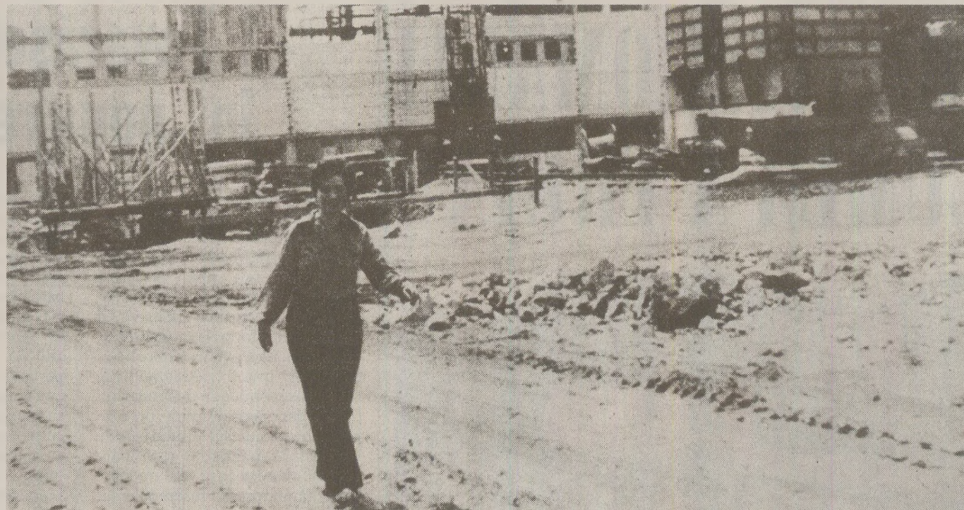
Pe șantier, în cooperativele agricole, în fabrici și uzine, bărbații și femeile munciau cot la cot

Această situație dădea naștere la probleme de care chiar conducerea CAP-urilor era conștientă. De fapt, brigăzile formate în majoritate din femei erau, în ciuda propagandei oficiale care sublinia egalitatea dintre sexe, un semn al deteriorării statutului acestora în societate. În plus, în afară de muncă, femeile mai trebuiau să aibă grijă și de copii. Aceasta însemna că în pauza de masă, la ora 12:00, trebuiau să se întoarcă acasă pentru a face mâncare celor mici. Uneori, în cadrul familiei aveau loc aranjamente complicate pentru ca să rămână cineva în permanentă acasă. „Am lucrat la CAP, la mută țevile de irigații! Dar zilele pe care le-am lucrat le-am trecut pe numele soacrei mele, că și ea avea noroc, iar eu aveam și copii mici, eu nu se ducea la irigații, că nu putea și eu mă duceam. Plecam numai dimineața și seara, când se mutau țevile și în timpul asta ea rămânea de avea grijă de copii. Apoi, când mă întorceam eu, se ducea ea la treabă, că erau alte munci, la sfecică, la porumb”, povestește interlocutoarea mea. Din