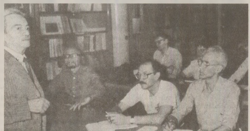
La „Ștefan Gheorghiu” școlirea gazetărilor se făcea din manuale moderne, de specialitate

Fragment din „Tehnica scrisului”, Caiet Documentar editat de Catedra de teorie și practica presei a Academiei de Studii Social-Politice, p. 87-91