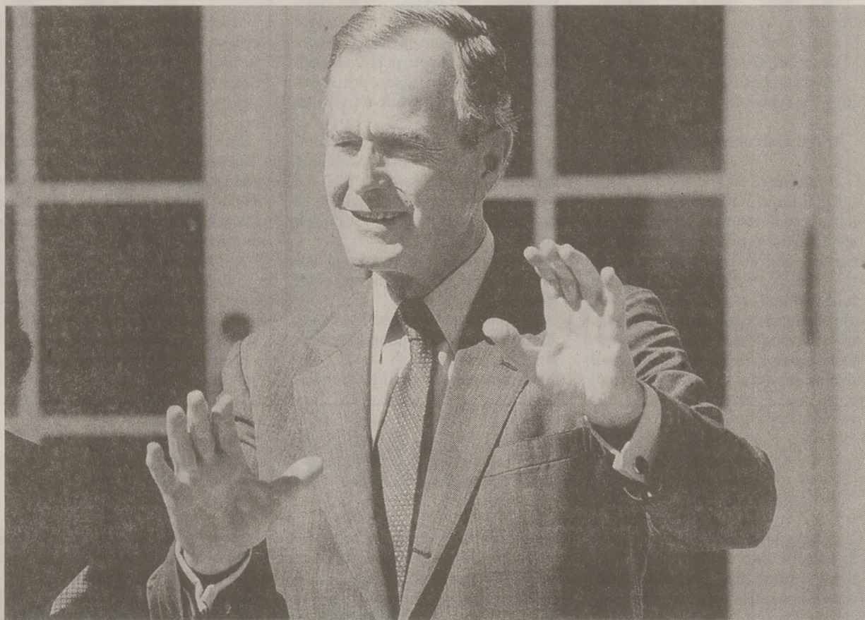
Nicolae Ceaușescu a comutat pedeapsa cu moartea la intervenția lui George Bush