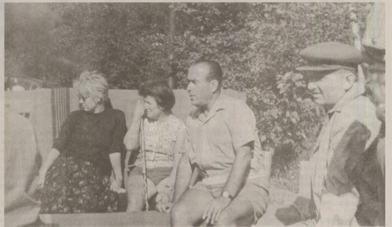
Prietenia cuplului Ceaușescu cu familia Drăghici (Marta și Alexandru, în centrul fotografiei) i-a facilitat „Celui mai iubit fiu al poporului” promovarea în fruntea PCR

În 1968, Ceaușescu „s-a scăpat” de bunul complice și amic Alexandru Drăghici, învinuindu-l de crimele în lupta pentru putere dusă de Dej. Mai înainte cu câteva zile, Ienuta Ceaușescu se certase, în public, cu cea mai bună prietenă, fosta ilegalistă Marta Drăghici (Csiko). Nevestele, fără