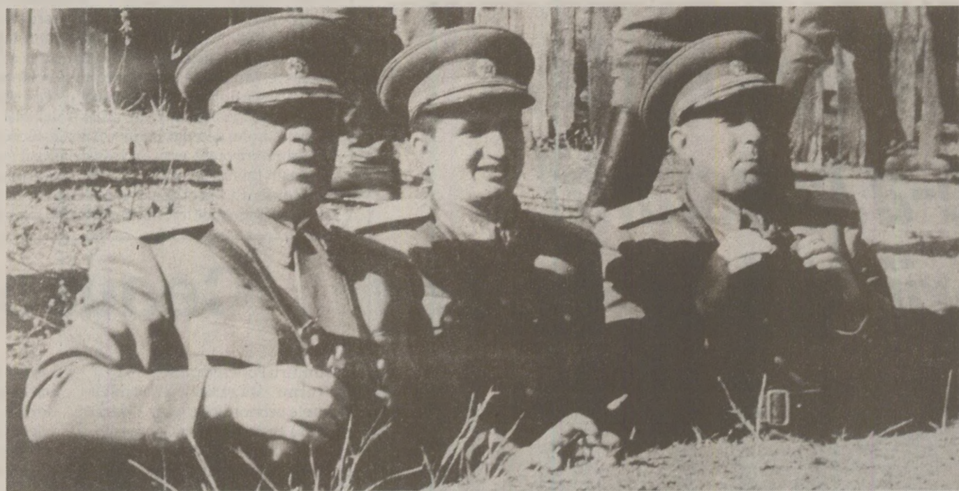
Emil Bodnăraș și Leontin Sălăjan au fost printre „grelii” Partidului care l-au susținut pe Ceaușescu în funcția de secretar general.

Tovul Ceaușescu venind într-un timp de la Constanța pentru 3 zile, a găsit la mine (Eufrosina Iordache) 2 delegații ale tov. Barcari