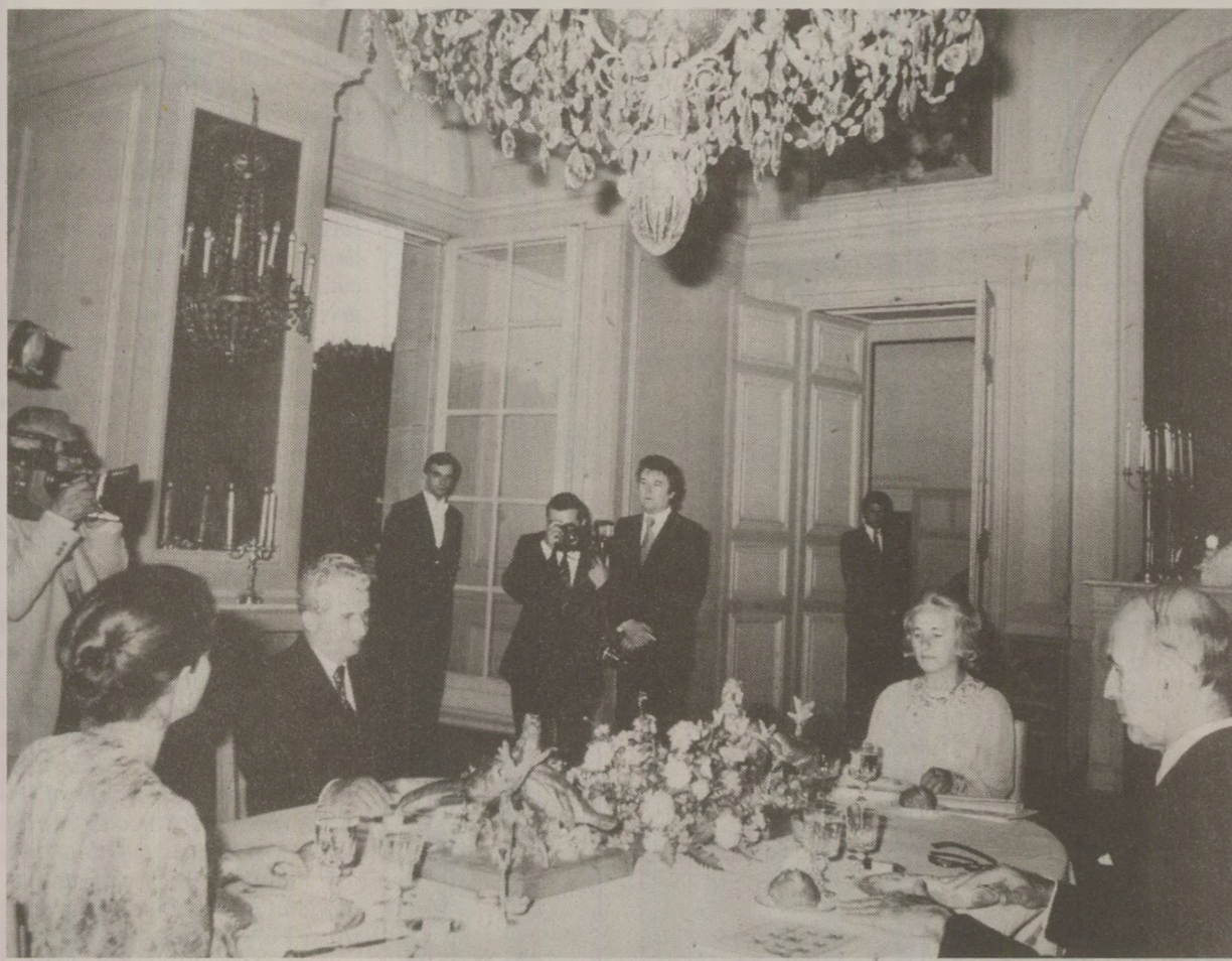
După nouă ani, presa din Hexagon îi reproșa fostului președinte Valery Giscard d'Estaing că în 1980 îi primise cu cele mai mari onoruri pe Nicolae și Elena Ceaușescu

Problema cu Ceaușescu e că acțiunile sale de stăpân absolut, absurd și utopic vor sfârși prin a-l exoneră de ororă pe care o implică. Faptul că presa îl numește, în mod obișnuit, „Danubiul al gândirii” sau „geniul din Carpați” stărnește mai degrabă râsul decât indignarea. Ne amintește, mai degrabă, de Căluțul din Bethune decât de Stalin. La fel, faptul că mută satul la oraș amintește mai degrabă de Alphonse Allais și mai puțin de Pol Pot. Apoi, pentru a-i irita pe ruși, de care el s-a delimitat, occidentalii l-au tratat cu o anumită complăzență, asta când nu au preferat să închidă ochii, ceea ce ne conferă o anumită responsabilitate în privința acestei interminabile tiranii. Nu sunt departe acele vremuri, când, din cauza unui așa-zis spirit de independență care îi caracteriza și pe unii, și pe ceilalți, Ceaușescu era privit ca un fel de De Gaulle al taberei sovietice. Mai mult, în 1980, Domnul Valery Giscard d'Estaing îl primea, cu solemnitate, la Paris.