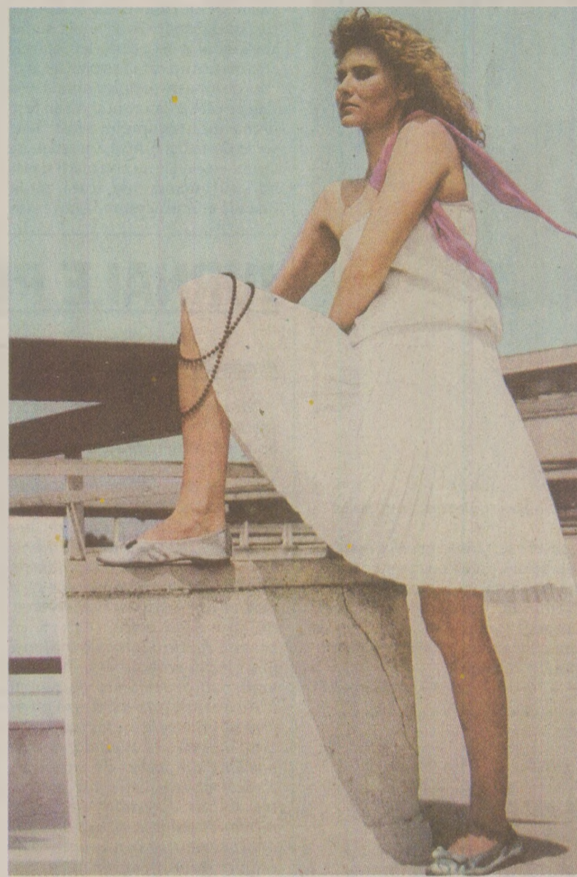
Decolteul amplu era în mare vogă și pe litoralul românesc

Elementul principal în domeniul modei anului 1989 a fost... femininitatea. Cel puțin asta recomandă revista Femeia, sfetnicul acelei părți din categoria oamenilor muncii care, pe lângă ipostazele de „producător, proprietar și beneficiar”, avea ca obligații, în calitate de „tovarășă de viață”, mamă și gospodină.