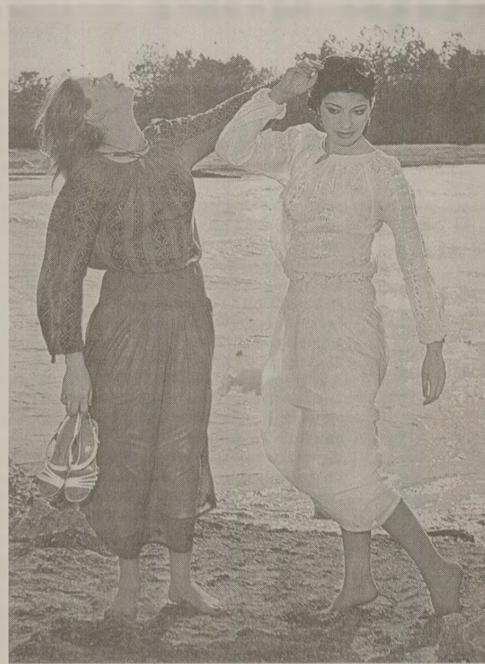
Au fost redescoperite atât materialele pretioase, cât și cele naturale, înnobite cu broderii bogate, tradiționale