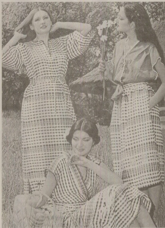
Pe lângă fustele „mini”, care a făcut furor în '89, de efect erau și rochiile lungi până la glezne