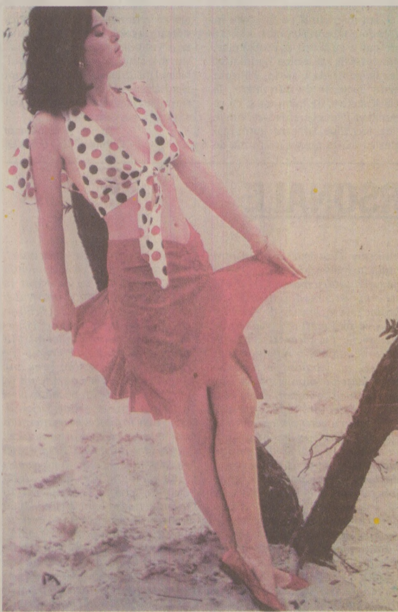
Accesorii, panglici, funde, înviuarea culorilor mai discrete