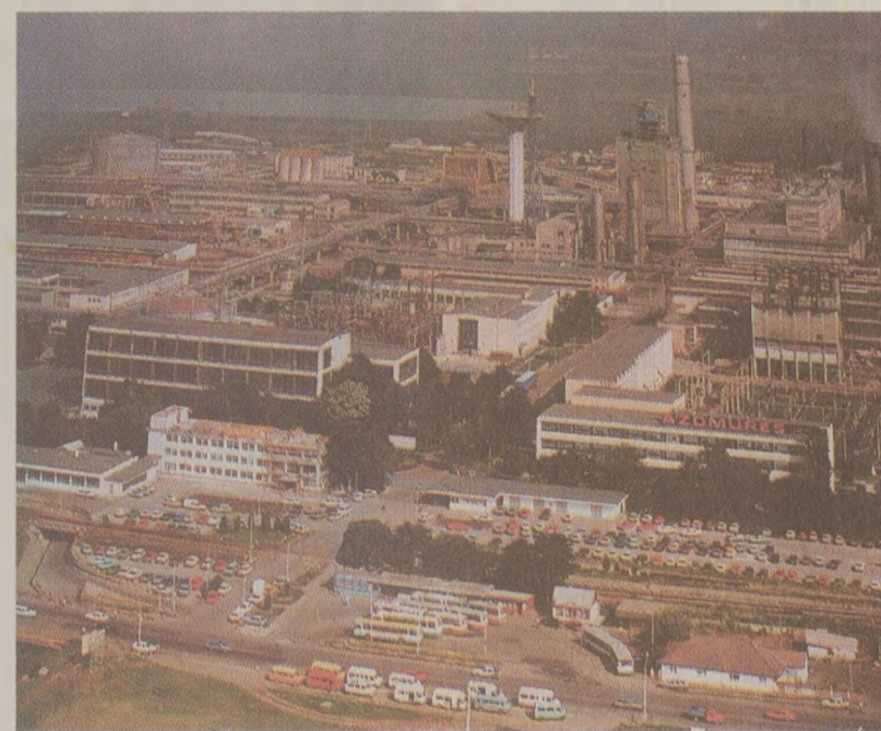
Azomureș, mândria „unităților” chimice românești