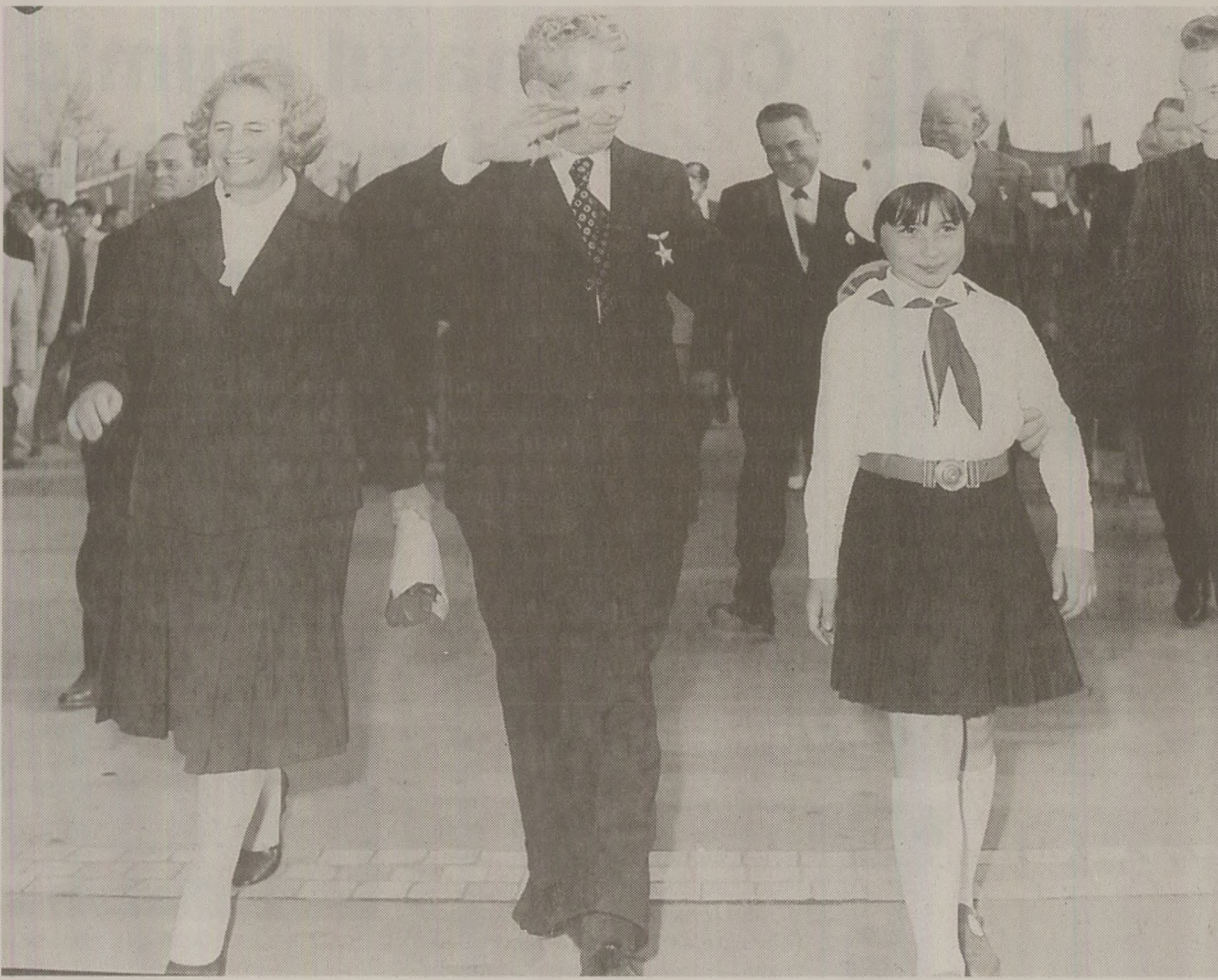
Combinatul chimic Azomureș era un obiectiv obligatoriu în timpul vizitelor de lucru ale cuplului Ceaușescu, efectuate în Tg. Mureș

Oprișcan își amintește și de cele două vizite ale cuplului Ceaușescu la Azomureș. Ea, prima chimistă a țării, el, mândru de exportul de melamină proaspăt lansat. Melamina avea un preț bun la export, iar unele sortimente depășeau 40 de lei pe dolar. „Aveam emoții foarte mari, la prima vizită eram proaspăt șef de instalație. Noi am vrut să oprim instalația pentru că era periculoasă, el a vrut să vadă