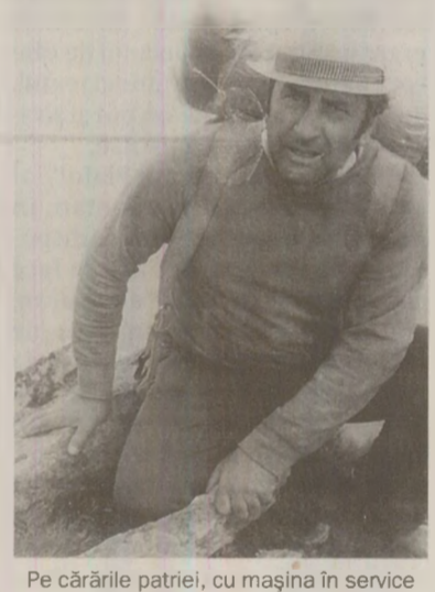
Pe cărările patriei, cu mașina în service