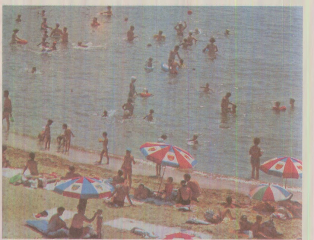
Litoralul românesc - oaza din visurile zilelor-muncă