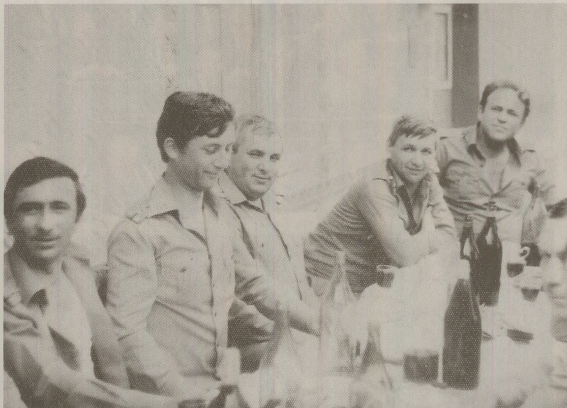
Petrecere în „familia” mare a corpului ofiteresc