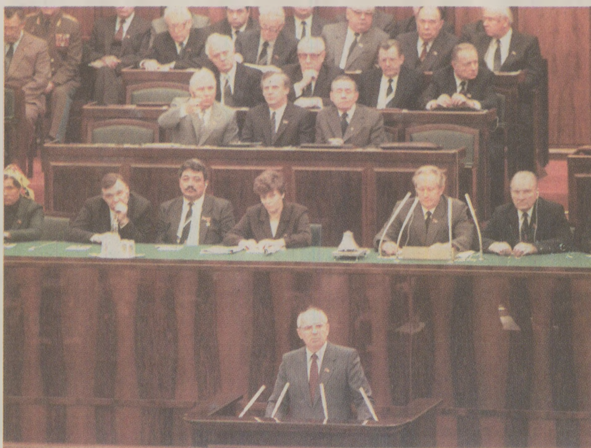
Aleșii sovietici cuvântă în „limba de lemn” în variantă perestroikistă