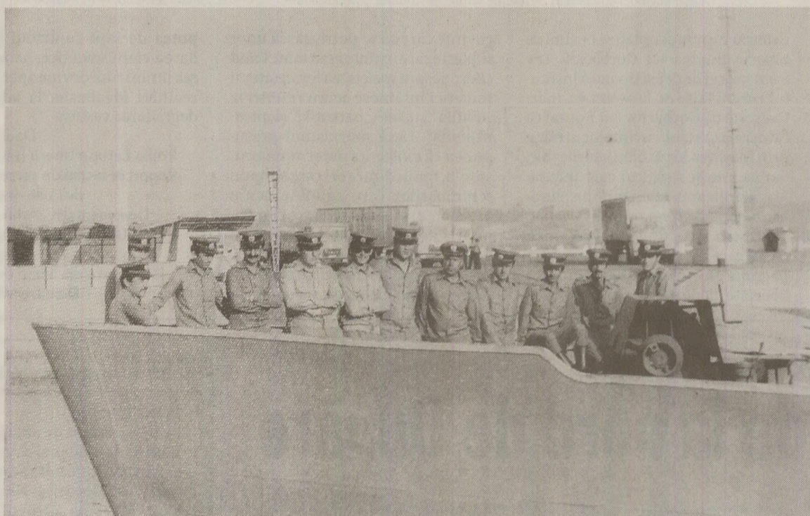
„Servim patria!” cu o aplicație reușită