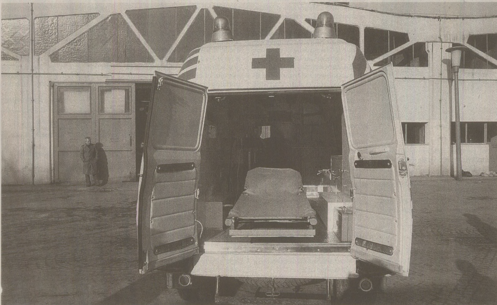
Din cauza lipsei de echipament medical și a cotelor mici de benzină, ambulanțele făceau față cu greu solicitărilor bolnavilor

Serviciul de Salvare, ultima speranță a bolnavilor atinși de maladii complicate, ori victime ale unor accidente grave. Un serviciu care, pentru a fi eficient, trebuie să se miște cât mai rapid posibil. Cu toate acestea, în 1989, Ambulanța intrase deja în moarte clinică.