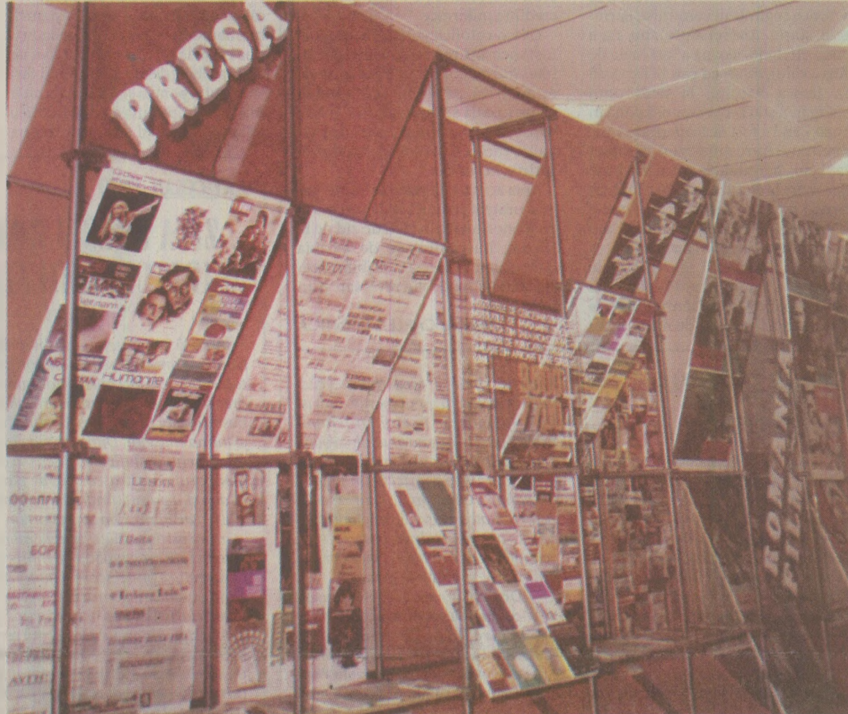
De Ziua presei, gazetarii au fost convocați în Sala de marmură a Casei Scînteii, unde s-a dat citire „Mesajului” lui Nicolae Ceaușescu

Nu mai că, în anul 1989, „Ziua Presei Române” se sărbătorea într-un context cu totul aparte. Aparte prin tristețe și prin dezamăgire. În primul rând, era vorba despre dezamăgirea care punea tot mai mult stăpânire și peste majoritatea gazetărilor, pe care, la fel ca tot românul, o resimțeam văzând cum și ultimele speranțe de mai bine, promise de Nicolae Ceaușescu pentru vremile ce vor veni