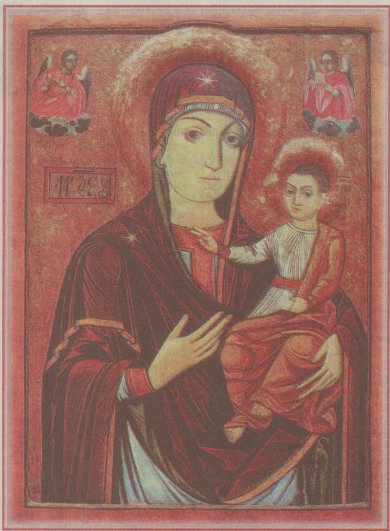
Icoana Maicii Domnului a făcut minuni în toate vremurile, neținând cont de regim