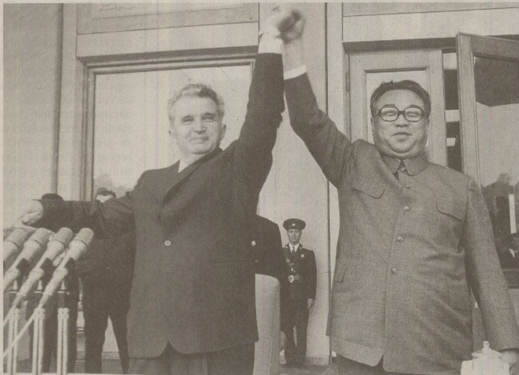
Ziaristii de la Europa Liberă îl considerau pe liderul nord-coreean Kim Il Song singurul prieten al lui Nicolae Ceaușescu, în 1989.