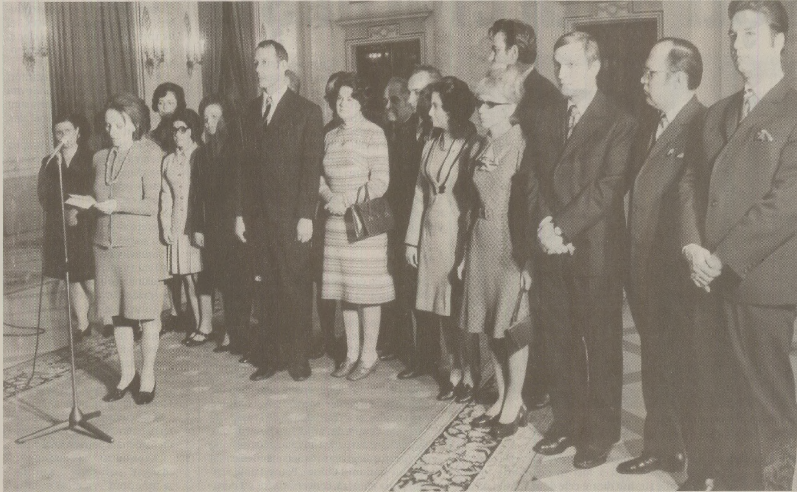
Trecuseră vremurile când ziaristi erau convocați la Comitetul Central pentru a fi decorați. În 1989, de la aceștia se cereau, în general, articole despre zarzavagi care furau la cântar sau materiale scrise la comandă.

Există în acel timp o secție de presă a partidului. Toată presa era centralizată. Iar toate sărbătorile, serbările și aniversările intrau într-un fel de plan anual. „În momentul în care venea rândul Zilei presei – povestește Tudor Octavian – de la Secția de presă se spunea așa: «Măi, vedeți să dați voi un articol cu Ziua presei», și cineva din redacție era desemnat să-l scrie. Articolul conținea două elemente-cheie: un citat din Ceaușescu despre presă – obligatoriu – iar al doilea era că luai articolul de anul trecut și-l copieai. Se spuneau exact aceleași prostii vizavi de democrația liber consfințită.” Articolul despre Ziua presei se publica obligatoriu în toate ziarele și revistele care apăreau la data respectivă (sau aproape de data cu pricina). Așa se face faptul că acel articol care se publica în „Scinteia” apărea la îndigo în toate celelalte publicații. „Totuși, de la an la an aveau niște elemente. Spre exemplu, se spunea că a sport libertatea. Iar Ceaușescu că, începând de azi, nu mai avem cenzură – prin urmare, se făcea mare caz pe această temă, și anume, că i fost desființată cenzura. Dar ce înseamnă asta? Toate articolele erau trimise la Secția de presă spre verificare, unde, dacă existau probleme, nu ți le tăia nimeni, însă ți se cerea să le tai tu. Dar cenzura exista. Toate articolele, inclusiv cărțile, mergeau la citire undeva. Cu toate trebuiau