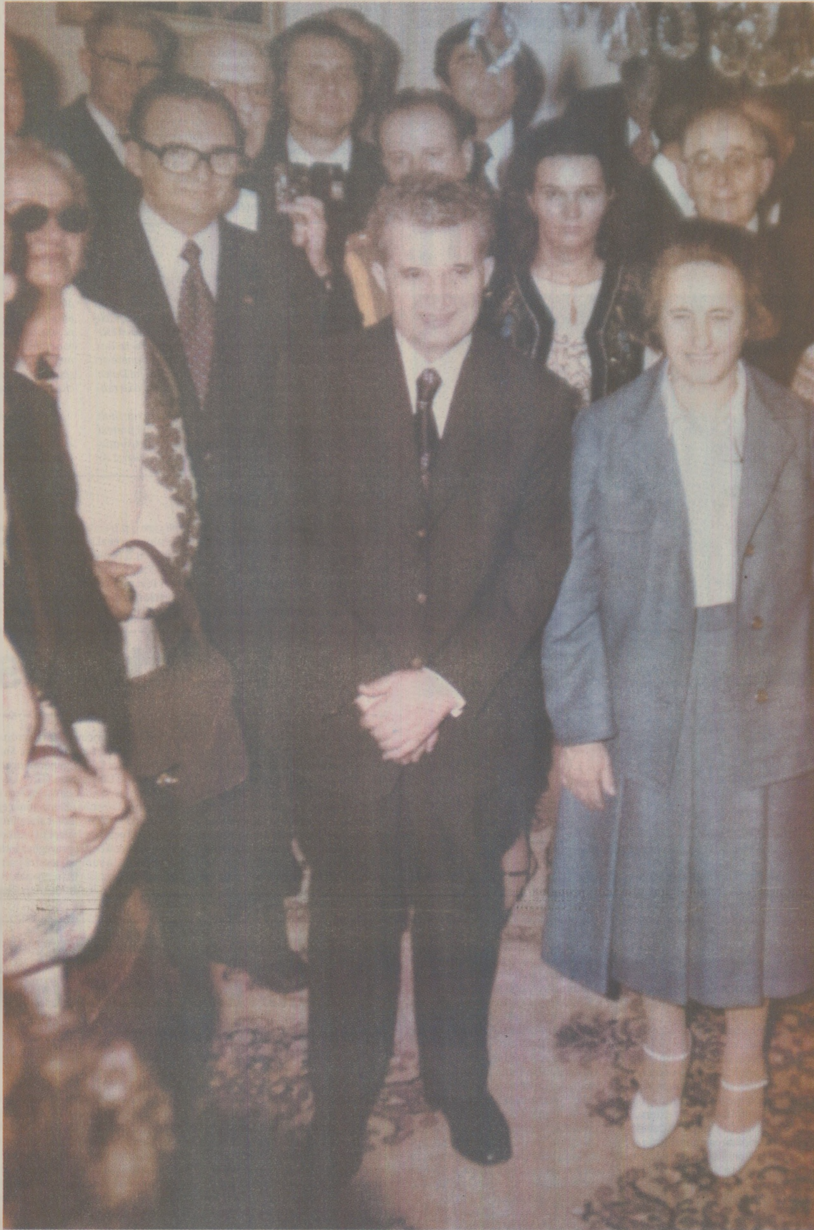
Ioan-Mihal Pacepa (în stânga lui Nicolae Ceaușescu) a făcut mai multe servicii regimului după fuga în Statele Unite. În memoriile sale, citește la Europa Liberă, susținea că Securitatea controla total viațile românilor, băgând spaima în oameni

– Pot numai să vă raportez, tovarășe comandant suprem și stimată tovarășă Elena, a replicat Diaconescu, că, dacă propunerile noastre vor fi aprobate azi, atunci, începând cu 1 ianuarie 1984, vom fi în stare să