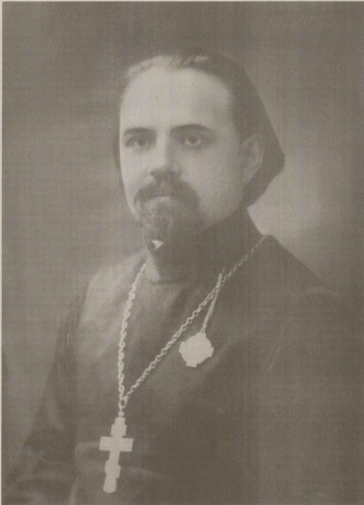
Autorul poeziei „Limba noastră”, Alexe Mateevici, a fost ales de patrioții moldoveni simbol al luptei pentru drepturile naționale ale românilor din Uniunea Sovietică

Clubul Mateevici a fost înființat de 15 tineri intelectuali moldoveni, la Chișinău, în 1988, de Paște.