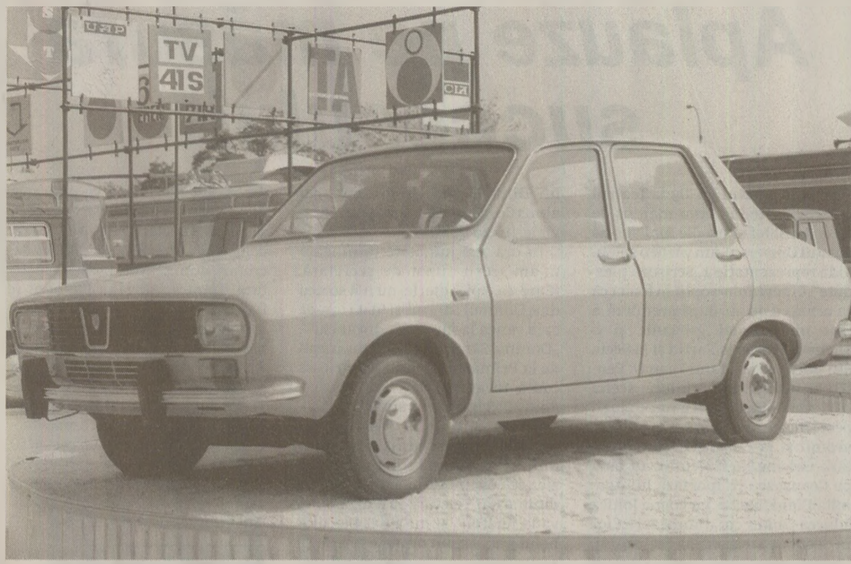
Pentru a intra în posesia mult râvnitei Dacii se plăteau băni serioși și se aștepta ani întregi