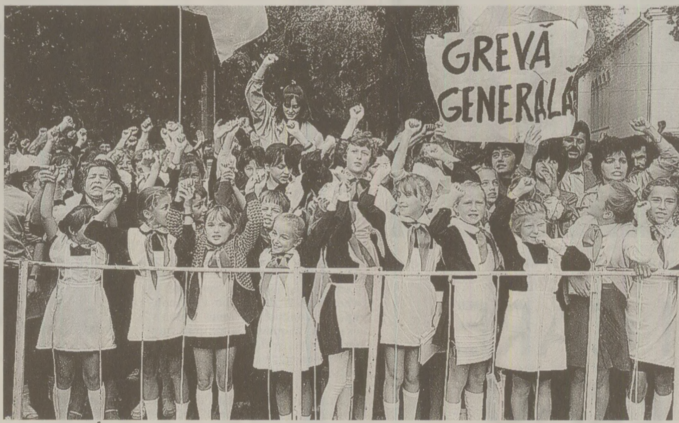
Luptătorii mici și mari pentru cauza limbii moldovenești au primit replică din partea rusofonilor

„Delegația de la Tiraspol și secretarul Partidului Comunist, Semion Grossu, au părăsit sala timp de o jumătate de oră, pentru a nu lua parte la vot, nedorind să voteze prevederea din lege prin care limba moldovenească era declarată limbă oficială”, a adăugat ea. „Până la urmă s-au întors în sală și au votat împotriva, însă articolul a fost trecut cu votul majorității”. Un purtător de cuvânt pentru comitetul greviștilor de la Tiraspol a declarat că cei 80.000 de muncitori care nu au lucrat săptămâna aceasta, din cauza noii legi, refuză să urmeze apelul comitetului de a se întoarce la posturi.