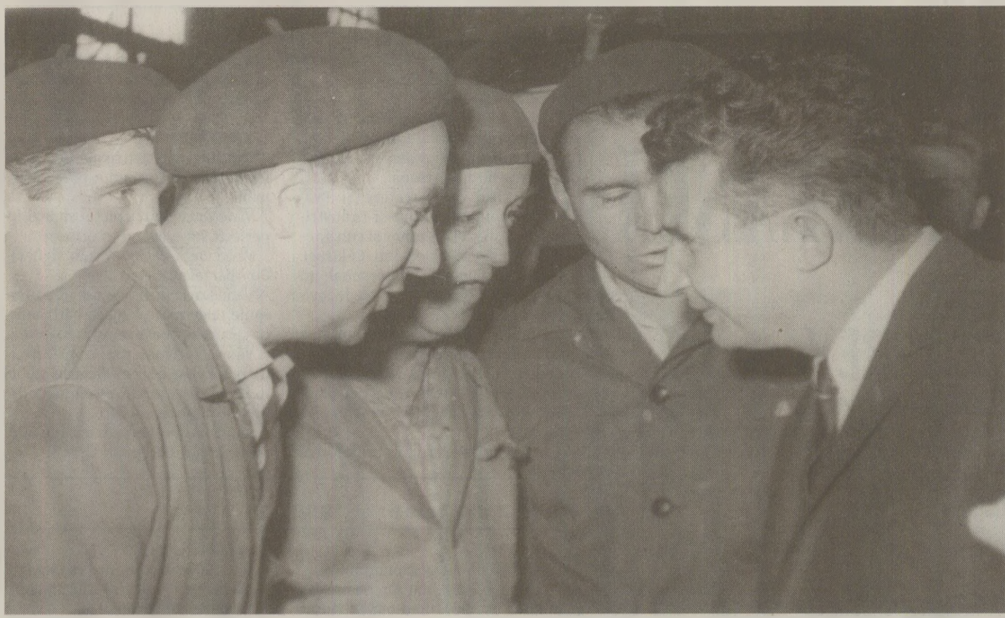
Din scrisori trimise la Comitetul Central, Ceaușescu afla de nemulțumirile muncitorilor, dar acestea nu erau discutate în ședințele CPEX