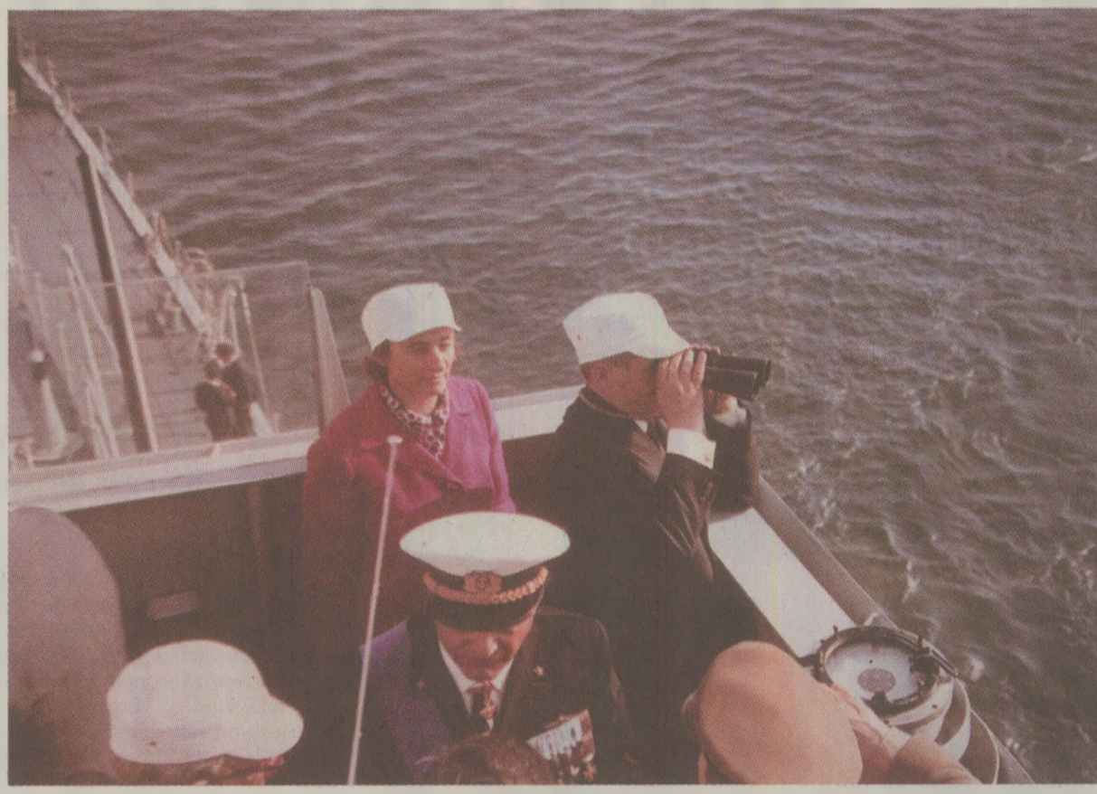
Aidoma omologilor din alte state, printre dotările de agrement ale cuplului prezidențial se număra și un iaht

În decembrie '89 era și iahtul acela parte a „averii lui Ceaușescu”. Sub steagul cui a mai navigat? (L.B.)