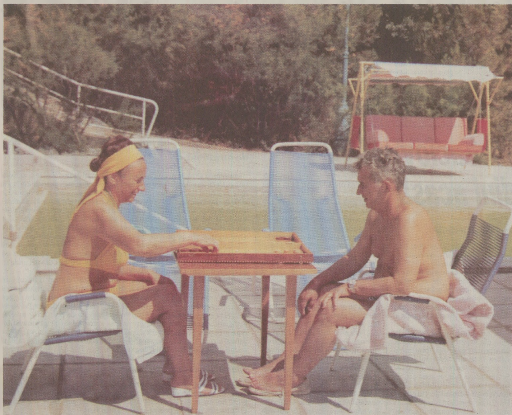
După obiceiurile stabilite în lumea comunistă, Ceaușeștii petrecuseră multe concedii în Uniunea Sovietică

Putini știau când și unde își petrec concediile liderii comunisti. După cutumele statornicite între Kremlin și celelalte partide comuniste, conducătorii lor erau invitați în vile de odihnă ale nomenclaturii din URSS. În 1989 însă, Ceaușescu a refuzat invitația lui Gorbaciov. Soții Ceaușescu și-au petrecut ultima vară la Neptun și Snagov. Practicând odihna activă în combinația septici și ședință.