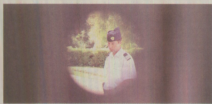
Reședința lui Ceaușescu de la Neptun și tot... reședință prezidențială!

Stațiunea Neptun s-a dat în folosință în 1964. În absența unui ghid al litoralului care să ofere și alte date decât hărți și oferte turistice actuale, menționăm că „epocii Dej” îi aparține programul de amenajare a țărmului românesc al Mării Negre ca „bază de odihnă și tratament pentru oamenii muncii”. Conform statisticilor oficiale, litoralul modernizat a găzduit în 1964 și 180.000 de turiști străini (din care 10.000 de scandinavi și 30.000