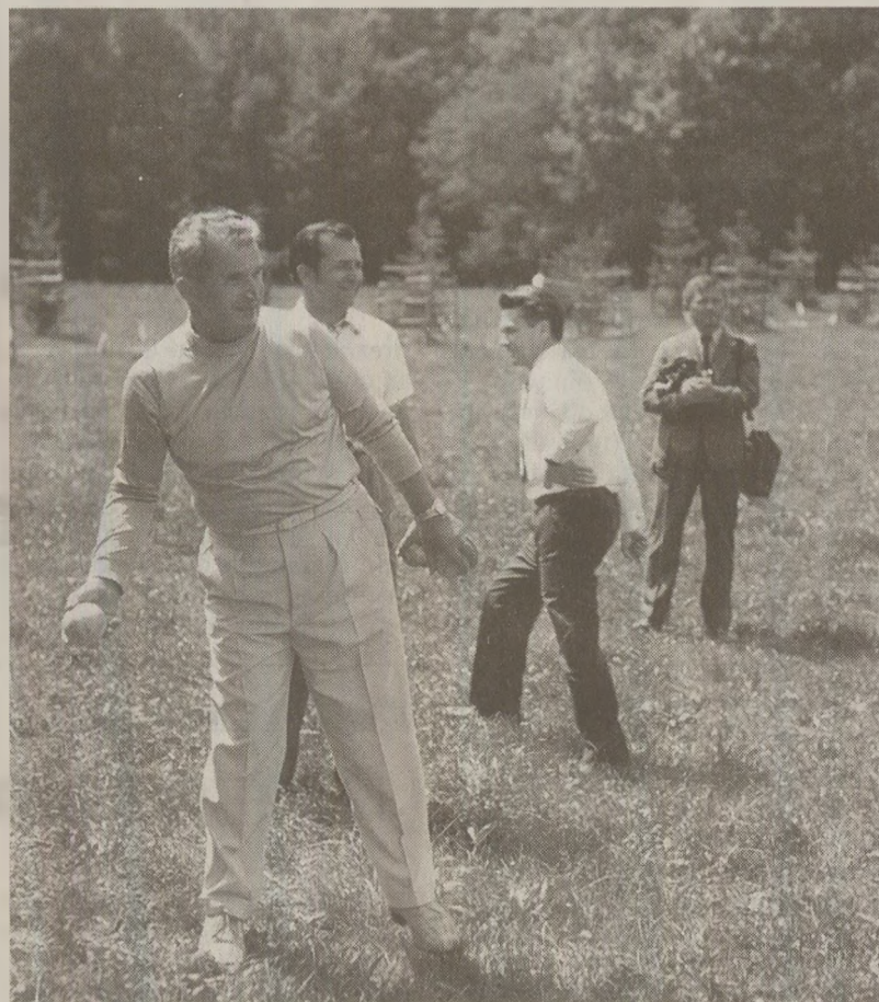
Trecuse vremea distracțiilor de tinerțe și a frumosașelor prietenii

„Craii de Curtea nouă” – i-a persiflat și s-a autoironizat Dumitru Popescu în memoriile sale (Am fost și cioplitor de himere, Editura Expres, București, 1993). „O curte foarte restrânsă, sărăcăcioasă, cu forme de manifestare destul de precare”, a consemnat fostul membru al CC al PCR de la venirea la putere și până la moartea lui Ceaușescu. Favoriții primilor ani erau invitați, împreună cu soțiile, să-și petreacă și sfârșitul de săptămână la Snagov. Destinderea începea printr-o partidă de volei și continua cu masa comună. Ceaușescu făcea sport: „juca întodeauna la plasă, cu o mână trăgea plasa în jos și cu alta arunca mingea în terenul advers”. Observau toți fair-play-ul Șefului dar niciunul nu protesta. Jucând, specula greșelile celorlalți, comentându-le jocul („ii bodogănea pe toți”). Voleiul „nu mai era distracție, ci instrucție” pentru jucători. Ceaușescu în schimb, „se amuza stresându-i pe ceilalți”.