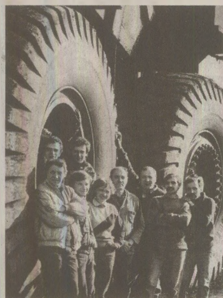
Românii plecați în URSS nu făceau numai schimburi de experiență. Uneori se și căsătoreau cu frumoasele rusoaice