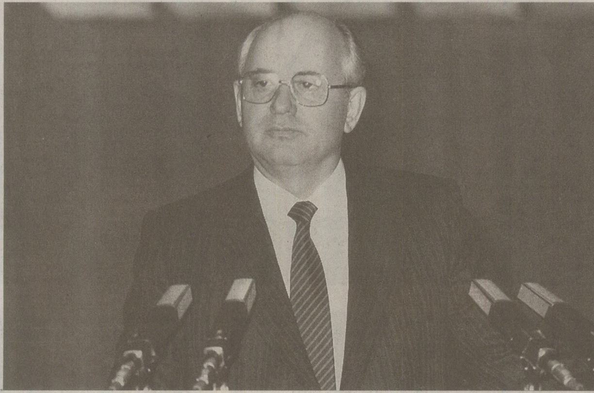
La întoarcerea din vacanță, liderul de la Moscova, Mihail Gorbaciov, trebuia să țină piept pretențiilor autonomiste ale mișcărilor naționale din Uniunea Sovietică

„Reîntoarcerea lui Mihail Gorbaciov la lucru, zilele următoare, după cinci săptămâni de vacanță, se anunță dificilă. Agitația naționalistă din toate colțurile URSS-ului și riscul de noi conflicte sociale au luat o amploare atât de mare, încât dificultățile economice trec practic pe planul doi. A fost o vară fierbinte în republici, cu mobilizarea fără precedent a peste un milion de oameni în țările baltice cu ocazia sărbătoririi a 50 de ani de la pactul germano-sovietic care a permis în 1940 anexarea lor de URSS și confruntările dintre rusofoni și moldoveni, la care se adăugă tensiunile din Caucaz. «Este uimitor că în această situație principalii conducători își permit să dispară de pe scena publică timp de peste o lună», subliniază un diplomat occidental. Pe frontul penuriei generale nu se înregistrează nici un progres. În august, a fost anunțată decizia de a aprova salarii prioritari, prin intermediul întreprinderilor la care lucrează. Pe această temă s-a ținut joi o ședință a Comitetului Central, sub conducerea lui Viktor Nikonov, s-au reclamat «lentărea și lipsa de dinamism» pentru punerea în practică a acestei decizii. Dintr-un coș zilnic de 1.200 de produse, doar 200 sunt disponibile în cantități suficiente, anunța TASS recent. Pe termen scurt, mai gravă este paralizia care a