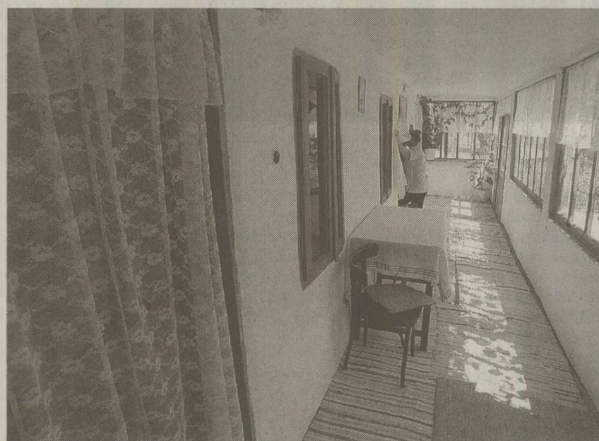
Celebritățile ajunse în vacanță la 2 Mai aveau aceleași condiții de trai ca și localnicii: mâncau la fel, se spălau la butoi, dormeau în camerele folosite peste an de săteni