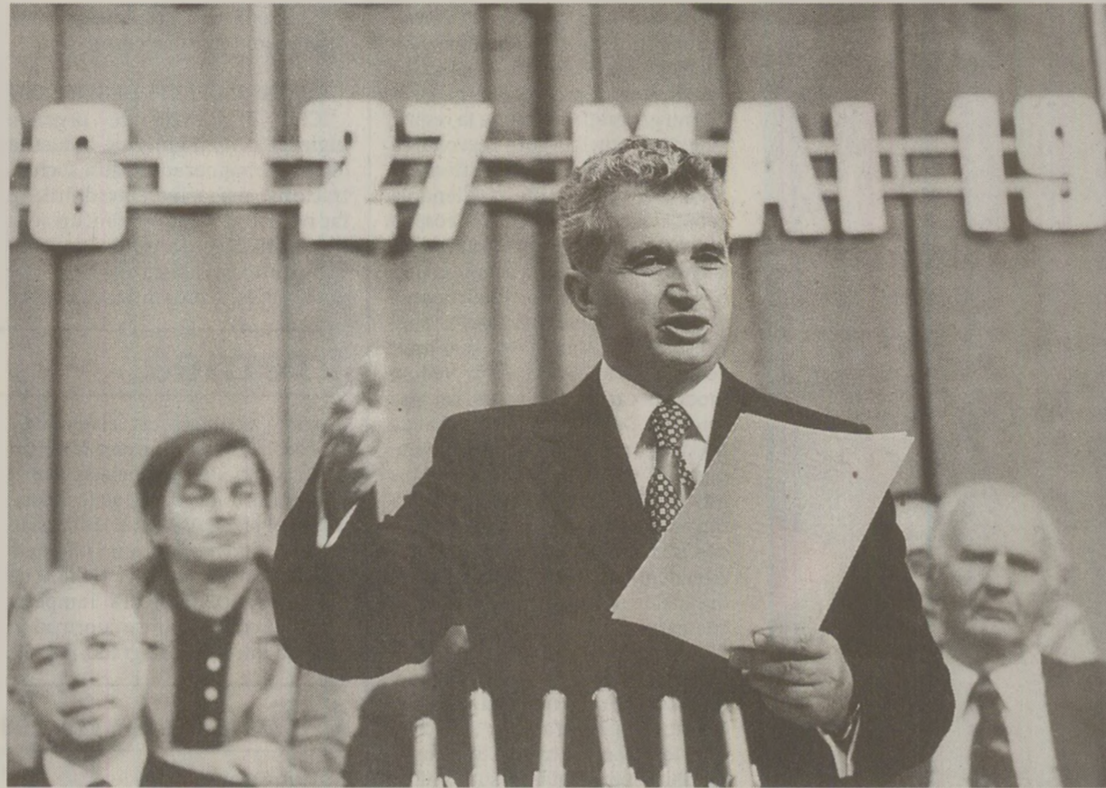
Conferința scriitorilor din 1977 a fost ultima la care Ceaușescu a venit la deschiderea lucrărilor

Chiar dacă nu atingeau cotele gigantice la care ajungeau în Uniunea Sovietică, veniturile scriitorilor oficiali din România erau totuși sfidătoare în raport cu precaritatea generală a populației. Celor care scriau „realist socialist” și erau agreati de regim li se asigurau condiții și privilegii exorbitante, de la enorme drepturi de autor și locuințe de la stat în cartierele de lux până la premii, titluri și locuri în Academie. La începutul anului 1949, cu trei luni înainte de înființarea Uniunii Scriitorilor, o „planșă” a CC al PMR adoptase o „hotărâre” despre „stimularea activității științifice, literare și artistice” prin care, între altele, era creat „Fondul literar al scriitorilor din RPR”. Hotărârea fusese adoptată pe baza unui raport înțeles de Ana Pauker. Generalizată financiară a regimului avea, ca și în Uniunea Sovietică, un preț – „stimularea” privea exclusiv „activitățile” puse în serviciul „operei de construire a socialismului”. Prin analogie cu expresia „oameni ai muncii” se născuse de altfel formula