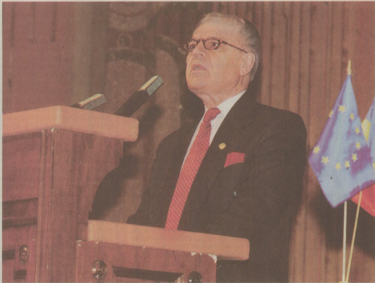
Din interesanta biografie a lui Dumitru Mazilu, în 1989 interesa numai că a criticat în scris România, într-un raport adresat Organizației Națiunilor Unite

Nici măcar cei care au făcut parte din elita politică și care au înțeles rezultatele catastrofale ale politicii impuse de conducere nu au îndrăznit să se opună, din cauză că „ierarhia conducătoare însăși este terorizată de măsurile represive ale clanului dictatorial al lui Ceaușescu.”