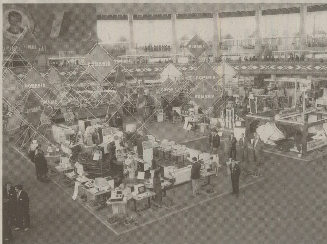
Desfășurată sub deviza „Comerț - cooperare - dezvoltare - pace”, ediția a XV-a a TIB-ului a reunit peste 700 de întreprinderi producătoare

De atâtea economisire, oamenii din întreprinderile de stat și institute de cercetare din acele vremuri se transformaseră în adevărați vrăjitori pentru a putea produce și a onora comenzile la export. În sude-