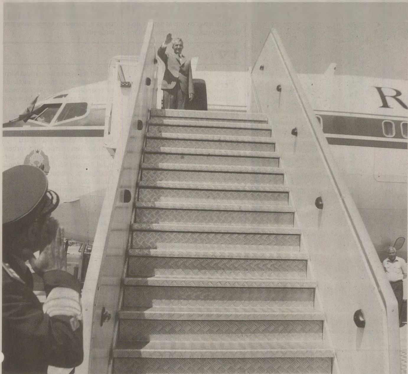
Motoarele aeronavelor din Flotila 50 Aviație Transport erau noi și se înlocuiau în mod automat după consumarea a 60% din resursa garantată