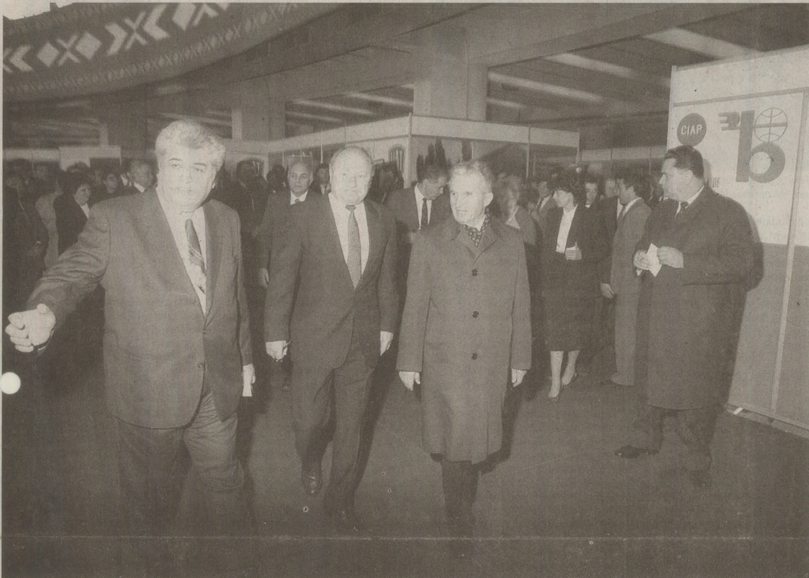
La Târgul Internațional București, directorii de întreprinderi aveau ocazia să-i prezinte lui Nicolae Ceaușescu produsele de „ultimă generație” ale unităților pe care le conduceau.