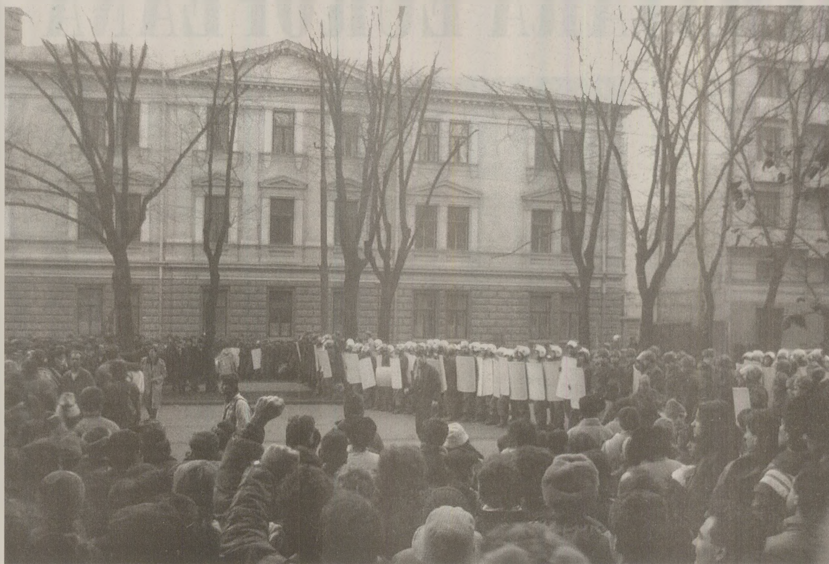
Astăzi, doar placa comemorativă de la Dalles ne mai atenționează că „Aici au murit eroi adevărați – 21 decembrie 1989“.