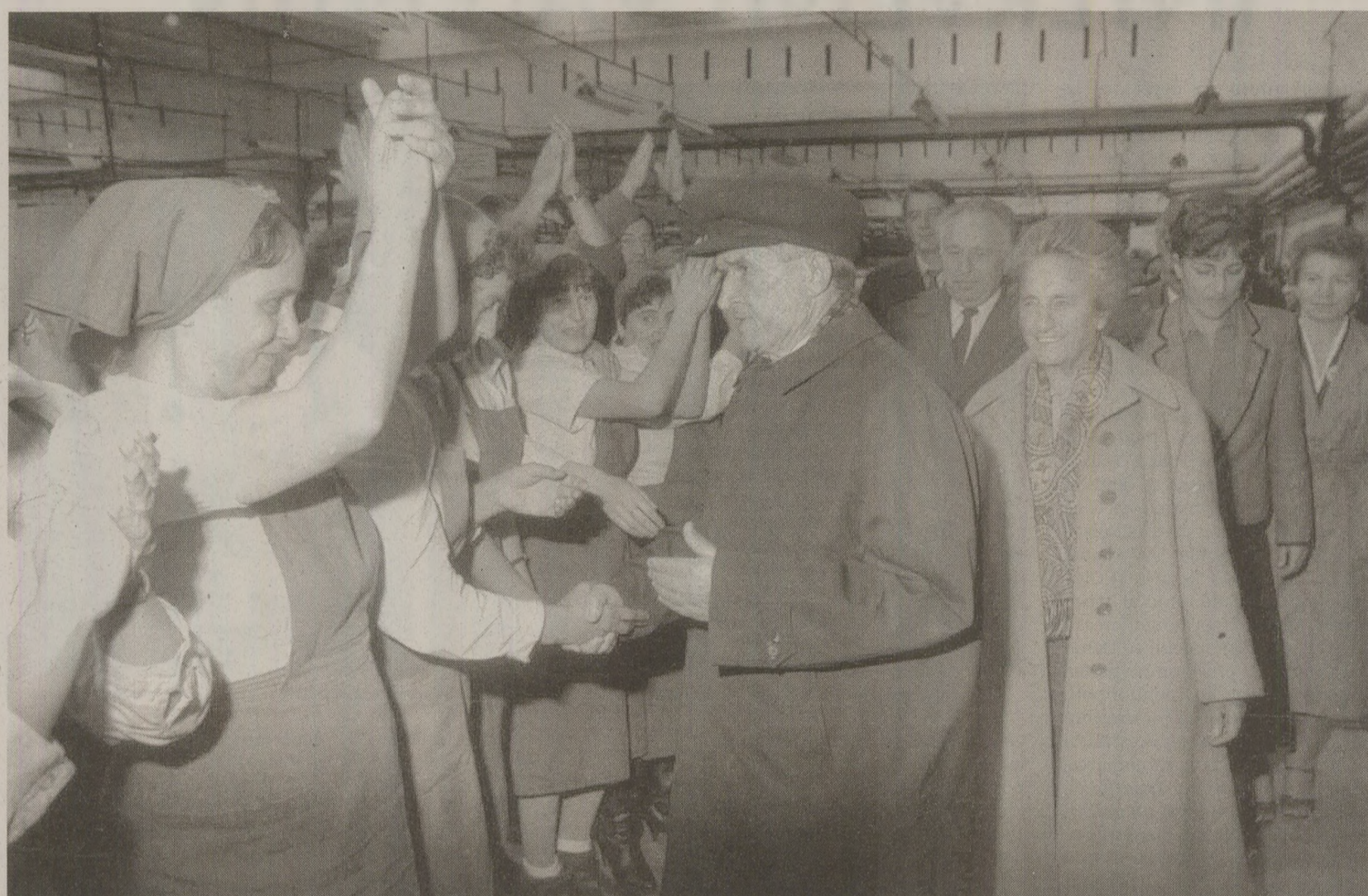
Înainte de Congresul al XIV-lea, Ceaușescu a vizitat mai multe întreprinderi și piețe din București

Pentru moment, în orice caz, domnul Ceaușescu pare că ar controla aceste contestații, iar Moscova nu pare să se grăbească cu vreo contribuție la căderea acestui regim, prea puțin gorbaciovian în mod evident, dar care, pe plan comercial, îl face