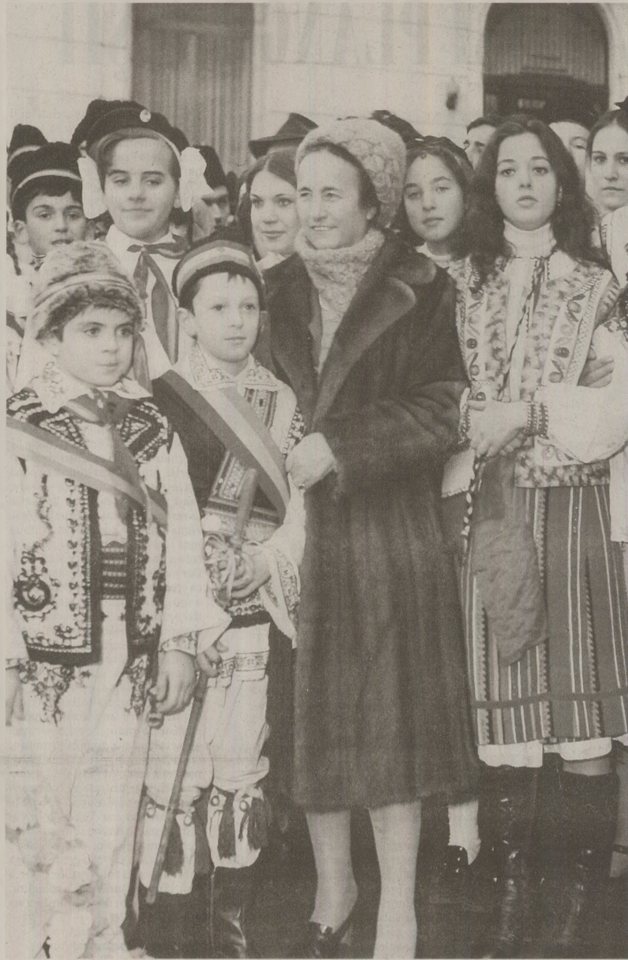
Mulți dintre copiii „Epocii de Aur” nici nu mai știu astăzi cine a fost Elena Ceaușescu. Fina de la Iași o pomeneste totuși în rugăciunile ei.