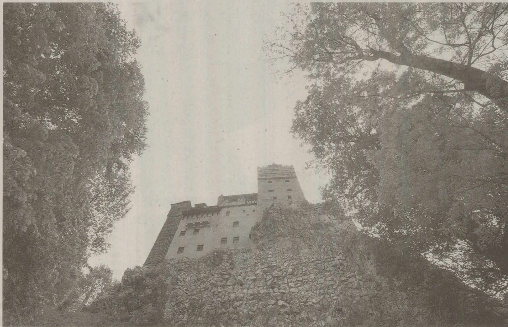
Turii străini erau atrași în România de castelul Bran, în care, potrivit legendelor, ar fi locuit Vlad Dracul

Au aflat că Dracula a fost într-un fel sursa de inspirație pentru conducătorii de mai târziu, cum sunt Ivan cel Groaznic și Robespierre. „Însă numele său a fost cu totul uitat până când scriitorul irlandez,