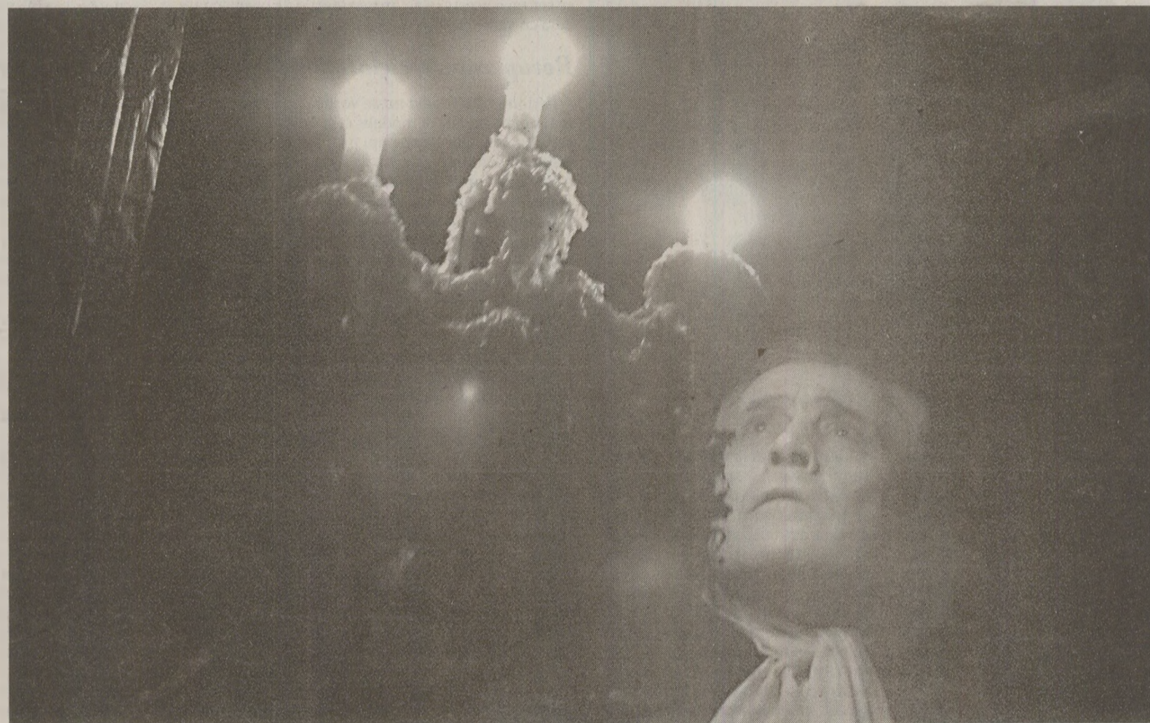
Mitul vampirului fascina populația occidentală, fiind subiect principal pentru cărți de istorie și lucrări științifice