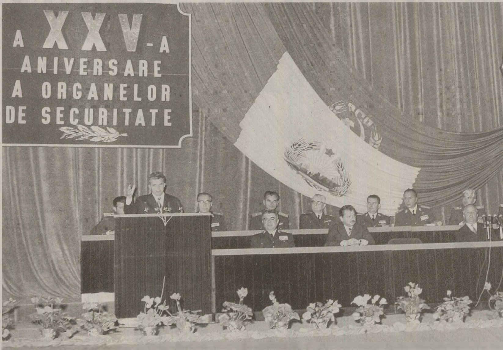
În timpul regimului Ceaușescu se organizase, în cadrul Departamentului Securității Statului, un serviciu cuasiindependent, care se ocupa de operațiunile valutare speciale cu exteriorul

Operațiunile valutare speciale, cunoscute sub acronimul AVS, nu au apărut o dată cu venirea lui Nicolae Ceaușescu la putere în anul 1965. Ele s-au stăpânit de la predecesorul său, Gheorghe Gheorghiu-Dej, și s-au organizat și desfășurat îndeosebi după modelul activităților serviciului de informații extern sovietic, componentă a KGB, ca și a celor din cadrul Secției Administrative a CC al PCUS (cunoscute la noi sub denumirea de Gospodărie de partid