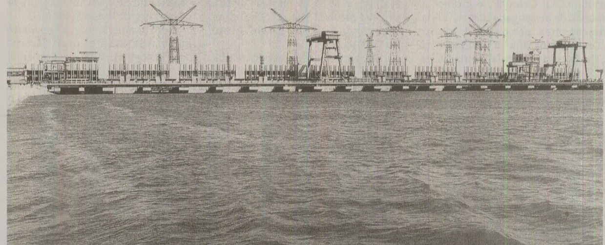
Energeticienii hidrocentralei Porțile de Fier se numărau printre fruntașii „intrecerii socialiste”