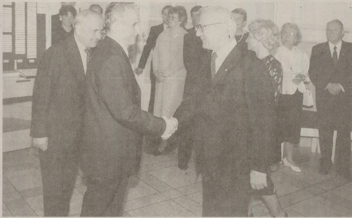
În Berlinul de Est, populația ieșise în stradă. Regimul lui Erich Honecker (dreapta) ajunsese la final. Pentru a evita aceeași soartă, omologul său de la București a ales să nabuze orice semn de revoltă împotriva sistemului.

reștiului, un conglomerat bizar de stalinism instituțional corupt, naționalism folcloric și nord-coreeanism utopic, în coordonatele unei societăți epuizate de foame, frig și umilința morală a dublului limbaj totalitar care identifică la infinit mizeria cu triumful și nenorocirea cu fericirea. Congresul al XIV-lea al PCR a fost pregătit cu înverșunare, într-o desfășurare de atacuri împotriva tuturor, de la impe-