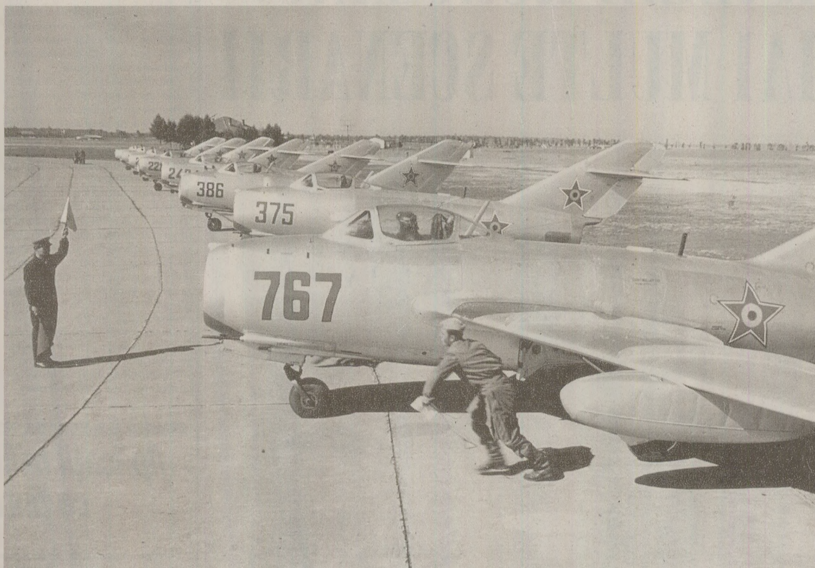
În scenariile aplicațiilor militare de apărare efectuate în România, printre tinte aeriene se numărau și avioanele de vânătoare-bombardament MIG-15 și MIG-17.

Un alt exemplu de antrenament de cooperare în cadrul OTV este cel planificat pentru data de 11 iulie 1989. Cu acel prilej, câte doi ofițeri bulgari au fost primiți în punctele de comandă ale Regimentelor 91 și 93 Aviație Vânătoare, românești, pentru dirijarea celor 20 de avioane-tintă ale părții bulgare. În raportul trimis de generalul-colonel Vasile Milea lui Nicolae Ceaușescu, la 6 iunie 1989, s-a precizat faptul că