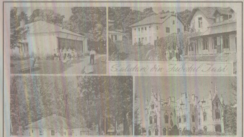
Ilustrată editată de Poșta Română