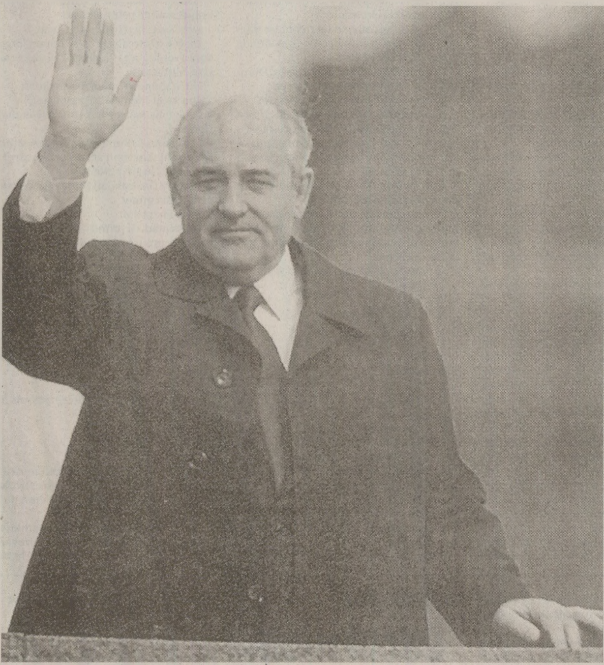
Ce ar face Gorbaciov dacă Ungaria ar decide să iasă din Pactul de la Varșovia? era întrebarea care „măcina” în ultimele săptămâni presa occidentală