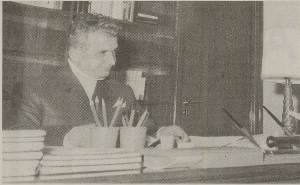
Ultima Sinteza specială citită de „Tovarășul” era liniștitoare. Documentele promiteau mersul netulburat al lumii spre comunism

Ce-i ofereau lui Ceaușescu „experții” singurei agenții de presă din România? Nimic altceva decât știri și declarații accesibile cititorului de ziar din „lumea liberă” interesat de Est. Spre exemplu, decupaje din declarația lui Gorbaciov pentru agențiile China Nouă și Tass la ultima sa vizită din China. „În trecut consideram că nu există decât un model de socialism, zise atunci liderul PCUS. Realitatea demonstrează că lucrurile nu stau tocmai așa. Am analizat această problemă în ultimii câțiva ani. Nu am renunțat la marxism-leninism, dar încercăm să-l aplicăm concret la viața noastră, potrivit condițiilor reale ale țării noastre.”