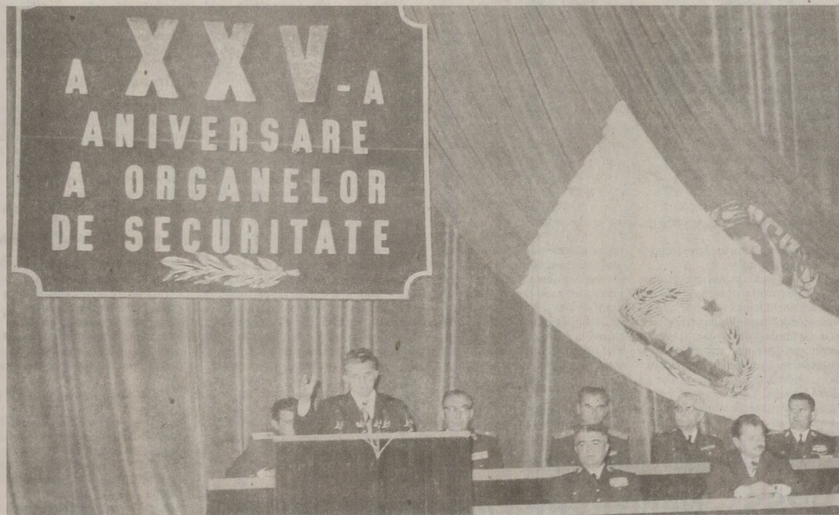
Surse din interiorul Securității au relatat după 1989 că ofițeri de rang înalt plănuiau debarcarea „Tovarășului”