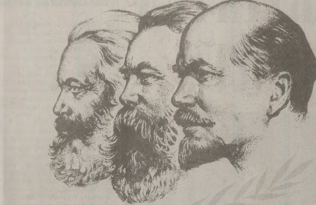
Clasicii marxism-leninismului au fost interpretați diferit, în funcție de „epocă” și „conducător”