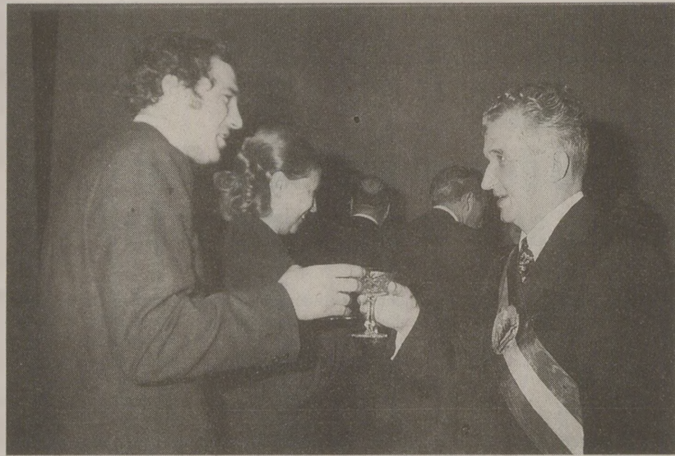
În a doua jumătate a deceniului nouă, relațiile dintre Nicu Ceaușescu și părinți deveniseră formale