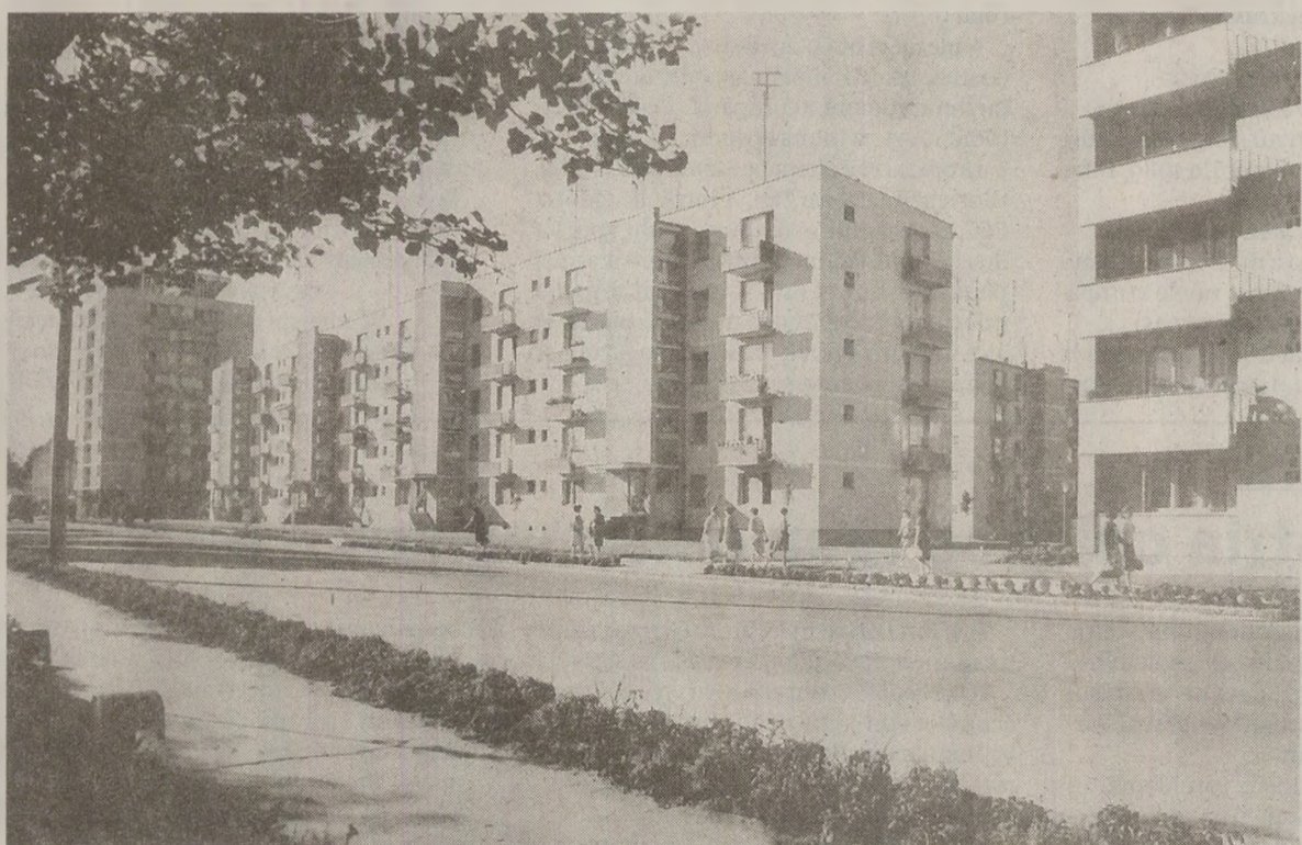
Tot mai mulți români denunțau, în 1989, tezele partidului despre „viitorul luminos” al țării

Radio Europa Liberă difuza la începutul lunii noiembrie a anului 1989 scrisoarea deschisă a unui cetățean român care critica programul directiv al Congresului al XIV-lea al PCR.