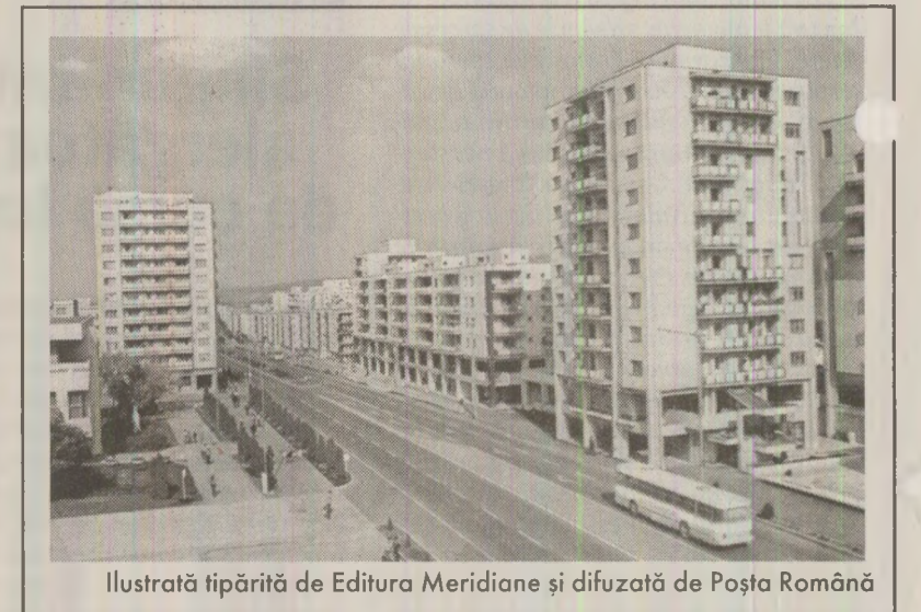
Ilustrată tipărită de Editura Meridiană și difuzată de Poșta Română