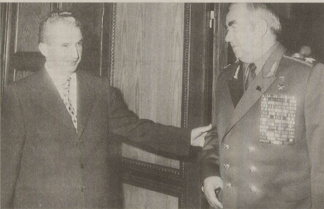
Fără o zi de armată, atotce cunosătorul Ceaușescu nu-i scutea de „indicații prețioase” nici pe militarii de carieră. Pe români. Cu sovieticii n-avea nici o șansă