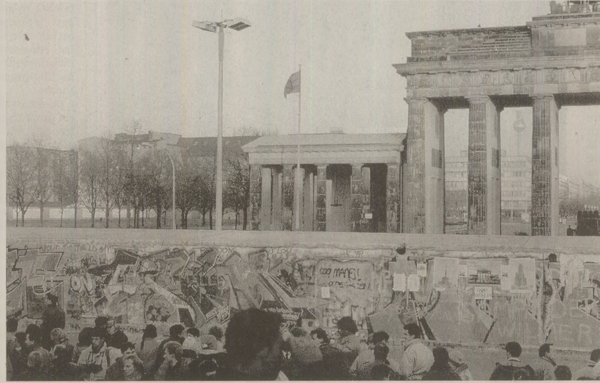
În noaptea de 8 spre 9 noiembrie, zeci de mii de berlinezi au așteptat de-o parte și de alta deschiderea punctelor de frontieră din zidul-graniță între RDG și Germania Occidentală.

magică. Se încheie o istorie întunecată. Zidul de la Berlin a fost cel mai puternic simbol al divizării Europei. „Zidul protector antifascist”, cum i se spunea oficial zidului, avea 165,7 kilometri în jurul Berlinului occidental. „Fiecare secțiune avea o lățime de aproximativ 1,2 m, o înălțime de 4 m și o grosime de 15 cm, împodobită cu bare de oțel armat din 10 cm în 10 cm. Înainte de ridicarea zidului, 3 milioane de est-germani (a șasea parte din populație) trecuseră în Vest. 2.000 de oameni pe zi treceau în vara anului 1961 în Vest. „46 de morți printre cei care au încercat să treacă zidul în 1962. În 1989, au fost doi. Cifrele oficiale dau 258 de uciși de grăniceri. În 1991, statisticile dau alți 216 morți. Nu se cunoaște numărul real al celor care au reușit să treacă zidul între 1961 și 1989. Și deodată, după 28 de ani și 91