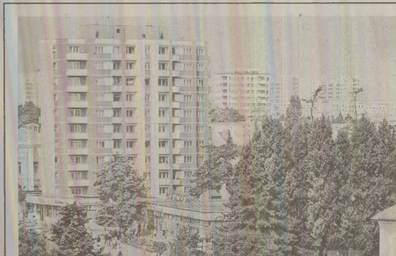
Ilustrată tipărită de Editura Meridiane și difuzată de Poșta Română