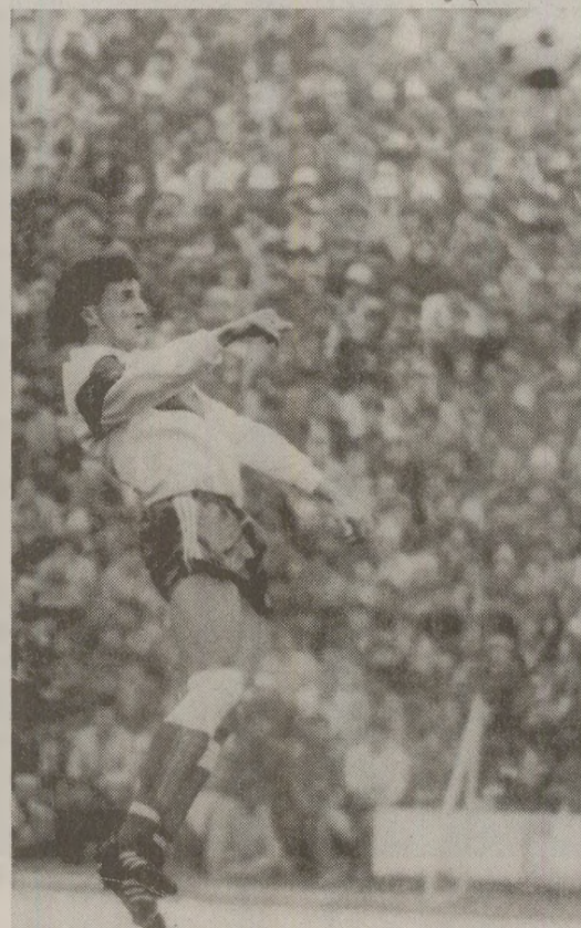
Gică Popescu a fost unul dintre cei mai buni jucători ai Universității contra lui Dinamo

După cum își amintește tehnicianul, meciul a avut o istorie aparte. „Primele cinci minute nu s-a jucat fotbal absolut deloc, ci au fost numai intrări tari, faulturi, scrăpnete de tîbi și jucători rămași pe gazon. După aceea s-a mai liniștit atmosfera cît de cît, iar partida a devenit una foarte bună. Dinamo