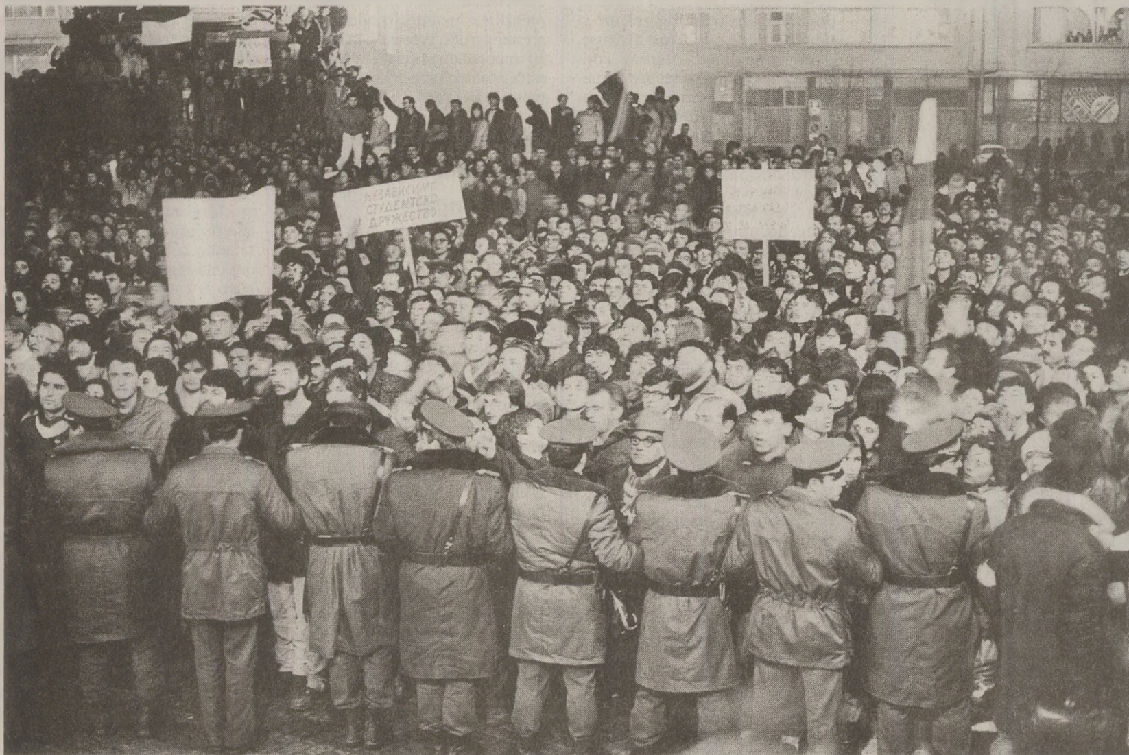
Căderea lui Todor Jivkov, lider necontestat al Bulgariei timp de trei decenii, a provocat un entuziasm general pe străzile Sofiei.