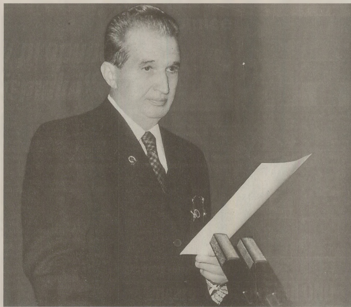
Deși Ceaușescu evoca în raportul prezentat în Congres realizările deosebite ale socialismului în România, pe străzi, oamenii erau din ce în ce mai abătuti și mai descurajați

„Relațiile” sunt întreținute cu „mici cadouri” de care oamenii fac rost la locul de muncă. Furtul din întreprinderi a devenit sport național. „Statul ne fură destul, nu văd de ce nu așa face și eu la fel”, comentează cinic unul dintre interlocuții noștri. Pasiunea românilor pentru mașinile particulare asigură mecanicul auto—din cauza lipsei pieselor de