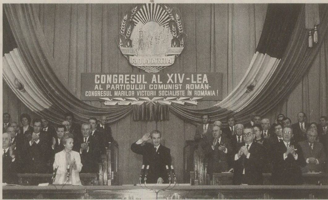
Generalul Olteanu a fost acuzat în vara lui 1989 că, împreună cu Nicu Ceaușescu (foto stânga), ar fi vrut să-l înlăture pe Nicolae Ceaușescu de la putere.