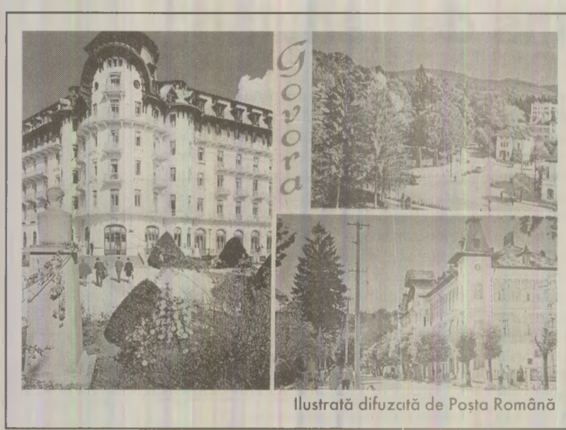
Ilustrată difuzată de Poșta Română