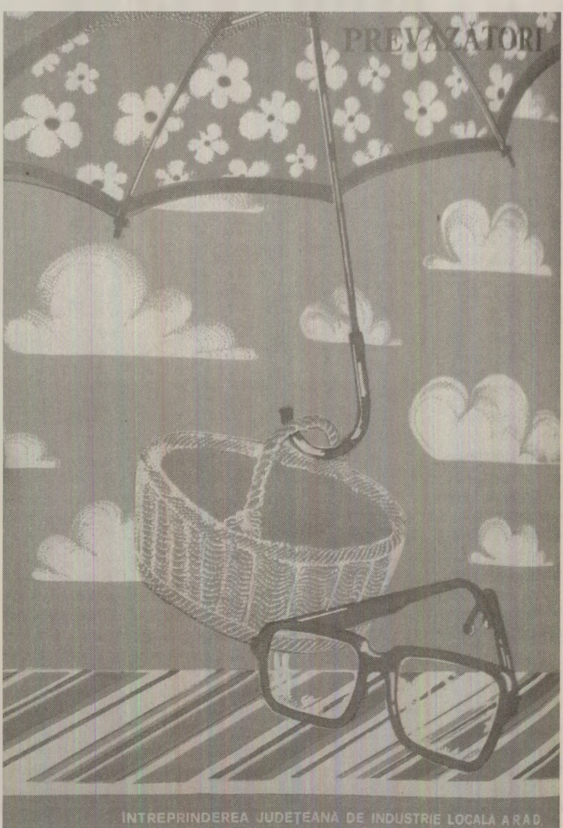
ÎNTRPREINDEREA JUDEȚEANĂ DE INDUSTRIE LOCALĂ A R.A.B.