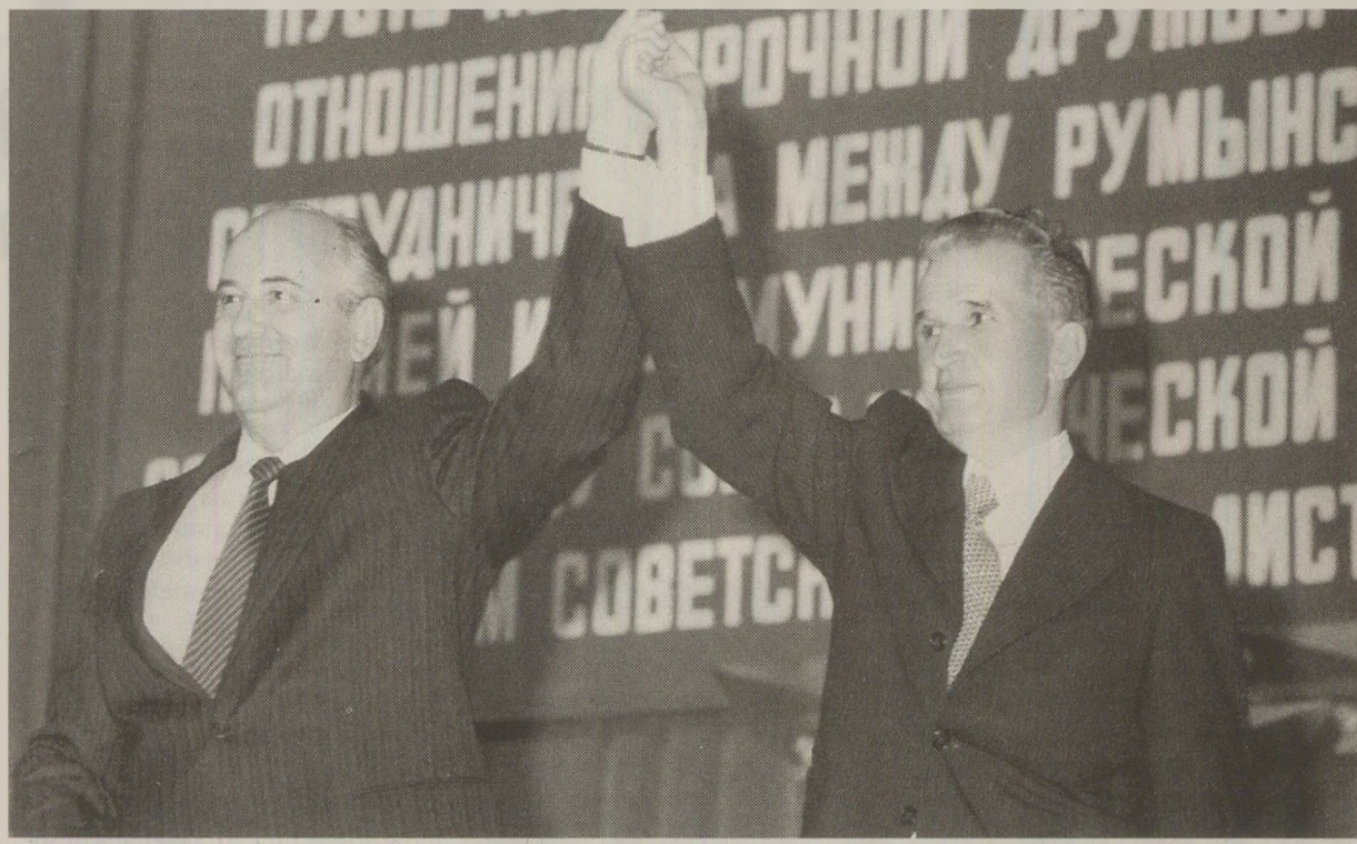
În ciuda fotografiilor de propagandă, la ultima discuție, Ceaușescu și Gorbaciov s-au contrazis tot timpul

Tov. Nicolae Ceaușescu: Este adevărat, dar totuși eu consider că Partidul Comunist al Uniunii Sovietice nu trebuie să rămână în afara unei asemenea acțiuni. Însă, așa cum am spus, nu cred că trebuie să hotărâm acum asupra acestei probleme. Eu vă rog însă să reflectați asupra ei.