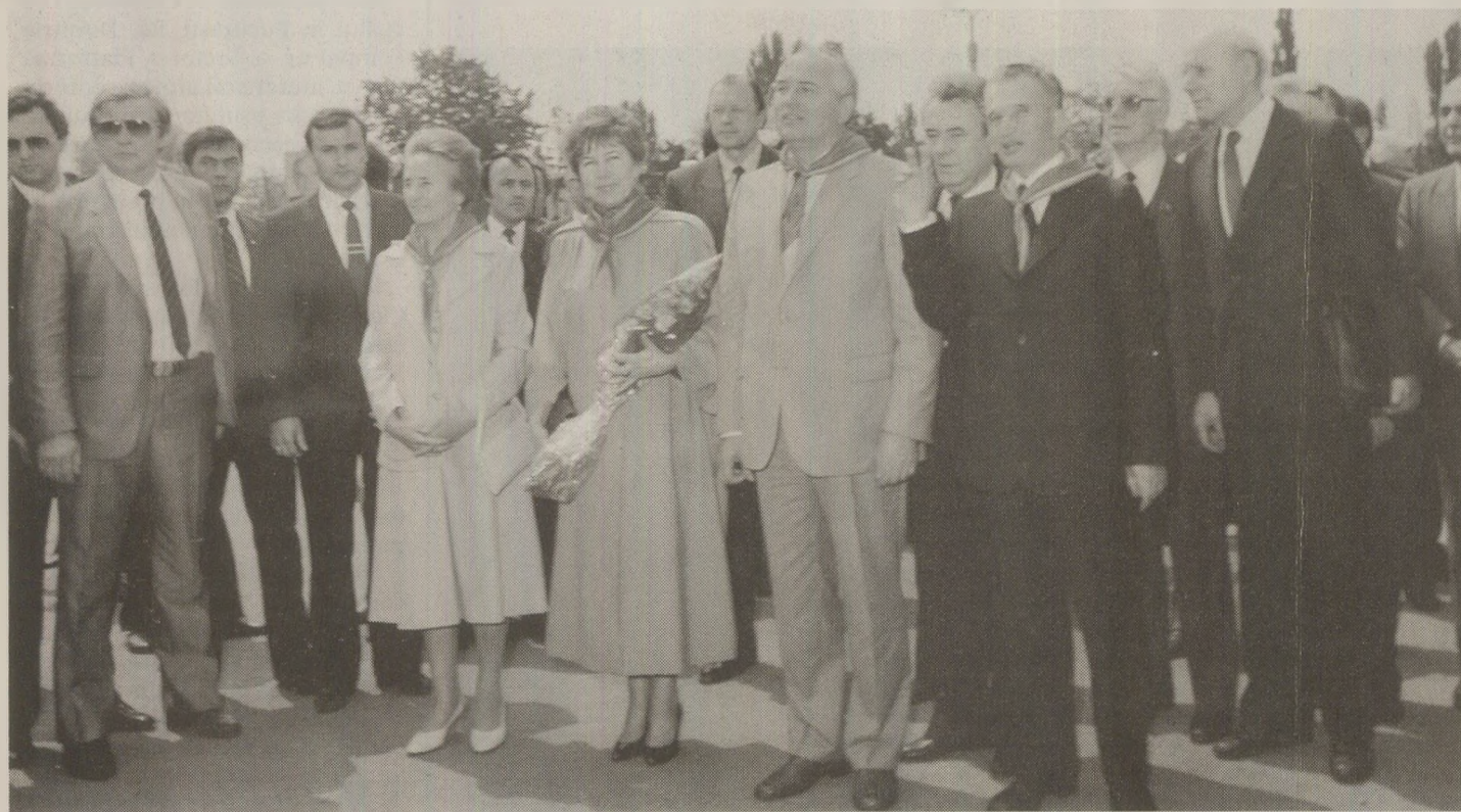
Încă de la vizita din 1987 s-a văzut că liderul de la Kremlin nu-l prea agreea pe „tovarășul Ceaușescu”