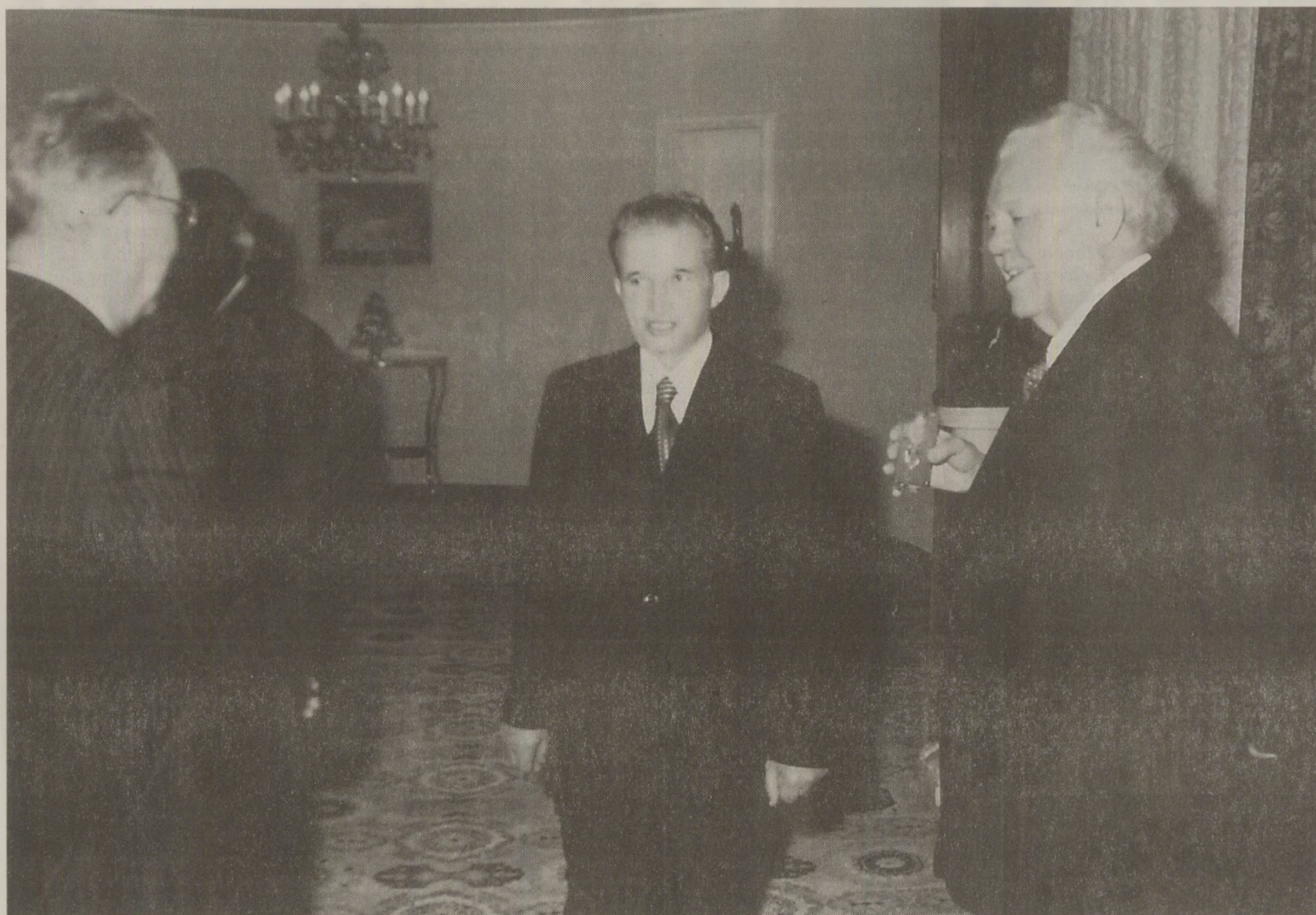
În afara de Ceaușești, doar Gogu Rădulescu (dreapta) a mai vorbit la ședința Biroului Permanent al CPEX din 5 decembrie

Tov. Nicolae Ceaușescu: Uite, tovarăși, s-a pus așa o problemă, dacă să dăm o declarație la Agerpres în legătură cu poziția României față de intervenția unor țări socialiste în anul 1968 în Cehoslovacia. Cunoașteți că ceilalți au dat. Tovarășii au făcut aici un proiect de declarație pe cinci pagini. Acum nu știu dacă are