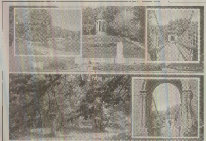
Ilustrată difuzată de Poșta Română