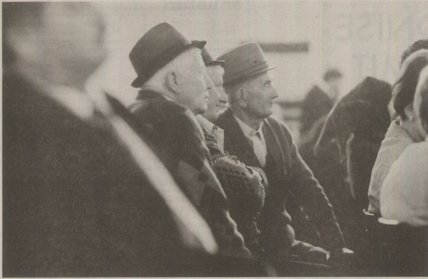
Muți de admirație rămăneau sătenii din Valea Grecului mai ales la producțiile indiene