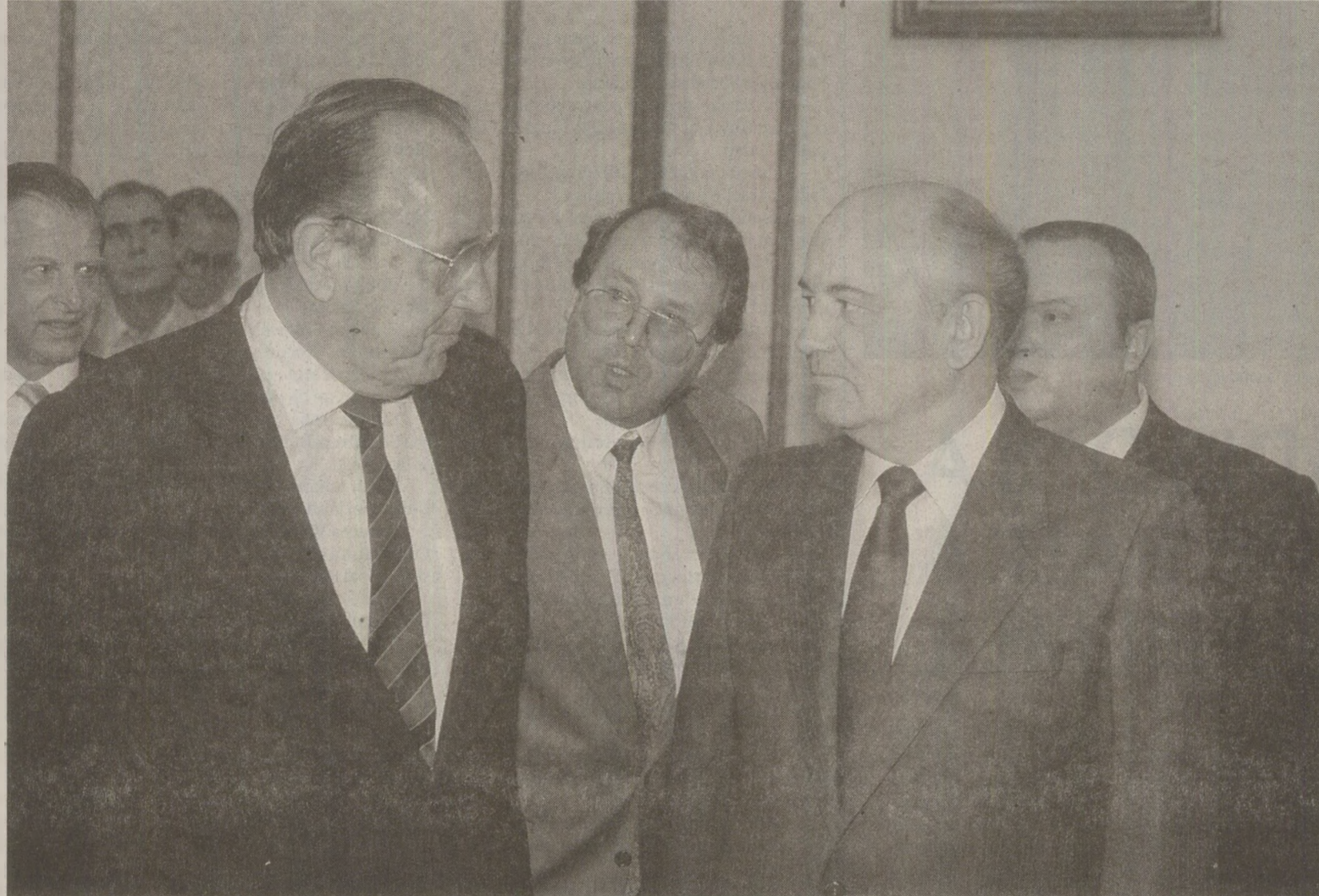
Planul de reunificare a Germaniei este lipsit de bun-simț, i-a spus Mihail Gorbaciov ministrului de Externe al Germaniei Federale, Hans Dietrich Genscher la întâlnirea din 6 decembrie.

La rândul său, Mihail Gorbaciov a spus că nu sunt suficiente declarațiile de bune intenții, ci că trebuie acționat practic. Din păcate, apar acțiuni despre care trebuie să vorbim. S-a referit, în mod concret, la planul în zece puncte al cancelarului Kohl privind unificarea Germaniei. Acest plan a fost caracterizat de M. Gorbaciov ca fiind împotriva bunului-simț și că aceasta îngreunează continuarea proceselor pozitive din Europa. De asemenea, planul conține - a precizat Gorbaciov - un ton ultimativ la adresa RD Germană, dar poate mai târziu și față de URSS, ceea ce poate constitui un per-