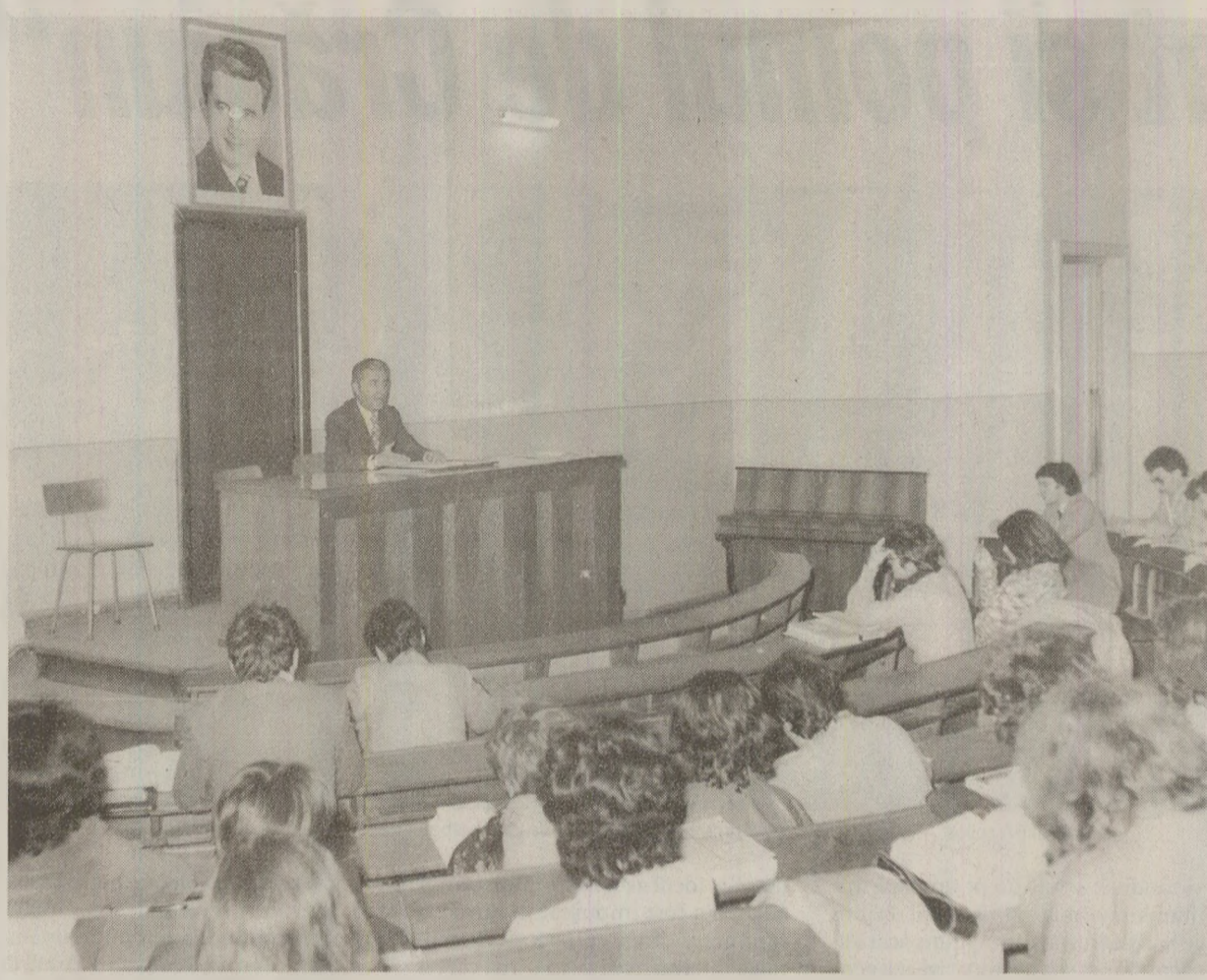
Prin scrisorile la Radio Europa Liberă, studenții protestau față de atmosfera de minciună în care trăiau

Oare mai e de acceptat acest mod de a trăi, în ascundere, pasivitate? Desigur, s-ar putea spune: suntem după 40 de ani de comunism forțat. Doctrina a fost clară: «dezbină și cucerește». Tocmai când așteptam o Românie nouă, a venit acest potop, bravii noștri oameni au murit în pușcărie, iar cei ce au rămas sunt obligați să tacă. Da, așa este, însă cât timp ne mai putem dezvinovați cu astfel de afirmații? Acestea erau perfect valabile în anii '65, după ce țara