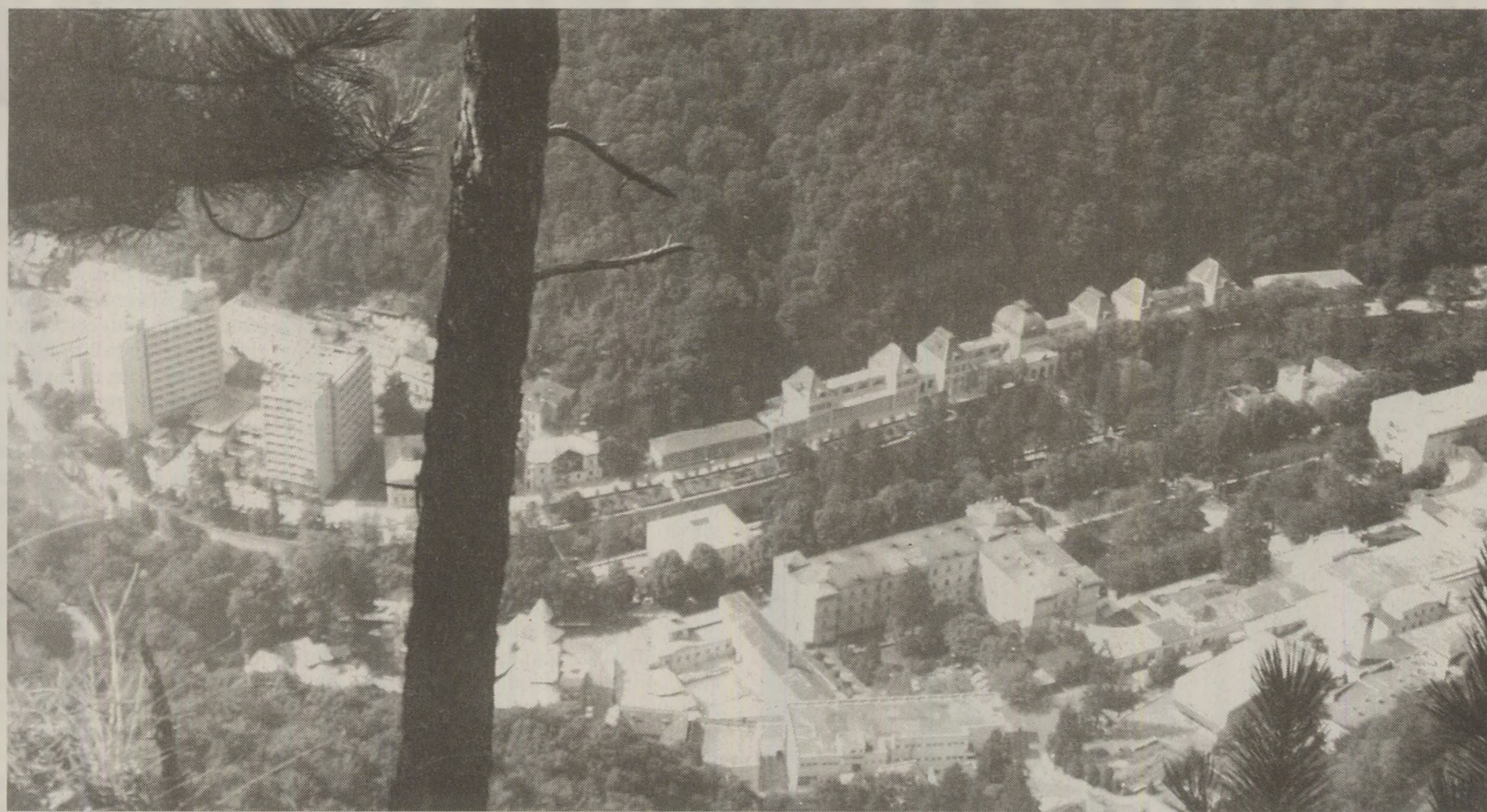
Stațiunea de la Băile Herculane era printre cele mai cunoscute centre de tratament balneoclimateric în 1989.

Turismul balnear reprezintă un mijloc deosebit de eficient în angrenajul complex al mijloacelor folosite pentru prevenirea îmbolnăvirilor și apărarea sănătății poporului, pentru menținerea tineretii națiunii. Pentru dezvoltarea și modernizarea bazei materiale turistice s-au investit sume uriașe, de ordinul a miliarde de lei (cursul dolarului varia între 6 și 12 lei).