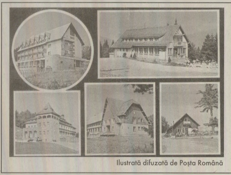
Ilustrată difuzată de Poșta Română