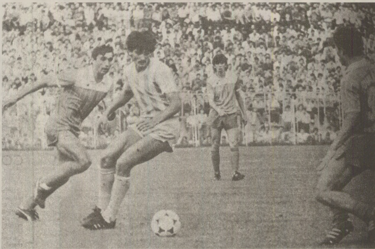
Dinamoviștii au reușit scorul etapei în fața celor de la „U” Cluj, 6-0, și nu mai puteau pierde primul loc