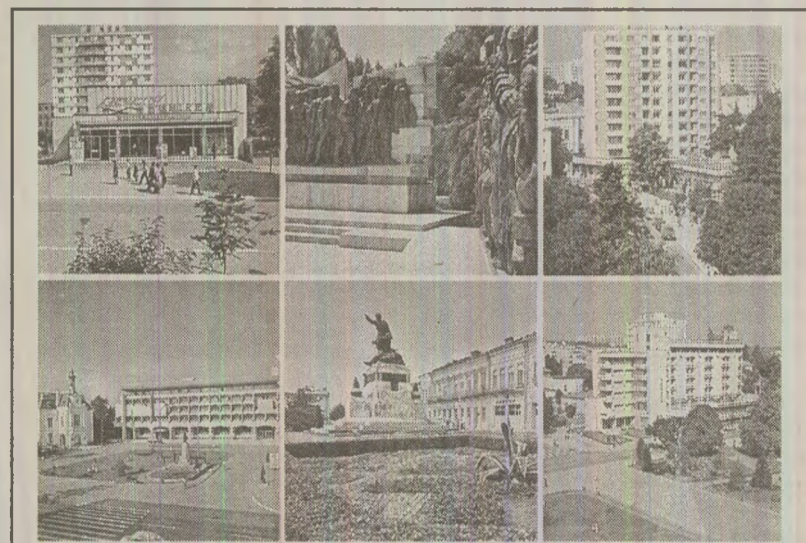
Ilustrată difuzată de Poșta Română