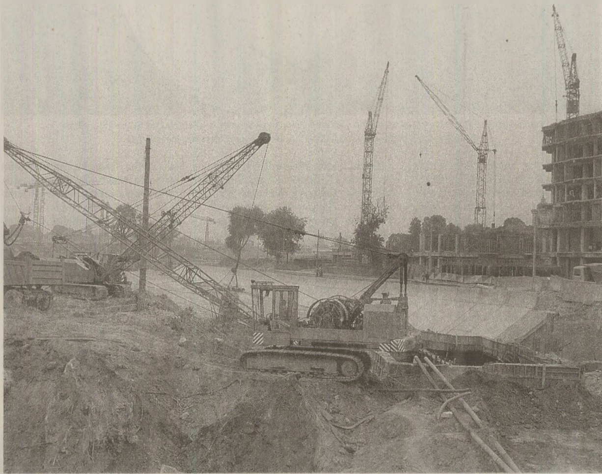
Proiectele de urbanizare forțată prin distrugerea satelor l-au adus lui Nicolae Ceaușescu antipatia opiniei publice occidentale.

În spațiul public belgian, România a pătruns puternic mai ales în 1989. Cu o imagine negativă. Distrugerea satelor și foamea generalizată erau doar câteva dintre știrile care circulau pe seama regimului de la București. „O dată cu lansarea campaniei OVR, atitudinea față de România a devenit subiect de dezbatere politică în Belgia, spune Michel Mommerency. OVR a adresat tuturor municipalităților invitația de a patrona/a se imprietenii cu un sat românesc pentru a-l salva de la distrugere. Numeroși democrați și progresiști din comune, din școli, din asociații au participat la campanie, în ideea de a fi părtași la o acțiune pozitivă în favoarea drepturilor omului. Opinia publică era convinsă că în România mii de sate vor fi rase de bulldozerii lui Ceaușescu și că țara era