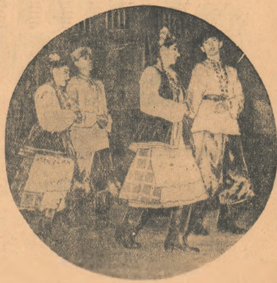
Dansurile ucrainene sint avîntate, au figuri complicate, pe care începătorii nu le învață cu prea multă ușurință. Și totuși, cu cîtă siguranță a dansat echipa Centrului școlar profesional siderurgic din Hunedoara, un asemenea dans!

Trbuie să recunosc că n-aș fi crezut nicodată că în școlile profesionale au crescut așa de repede artiști amatori talentați și pricepuți, în stare să infrumusețeze dansurile noastre populare printr-o interpretare măiestră, plină de tinerete.