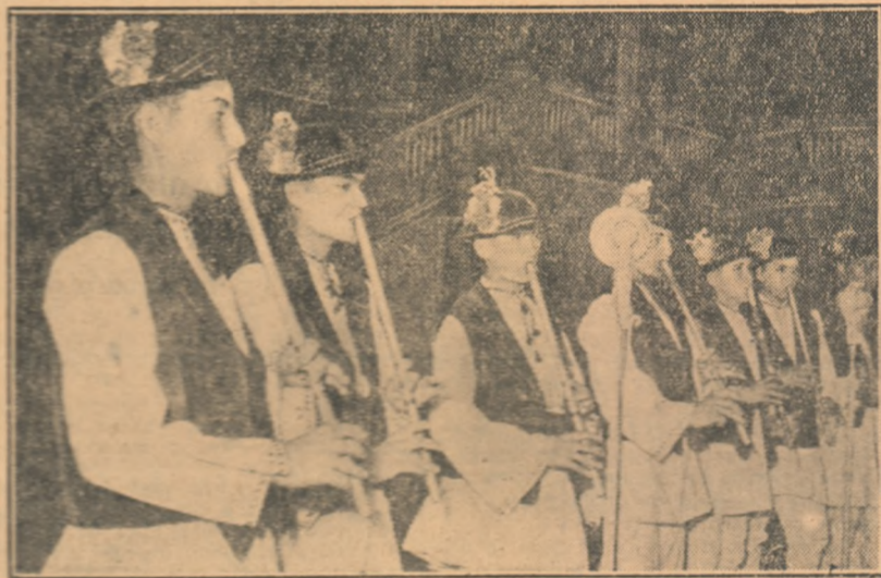
În toată țara sint cunoscuți fluierașii din împrejurimile Sibiului, care știu să dea o măiestră interpretare frumoaselor cîntece populare. Nici de data aceasta ei nu și-au dezmințit renumele: echipa de fluierași de la Școala profesională de energie electrică nr. 5 din Sibiu a prezentat la concurs trei cîntece din regiune — „Doina din Ardeal”, „Jiana” și „Invîrtita”, pentru care a fost distinsă cu premiul II.