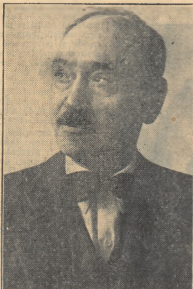
Academician, profesor doctor NICOLAE GH. LUPU distins pentru întreaga sa activitate științifică în domeniul științelor medicale.