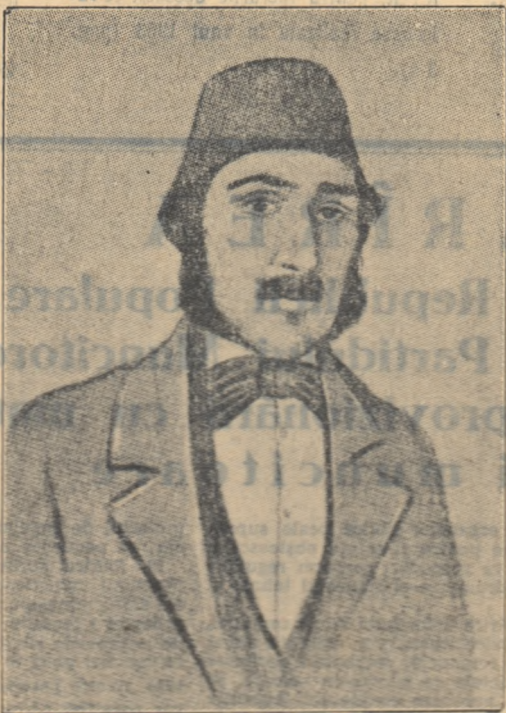
ANTON PANN

S-a născut într-un oraș din Bulgaria către sfîrșitul secolului XVIII se pare la 1797, ca fiu al unor mici meșteșugari. Din pricina războiului ruso-turc din 1808 — 1811, familia scriitorului se refugiază în nordul Dunării. Așa ajunge Anton Pann la Chișinău, unde-l găsim cîntăreț de strănă. Aici însă nu rămîne multă vreme, ci se mută, împreună cu mama sa, la București unde-și va desfășura bogata activitate de scriitor, editor și compozitor bisericesc, pînă la sfîrșitul vieții sale, acum un veac, în 1854.