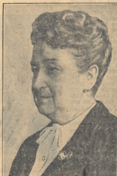
Academician RALUCA RIPAN profesor universitar distinsă pentru contribuțiunile în domeniul chimiei analitice și pentru studiul soluțiilor apoase de heteropoliacizi.