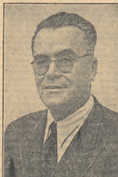
DIMITRIE MACREA profesor universitar distins pentru lucrarea „Gramatica limbii romine” vol. I și II.