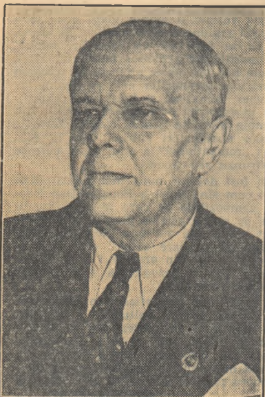
Academician, profesor doctor GHEORGHE SPACU distins pentru lucrarea „Proces tehnologic pentru fabricarea acidului sulfuric și a cimentului din ghips”.