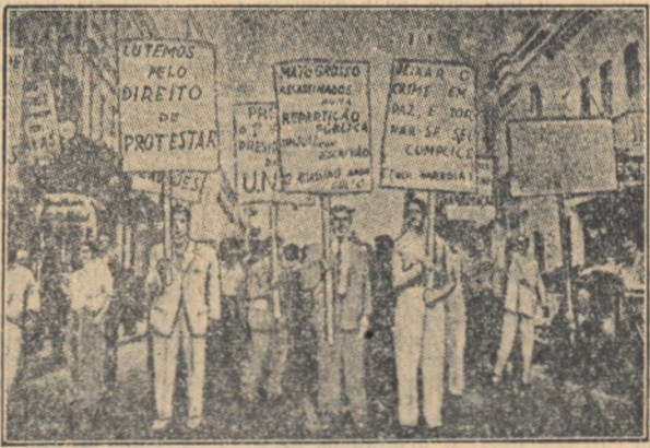
În luptă pentru revendicările lor democratice studenții brazilieni își string tot mai mult rîndurile. În fotografie o manifestație a studenților brazilieni pentru drepturi și libertăți democratice.

E interesant de arătat că problemele luptei pentru drepturi politice intră acum și în preocuparea acelor uniuni naționale care altă dată așiau ceea ce ei numeau „apolitism”. Astfel într-o rezoluție a Uniunii naționale a studenților din Norvegia se spune: „...Există în lume organizații studentești care au de rezolvat probleme foarte diferite de ale noastre, dar care sînt cu toate acestea probleme studentești...”