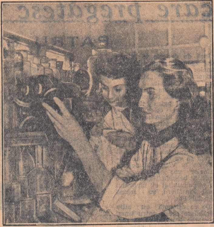
Utemistii de la Institutul de cercetări textile, pielărie și cauciuc din București muncesc cu însuflețire pentru a contribui la realizarea sarcinilor Hotărârii partidului și guvernului...