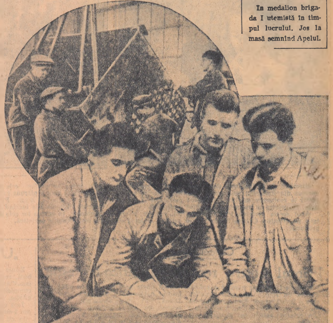
In medallon brigada I utemistă în timpul lucrului. Jos la masă semnînd Apelul.

Consiliul Central al Sindicatelor din Republica Populărească în întregime cu Chemarea Comitetului Permanent pentru Apărarea Pații din R.P.R., pentru chemarea Consiliului Mondial al Păcii.