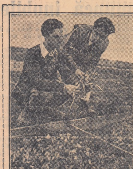
Sporirea producției de legume și zarzavaturi constituie o preocupare de seamă în munca tinerilor grădinarilor din gospodăria agricolă de stat „1 Mai” din Tulcea, regiunea București.