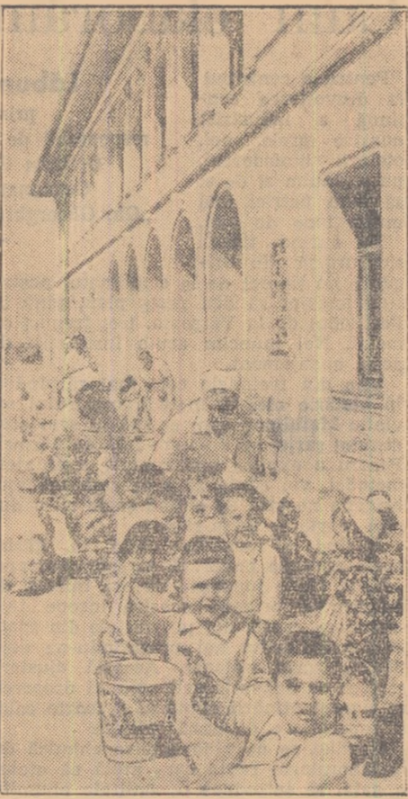
Cîteodată explicațiile sînt de prisos. Înșiși fotografia e mai grăitoare decît orice comentariu. Fețele acestor copii exprimă atîta bucurie, atîta liniște încît nu e nevoie de spus vreo cuvînt despre condițiile minunate ce li s-au creat în noua creșă a Combinatului poligrafic „Casa Școlii“.

Și orice vizitator se va convinge de grîja deosebită pentru copiii din această creșă, de inovațiile introduse chiar și fără explicațiile de a plăcere de tovarășe care îngrijesc cu atenție cei peste 80 de micuți ai muncitorilor tipografi.