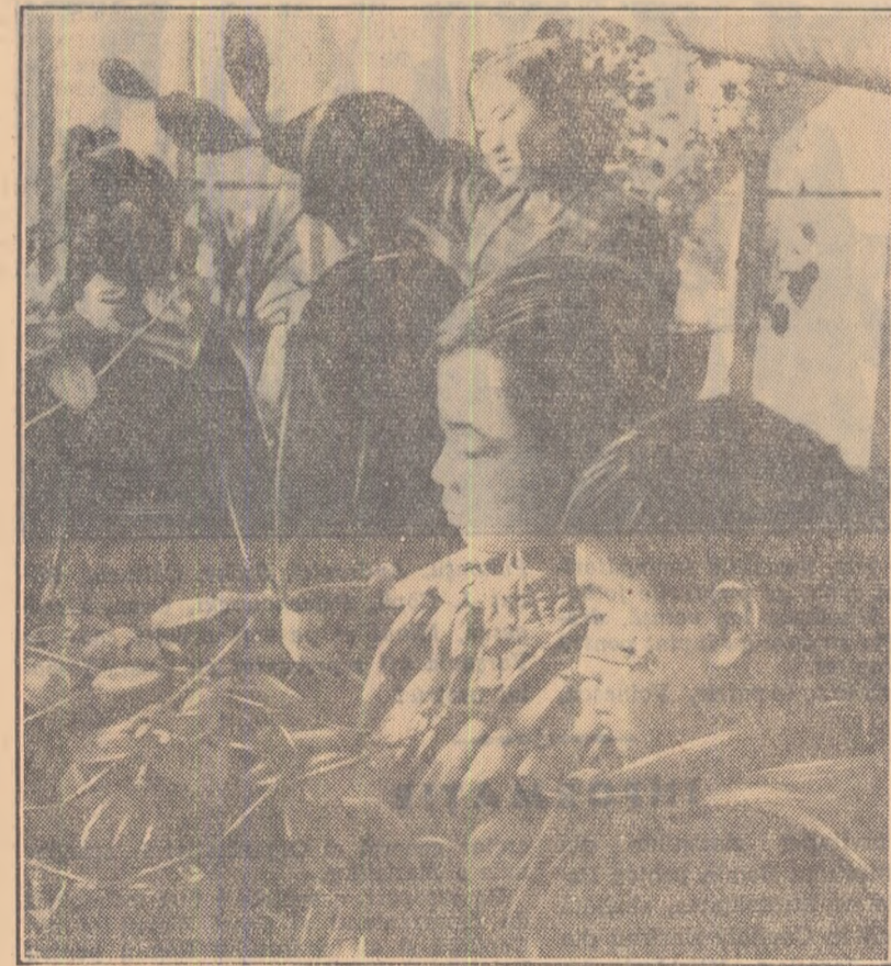
În R.P.D. Coreeană se acordă o grijă deosebită dezvoltării tineretului. În fotografie: tinerii naturalști de la Școala medie nr. 1 din Phenian, îngrijesc cu dragoste plantele din serra școlii.

Cea de a 10-a aniversare a eliberării Coreei găsește tineretul coreean în plin avînt constructiv, în plină luptă pentru pace.