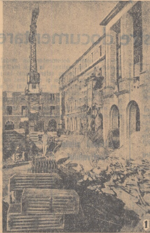
1. Spre marginea de nord a Bucureștiului, peste linia ferată ce duce la Constanța se întindea pe vremuri o mahala cu bordeie sărmane, maidane și gropi prin care vagabondau copii scheletici și cîini flămînzii. Oamenii ce locuiau aici — muncitori de la fabricile apropiate — orbecăiau seara prin tuneric blestemînd primarii hîrăpăreți și soarta amară. Bucureștii-Noi — acest nume aruncat în ironie — își găsește în zilele noastre adevăratul înțeles: un cartier nou, format din multe blocuri muncitorești, strălucite belevardul luminos. La blocurile încă în construcție munca se desfășoară

În felul acesta se reușește să se înfăptuiască unitatea între cerințele școlii și familiei față de elevi. Dar pentru ca această unitate să se realizeze în fiecare școală, legătura strînsă între cei doi factori — școală și părinți — trebuie să devină o lege.