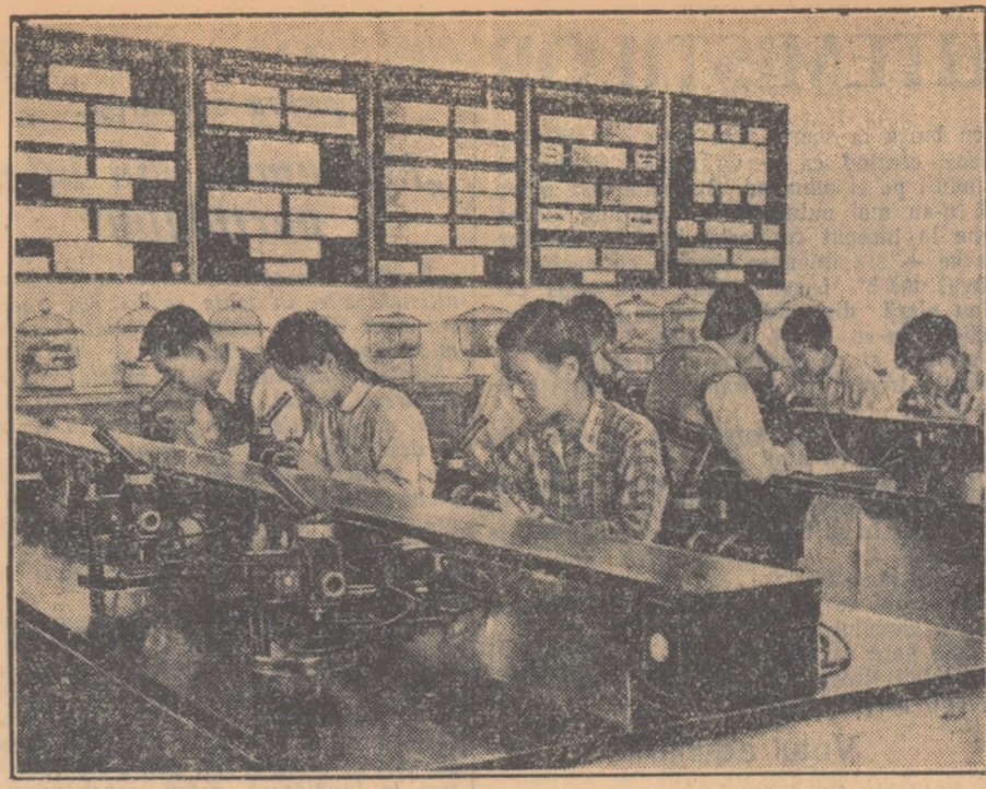
Invățământul tehnic superior la o mare dezvoltare în Republica Populară Chineză. În fiecare an, pe porțile institutelor ies tot mai mulți specialiști cu o înaltă calificare. În fotografie li puteți vedea pe studenții „Institutului de tehnologie a fierului și oțelului” din Pekin, în ora de laborator. Acest institut e primul de acest fel în R.P. Chineză.

Seara, oaspeții au admirat de la reședința lor jocurile de artificii și lumini organizate în cinstea sosirii lor în Kașmir.