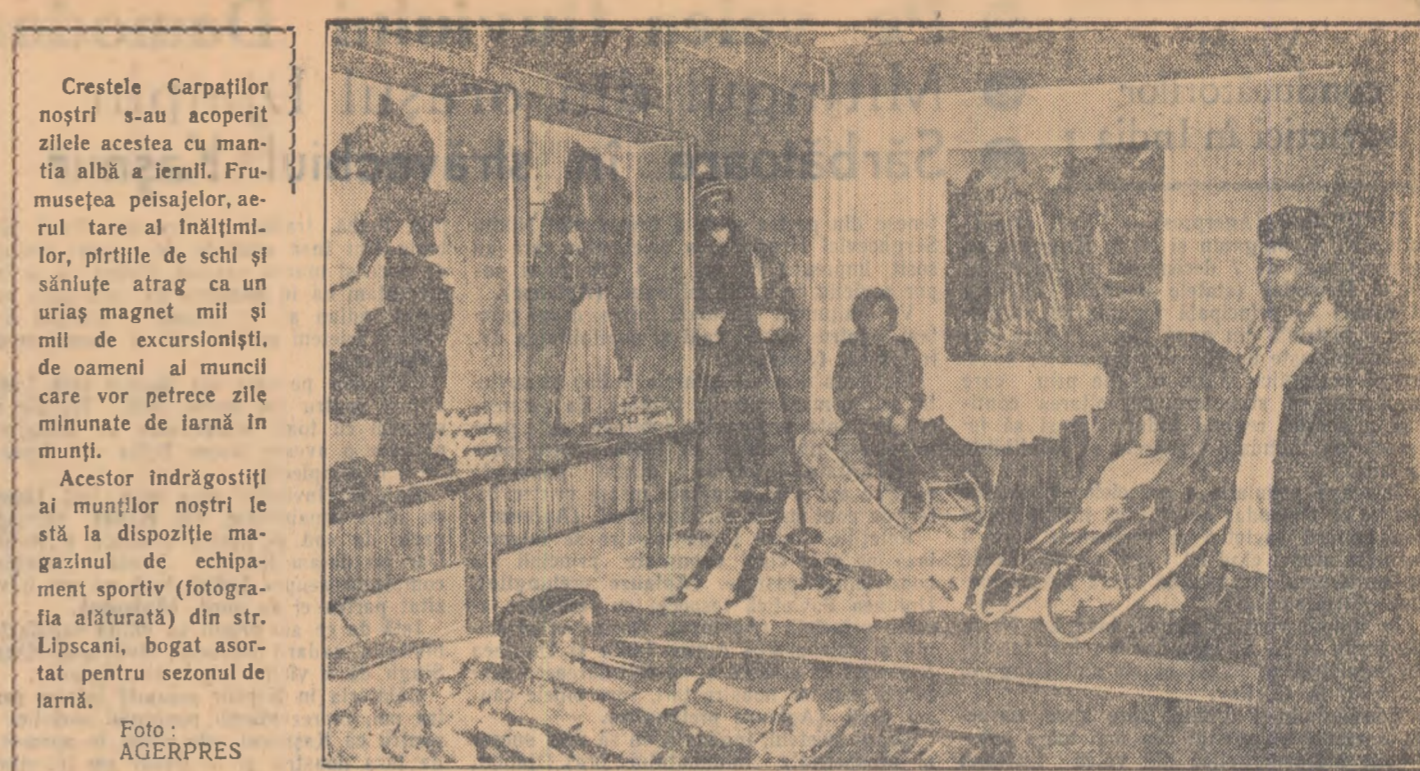
Din experiența Comsolului