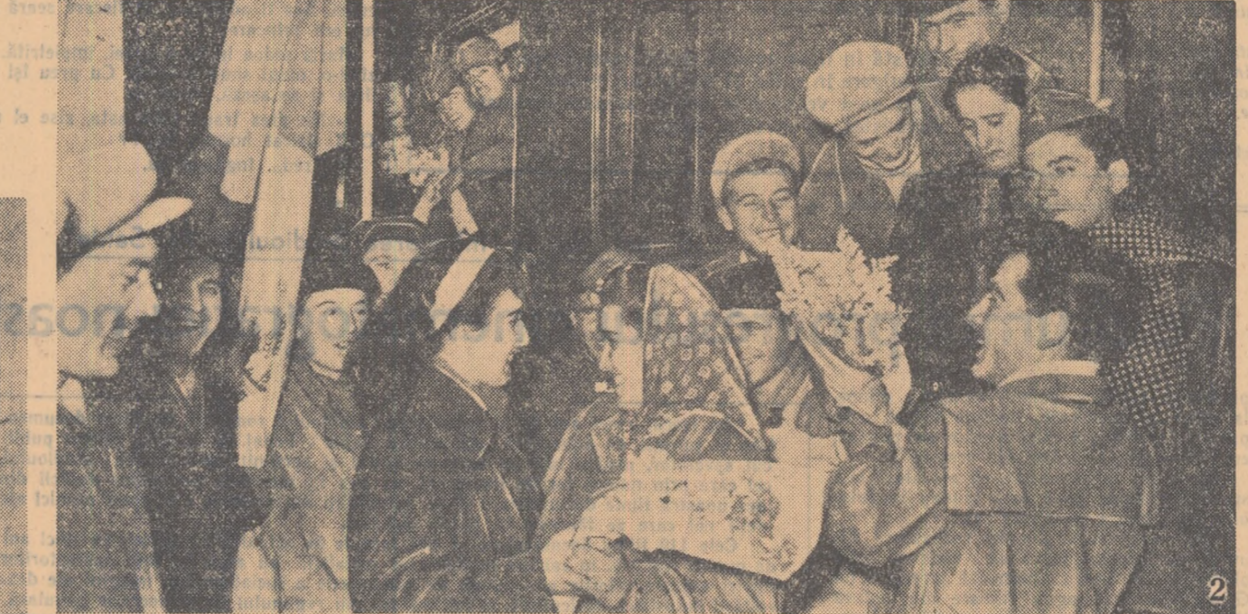
cu însuflețire. În cinstea Congresului partidului, constructorii s-au angajat să dea în folosință blocurile nr. 1 și nr. 2 cu aproximativ 50 de apartamente cu trei zile înainte de termen, la blocul nr. 2 bis 17 apartamente, la blocul nr. 7 vor fi gata 12 apartamente peste plan, acoperișul la blocul nr. 13 și alte lucrări. În fotografia nr. 1: un aspect de pe acest șantier. În curînd alți muncitori din cartier, locuitorii de ieri ai bordeielor vor locui în noile blocuri. Locomotiva s-a oprit în fața peronului Gării de Nord din București. Veselie, cîntec, atmosferă de sărbătoare. Brigadierii, constructorii ai liniei peate Tg. Jiu-Tismana, au pornit spre Bicaz să se alăture celor de pe șantierul tineretului la marea construcție a hidrocentralei. Rîndurile lor au crescut cînd încă o brigadă formată din zeci de tineri din Capitală. (fotografia nr. 2). (Citîți în pagina 3-a reportajul de la sosirea brigadierilor la Bicaz). Pericol la poarta lui Dungu? Nu vă neliniștiți! Fotografia nr. 3 surprinde un aspect de ultimul antrenament al echipei „Locomotiva Grivița Roșie” în vederea meciului de duminică ce-l va susține cu C.C.A. în cadrul semifinalei „Cupei R.P.R.”. Antrenorul Ronay ce asistă la antrenament împărtășește speranțele tuturor suporterilor echipei celeriste. Intr-un colț al expoziției o lucrare artistică deosebită stîrnete curiozitate. Este „Mama”, lucrarea fînsrelor sculptorilor Gertler Zalma. Jana de curînd absolventă a Institutului de Arte Plastice. (fotografia nr. 4).