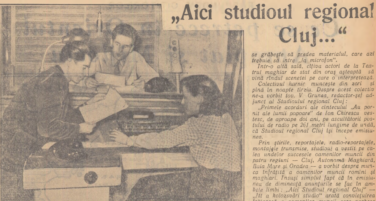
In studio

Redacția așteaptă ca angajamentele să fie traduse în viață, dîndu-se mai ales atenție conținutului de idei al propagației prin conferințe, în vederea înarmării tineretului cu noi cunoștințe, a mobilizării lui la îndeplinirea politicii partidului.