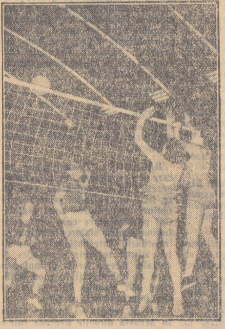
Blocajul echipei noastre feminine respinge un atac al jucătoarelor sovietice