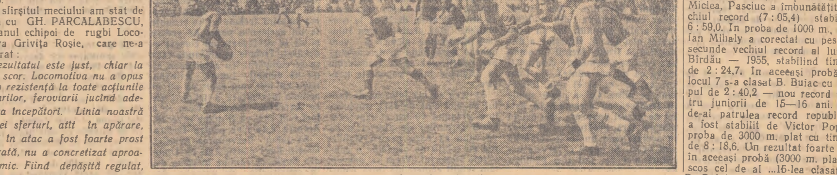
Si acum, o deschidere lungă... de către muncă o înlocuiește.

„Rezultatul este just, chiar la acest scor. Locomotiva nu a opus nici o rezistență la toate acțiunile militare, feroviarii jucînd adesea ca începători. Linia noastră de trei sferturi, atît în apărare, cît și în atac a fost foarte prost inspirată, nu a concretizat aproape nimic. Fîind depășit regulat, s-a ajuns la situația ca linia de