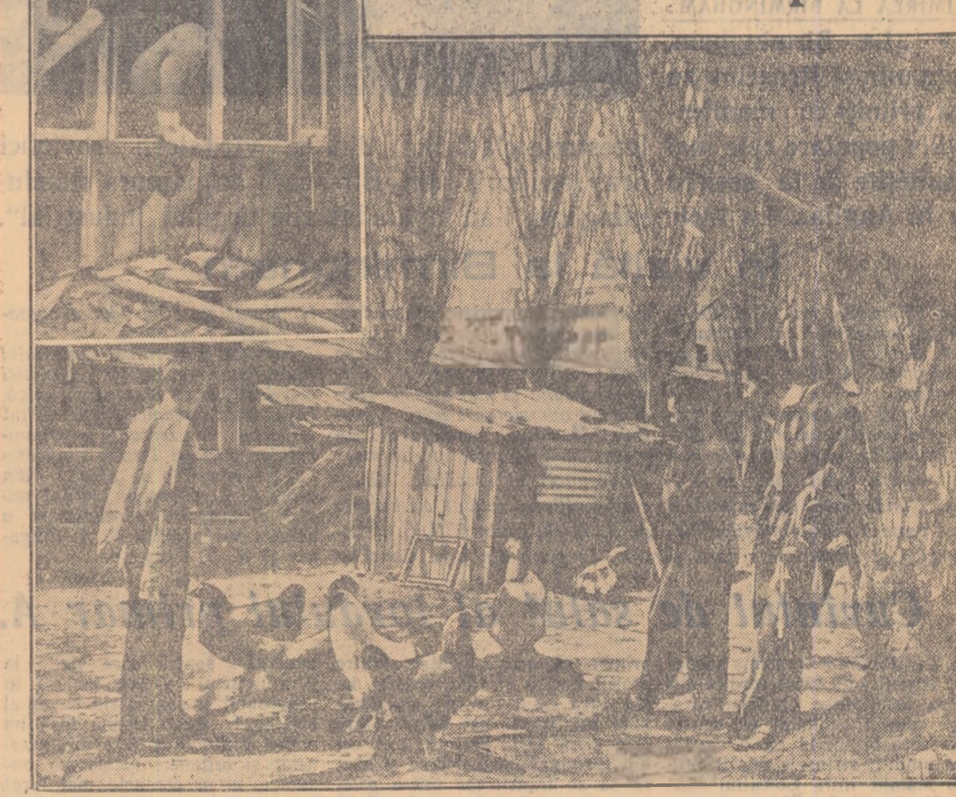
Nul Fotografia noastră înfățișează un aspect al unui din „te-

renurile” de sport de la Institutul medico-farmacologic din Capitală. Acolo unde anul trecut erau piste bine amenajate, astăzi se ridică gunoarie menajere, cotodăcesc liniștite găinile, iar cabinetele și vestiarele care au mai rămas în picioare — nu se știe prin ce minune — oferă specialiștilor în sărituri în înălțime, prilejul unui veritabil antrenament la... fereastră (vezi clișeul de sus).