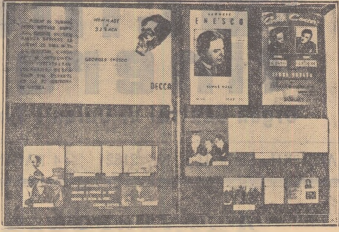
Un panou din expoziție

S-a împlinit un an de cînd a închis ochii, depănat de țară, marele artist al poporului nostru, George Enescu. În inima noastră trăiește amintirea omului care a turnat atât de sublim în sunete bogat suflet al poporului său. Unii îl cunosc muzica, la alții veștile despre genialul lui au ajuns pe calea cuvintului scris. Cei mai fericiți l-au putut vedea și asculta pe Enescu pe estrada de concert. Fiecare dintre noi, într-un fel sau altul, și-a format o imagine despre el. Această imagine o putem să o așezăm ca lumină.